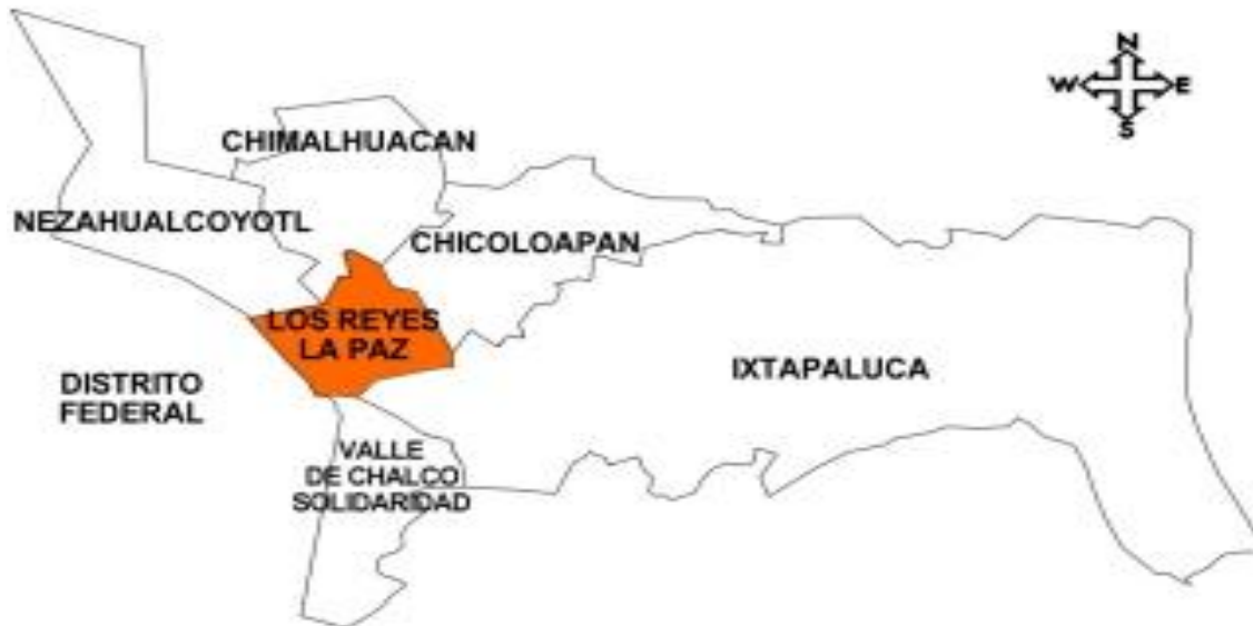
ANEXO 1 UBICACIÓN GEOGRÁFICA DEL MUNICIPIO DE LOS REYES, LA PAZ.