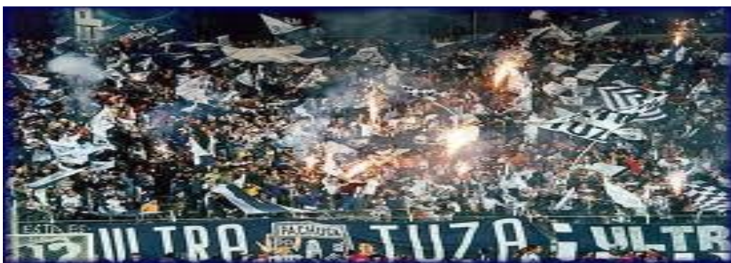
BARRA ULTRA TUZA (PACHUCA)

Siempre con un comportamiento ejemplar que no es casualidad, ya que la barra tiene un estricto reglamento para sus integrantes.