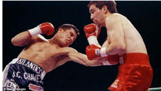
JULIO CÉSAR CHÁVEZ VS GREG HAUGEN (1993)