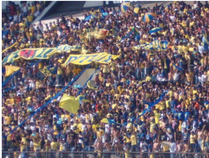
“EL RITUAL DEL KAOZ” (AMÉRICA)

Actualmente El Ritual se desligó de la directiva, es decir, paga sus boletos y sus viajes cuando el equipo juega de visitante.