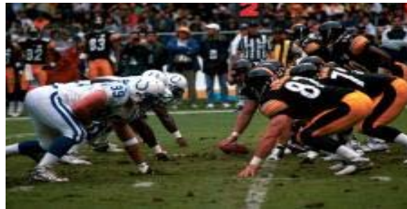
AMERICAN BOWL PITTSBURGH VS INDIANAPOLIS (2000)