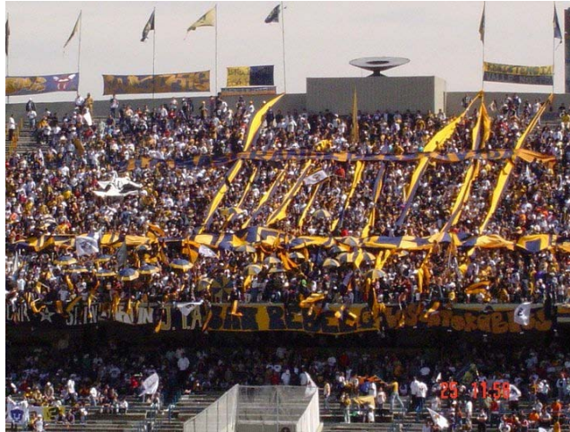
“LA REBEL” (PUMAS)

Su contraparte nace un año después, “La Monumental”, la barra creada por el presidente del Club América, Javier Pérez Teuffer, por la necesidad de acercar el club a la gente, ¿porqué acercarle el club a la gente siendo que América es uno de los equipos más populares de nuestro país?