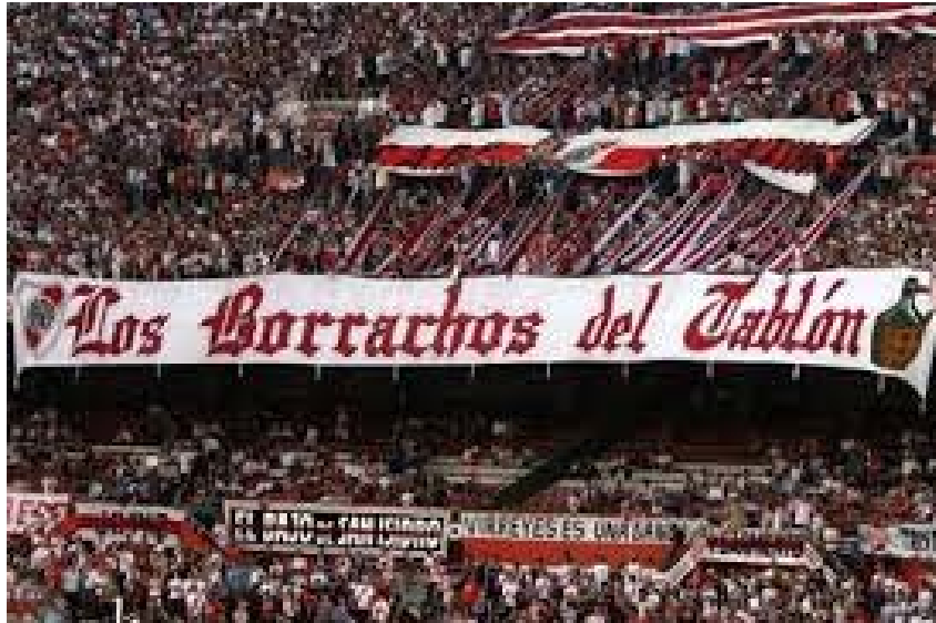
LOS BORRACHOS DEL TABLÓN (RIVER PLATE, ARGENTINA)