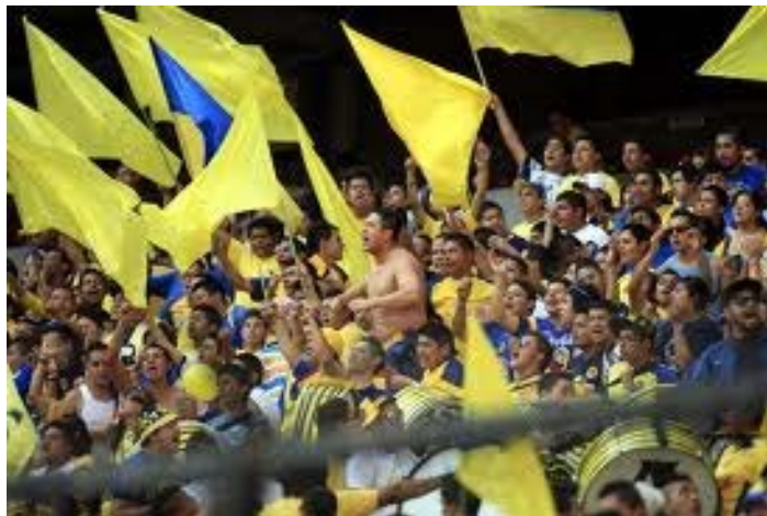
LA DISTURBIO (AMÉRICA)

Ojalá que los privilegios de estas barras no pasen de ahí, porque este caso se parece mucho a lo que les mencionábamos de Argentina en líneas anteriores. Cuidado señores directivos, porque si no controlan esto, se les va a salir de las manos y después pagarán las consecuencias de algo que ustedes mismos crearon.