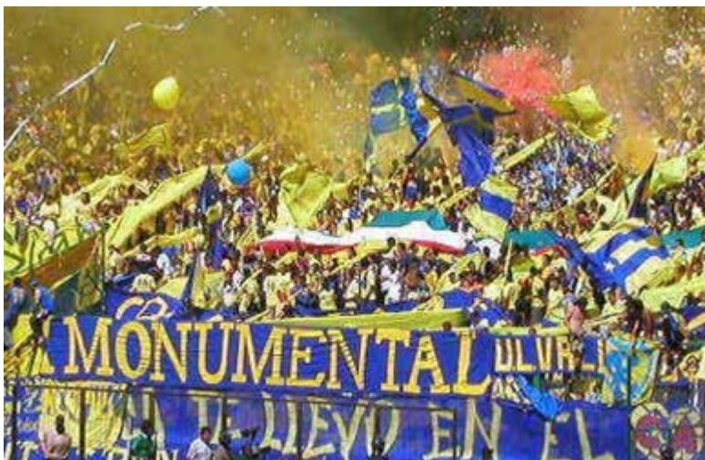
“LA MONUMENTAL” (AMÉRICA)

Porque los noventa no fueron nada productivos para el cuadro de Coapa, y la gente se alejaba de la tribuna americanista, fue tal su propaganda a través de imágenes de las cámaras en los partidos de “Las Águilas”, que hizo que pasara de nacer con 25 jóvenes a tener siete mil almas en el graderío de Santa Úrsula.