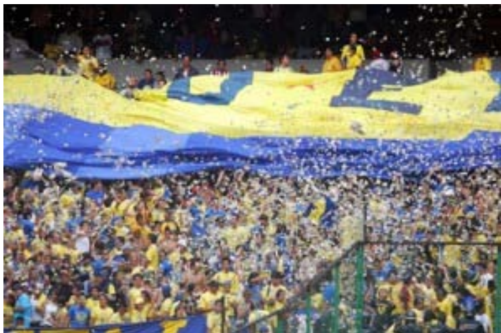
"LA MONUMENTAL" (AMÉRICA)

La Monumental tiene rivalidad con todas las barras de los equipos rivales, por pertenecer al América, pero esa pasión se desborda cuando se trata de un partido contra Pumas. Además de jugarse el partido en la cancha, también se juega en las tribunas entre "La Monu" y "La Rebel".