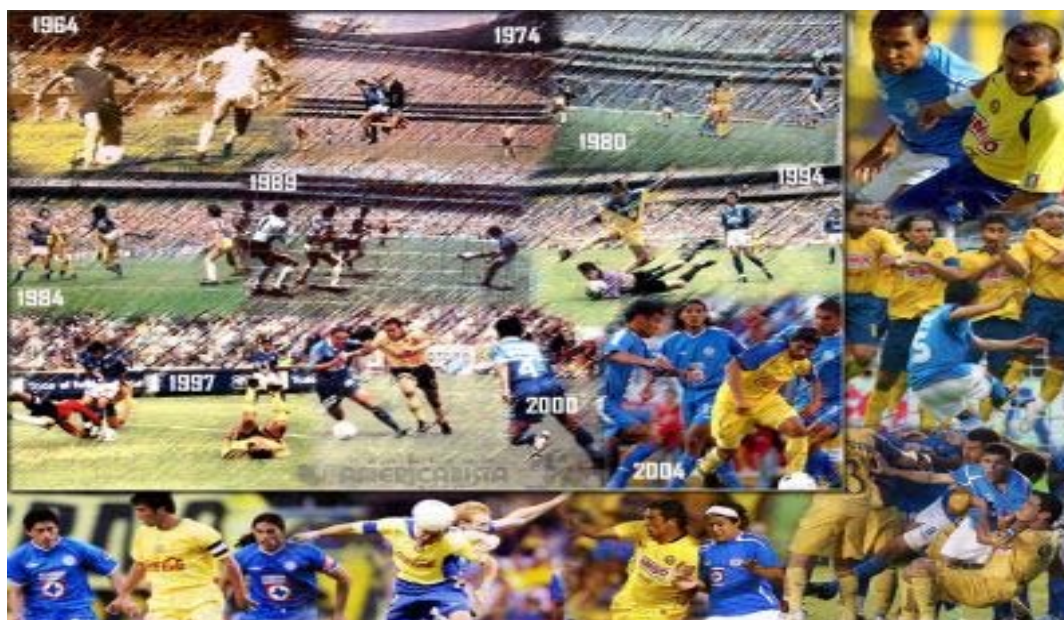
EL AMÉRICA, A TRAVÉS DEL TIEMPO

Sin embargo, esto no se debe a que se le tenga mala voluntad o sea la víctima en el medio futbolístico mexicano, sino que este equipo así fue diseñado, es decir, esa es la imagen que sus dueños quieren que proyecte, y son todos estos factores los que hacen que se distinga sobre los demás, y le han permitido ganarse un lugar dentro de nuestra liga. 20