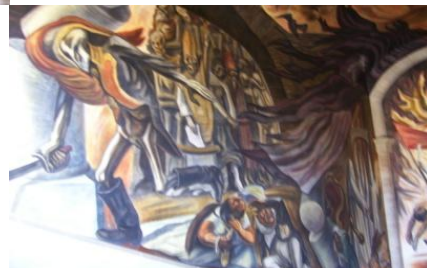
El mural de José Chávez Morado titulado “La abolición de la esclavitud” en la escalinata de honor de la Alhóndiga de granaditas pintado en el año de 1955.