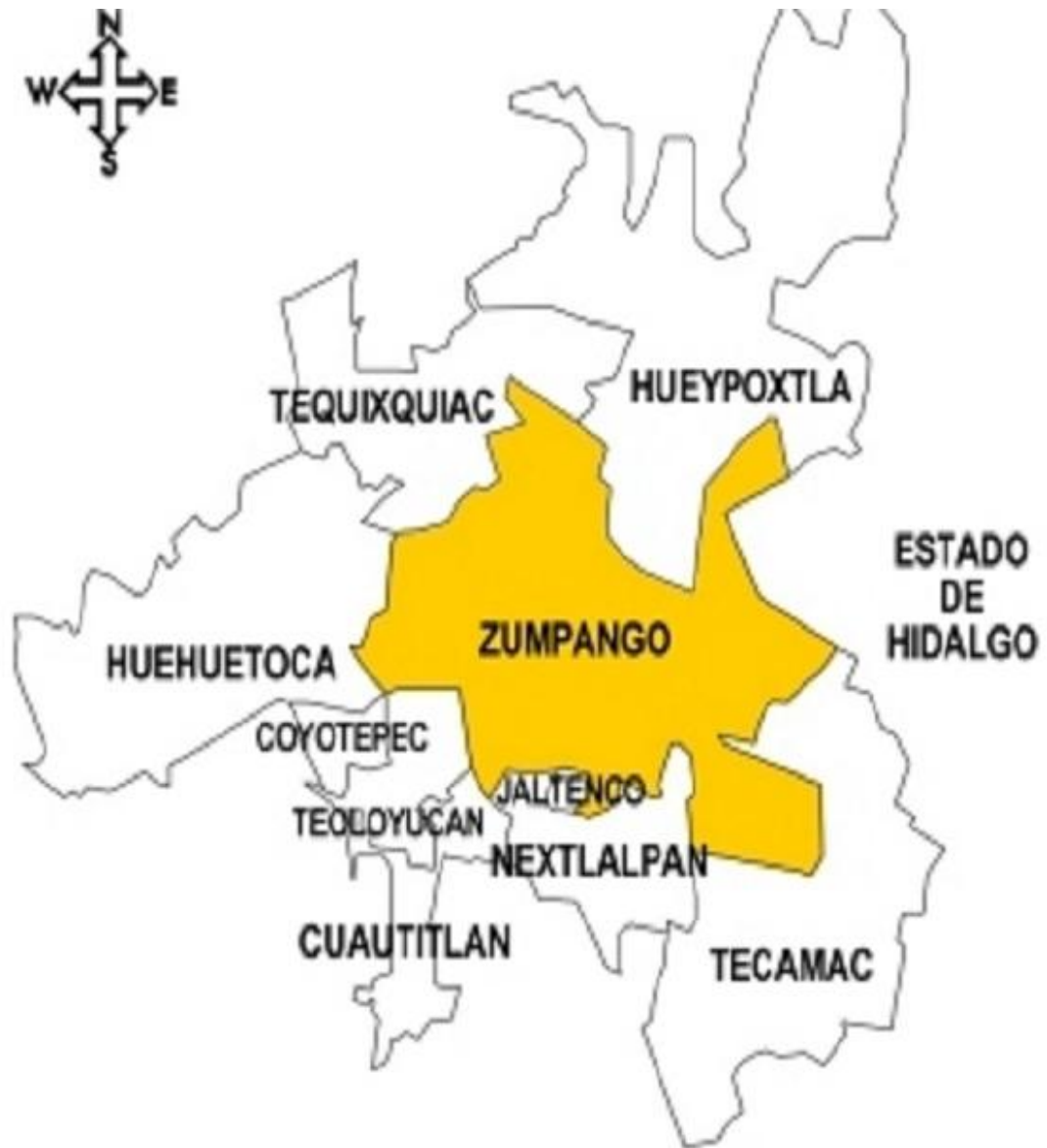
Mapa que muestra al municipio de Zumpango con sus respectivos límites