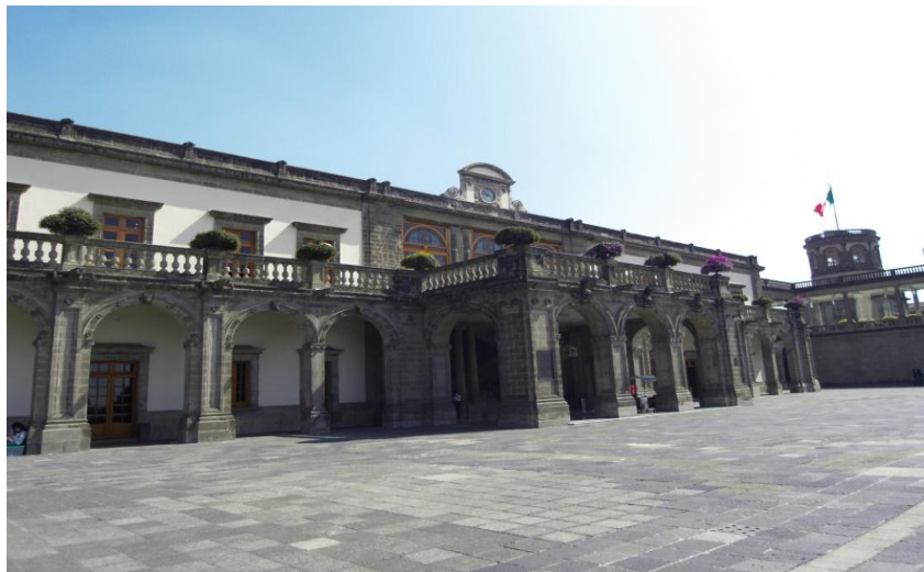
El Museo Nacional de Historia en el Castillo de Chapultepec, creado en 1944