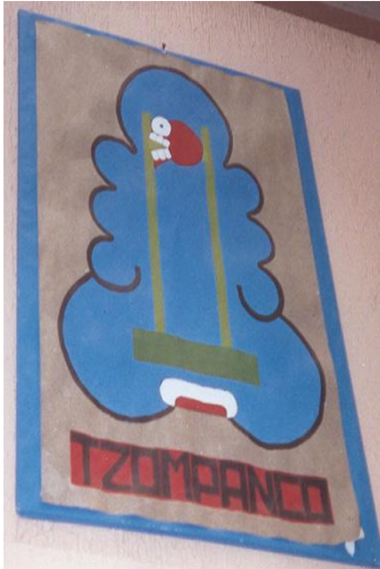
Jeroglífico del toponímico de Tzompanco, que en lengua náhuatl significa “en el lugar del Zompantli”. (Retablo ubicado en la Casa de Cultura del Municipio).