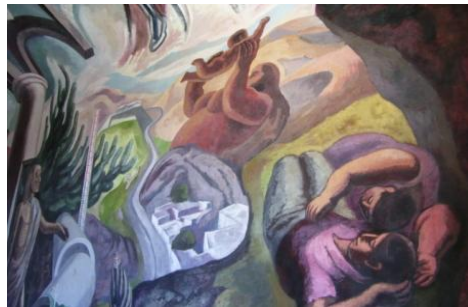
El mural de José Chávez Morado titulado “Canto a Guanajuato” en la escalinata poniente de la Alhóndiga de granaditas pintado en el año de 1966.