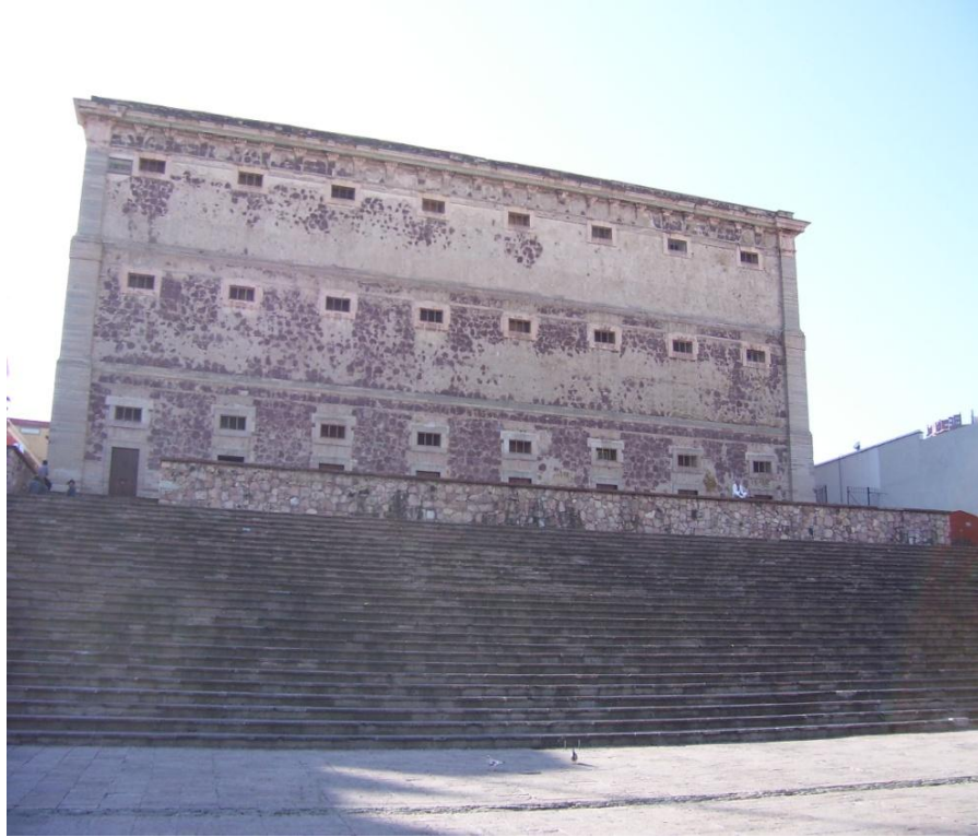
Explanada de la “Alhóndiga de Granaditas”, construida en 1966.