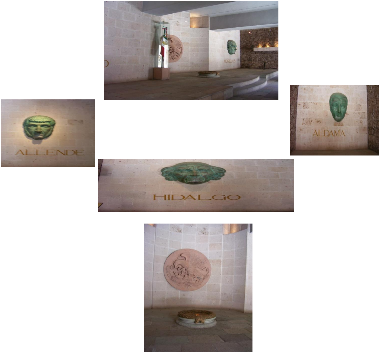
El Recinto de los Héroes creado en 1967, en el Museo Regional de Guanajuato “Alhóndiga de Granaditas”