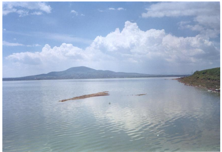
La Laguna de Zumpango, con el cerro de San Juan Zitlaltepec al fondo.