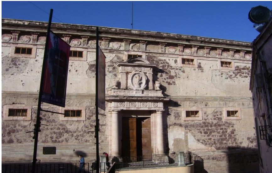
Fachada de la “Alhóndiga de Granaditas” sobre la calle Alhóndiga en la Ciudad de Guanajuato, construida entre 1797 y 1809