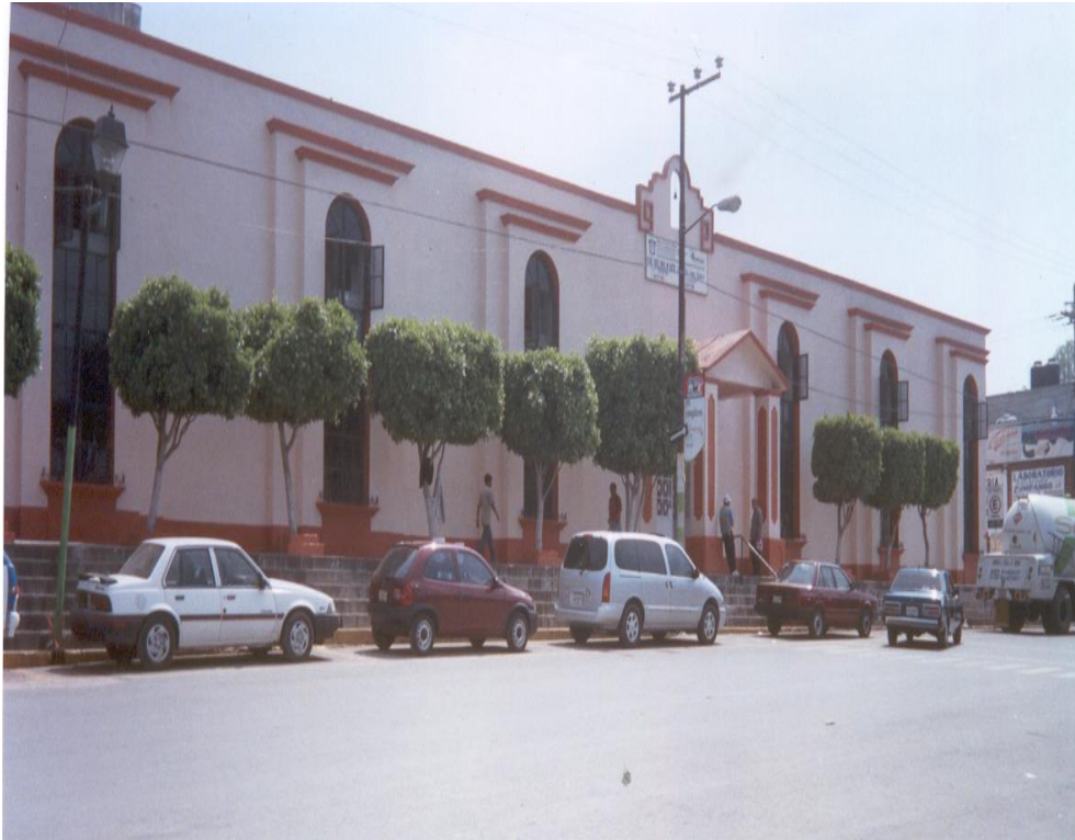
La Escuela Secundaria No. 270 “Adolfo López Mateos”, donde inicia sus labores en 1974 la Escuela Normal de Zumpango.