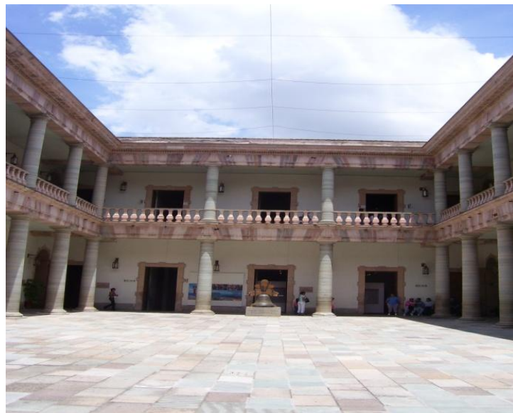
El patio central del Museo Regional de Guanajuato “Alhóndiga de Granaditas” de forma rectangular y planta columnada.