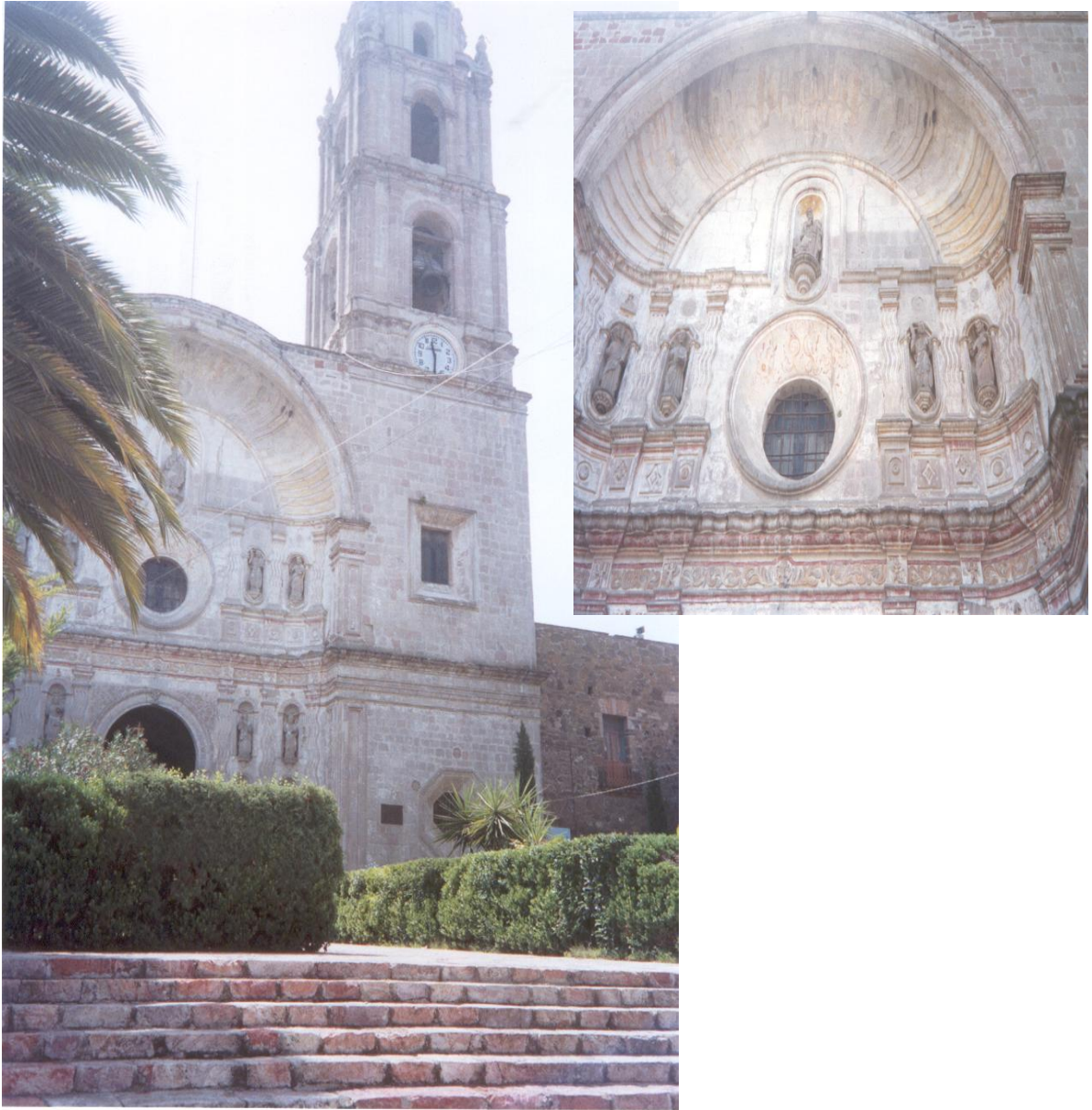
La fachada de estilo neoclásico del templo de la Purísima Concepción en el Municipio de Zumpango, construida entre 1707 y 1722.