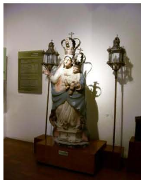
Salas de Historia en el Museo “Alhóndiga de Granaditas”