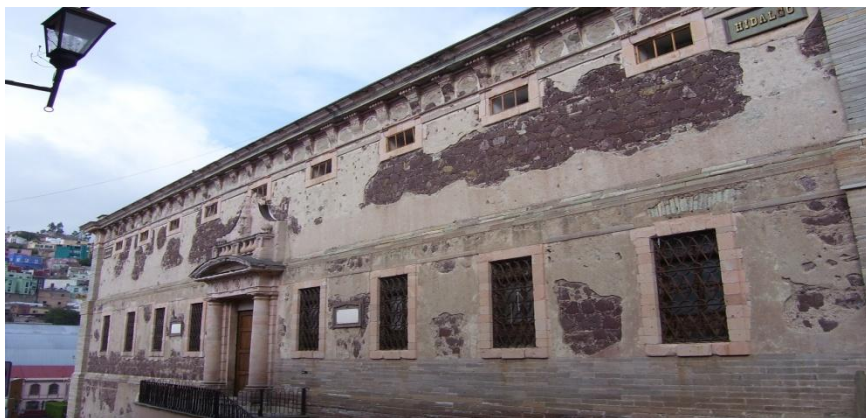
Fachada de la “Alhóndiga de Granaditas” sobre la calle Mendizábal en la Ciudad de Guanajuato, construida entre 1797 y 1809