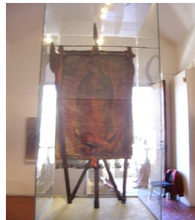
Tipo de panel expositivo o mamparas en el Museo Regional de Guanajuato “Alhóndiga de Granaditas”