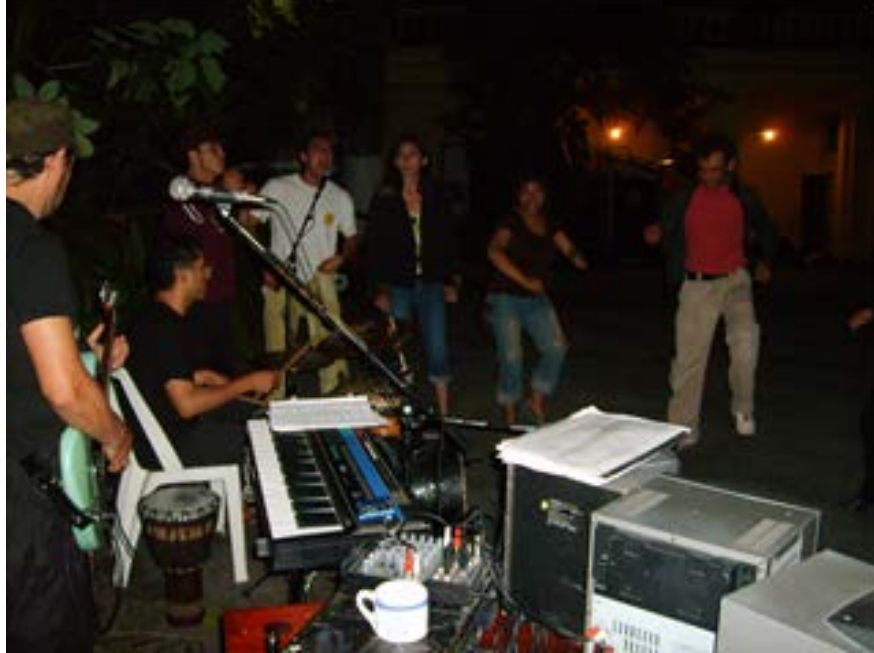
Ilustración 17: Ensayo nocturno. Veracruz