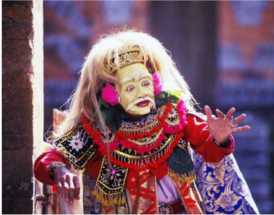
Imagen 7: Danza-teatro balinés.