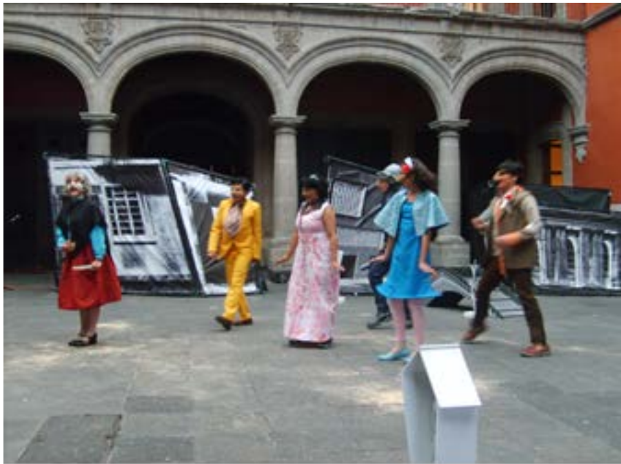
Ilustración 18: Estreno