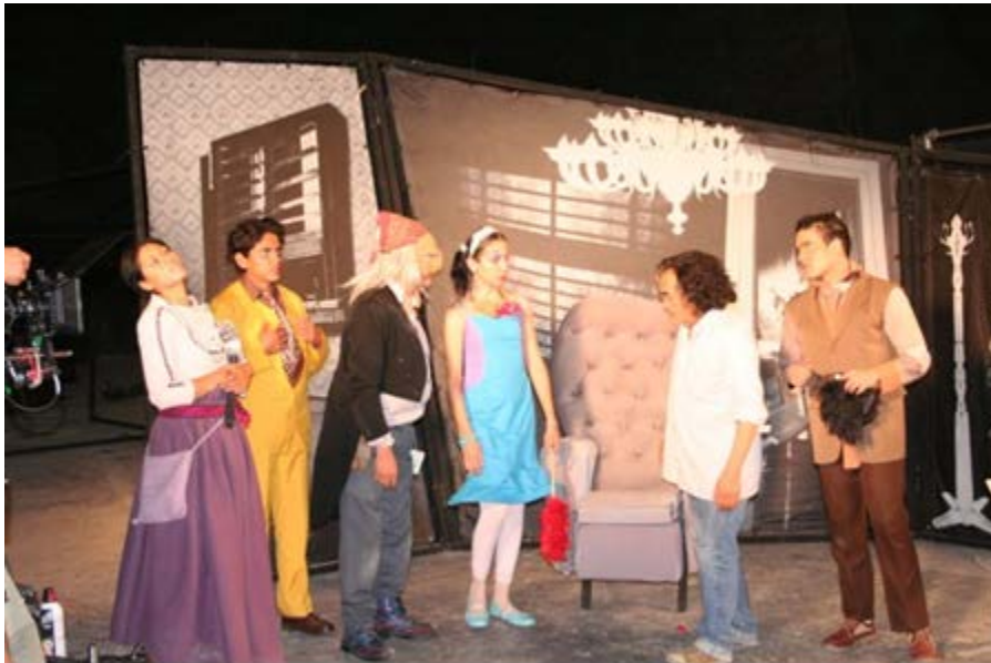
Ilustración 20: Filmación