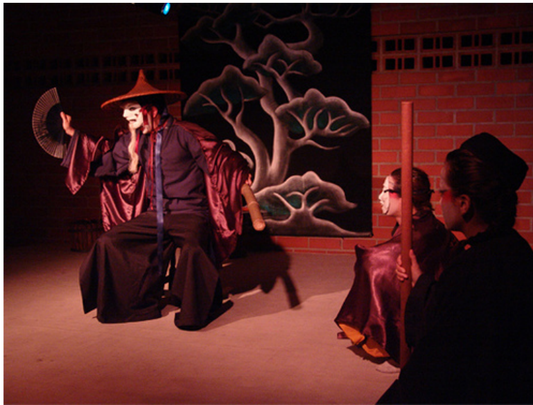
Imagen 3: Escena de teatro Noh.