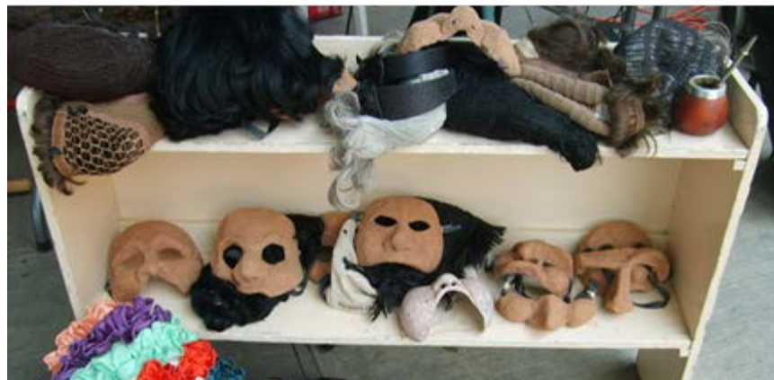
Ilustración 14: Nuestras máscaras