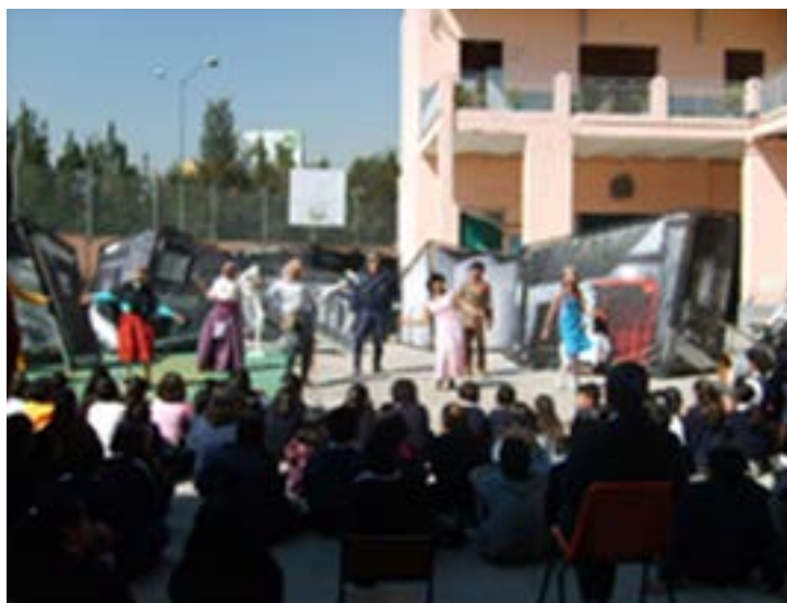
Ilustración 21: Presentación