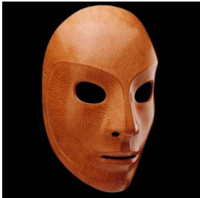
Imagen 10: Máscara neutra.