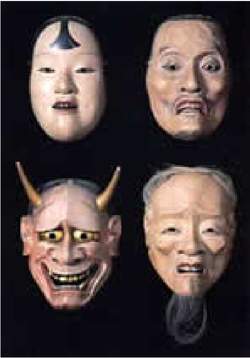
Imagen 1: Máscaras de teatro Noh.