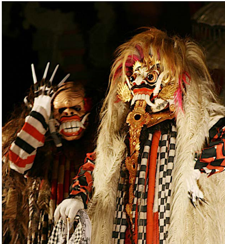
Imagen 8: Personajes. Danza-teatro balinés.