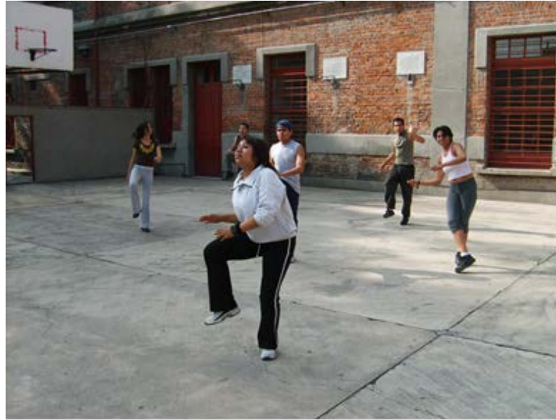
Ilustración 13: Entrenamiento