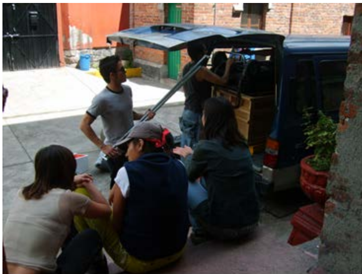
Ilustración 16: Fin de ensayos en la escuela