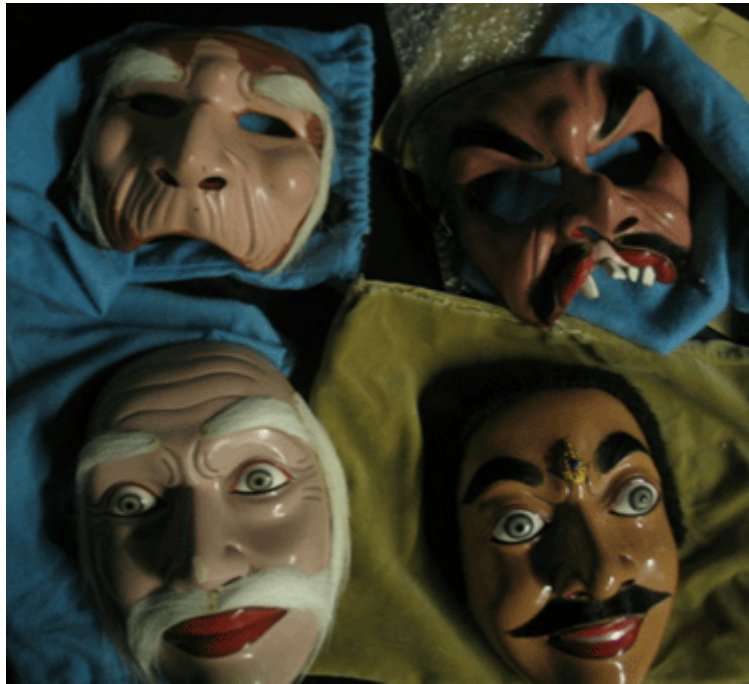
Imagen 9: Máscaras balinesas.