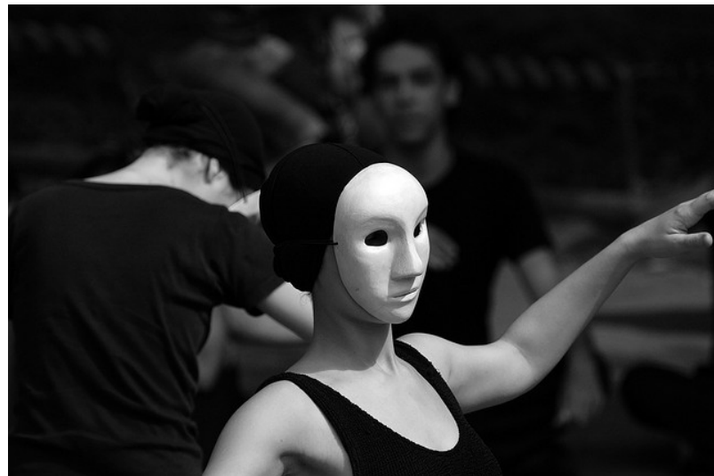
Imagen 12: Actriz con máscara neutra.