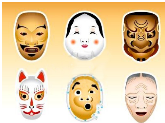
Imagen 2: Ilustraciones de máscaras de teatro Noh.