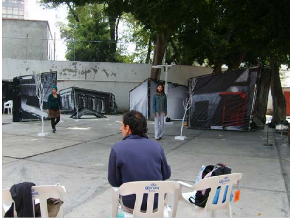
Ilustración 15: Escenografía.