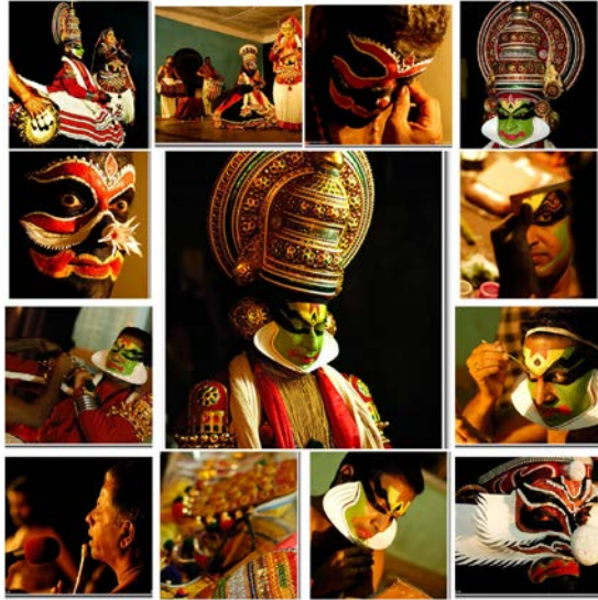
Imagen 5: Maquillaje y vestuario. Kathakali