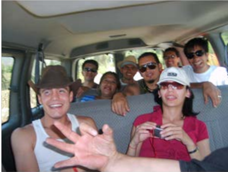
Ilustración 19: El grupo.