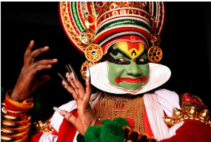
Imagen 4: Mudra. Kathakali.