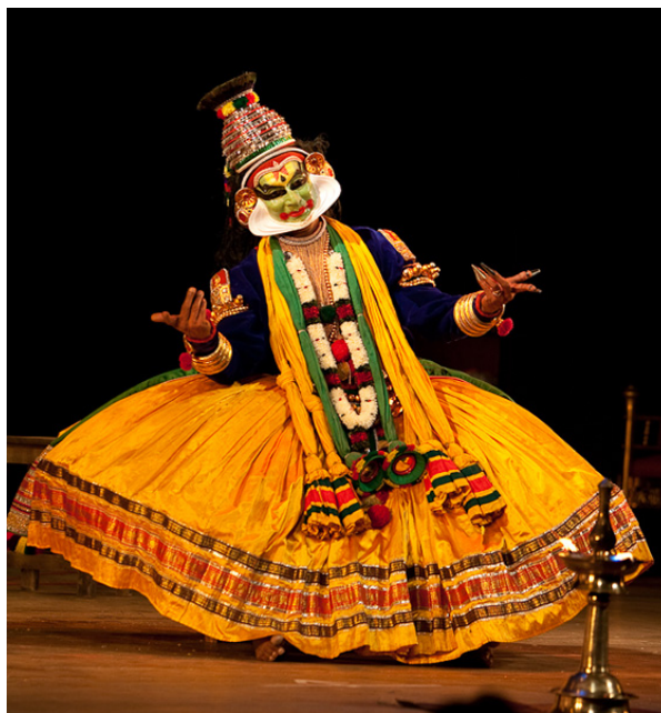
Imagen 6: Postura de pies y manos. Kathakali.