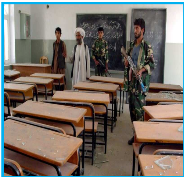
Escuela de Afganistán ocupada por grupos militares www.rferl.org/content/article/1078044.html 7 marzo 2014

Los grupos armados anti-gubernamentales abarcan a todos los individuos y grupos armados que en la actualidad han participado en guerra u oposición armada contra el gobierno de Afganistán y contra las fuerzas militares internacionales. Estos incluyen aquellos que se identifican como los talibanes, así como los individuos y los grupos armados no estatales organizados que participan directamente en las hostilidades y asumiendo una variedad de etiquetas que incluye la Red Haqqani*, Hezb -e- Islami*, Movimiento islámico de Uzbekistán*, la Unión Islámica Yihad*, la Lashkar –e- Tayyiba* y Jaish –e- Muhammad*. La clasificación de los grupos armados opuestos al gobierno no se aplica al delincuente común, excepto si el grupo o individuo se involucra directamente en actos hostiles en una parte del conflicto. 159