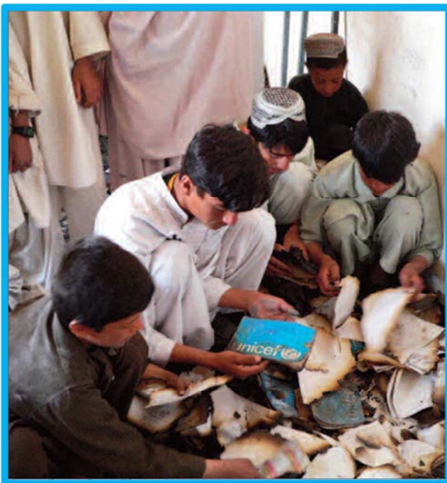
AFGANISTÁN: estudiantes afganos inspeccionan los libros quemados en un salón de clases en Kandahar el 15 de marzo de 2008. La escuela fue incendiada por militantes el día anterior. Human Rights Watch. Schools and Armed Conflict. A Global Survey of Domestic Laws and State Practice Protecting Schools from Attacks And Military Use. 2001.

En ese año, diversos maestros de primaria fueron secuestrados y, en un caso, a un vigilante le cortaron una oreja y la nariz como castigo por cooperar con el gobierno. En otro incidente, hombres armados prendieron fuego a la Escuela Ortablaq en el norte de la provincia de Kunduz y le cortaron las orejas al velador. Aunado a ello, en algunas escuelas, se entregan cartas, conocidas como “cartas nocturnas” las cuales ordenan a los maestros a salir y son firmadas en nombre de líderes talibanes, como el mulá Muhammad Omar. En la escuela Miyan Abdul Hakim, de la ciudad de Kandahar, los atacantes aterrorizaron al velador con el fin de abandonar la escuela donde laboraba. 174