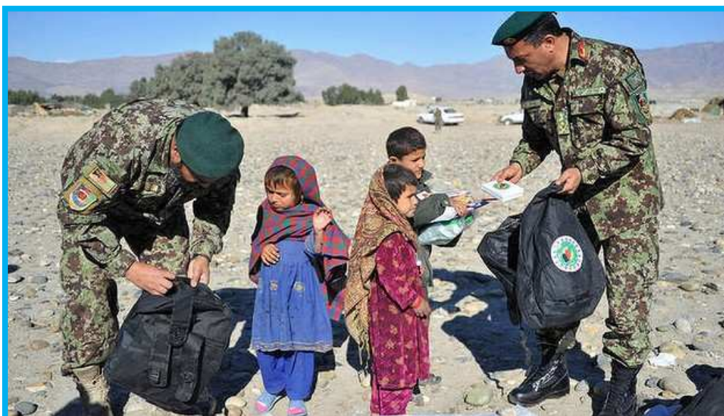
Ejército Nacional afgano inspeccionando mochilas en un retén militar. www.smh.com.au/world/afghan-children-flee-homes-for-the-chance-to-learn-20121226-2bwfn.html 10 de abril de 2014

fuerzas extranjeras (Fuerzas de Seguridad Nacional con el apoyo de las fuerzas militares internacionales) y los grupos armados no estatales.