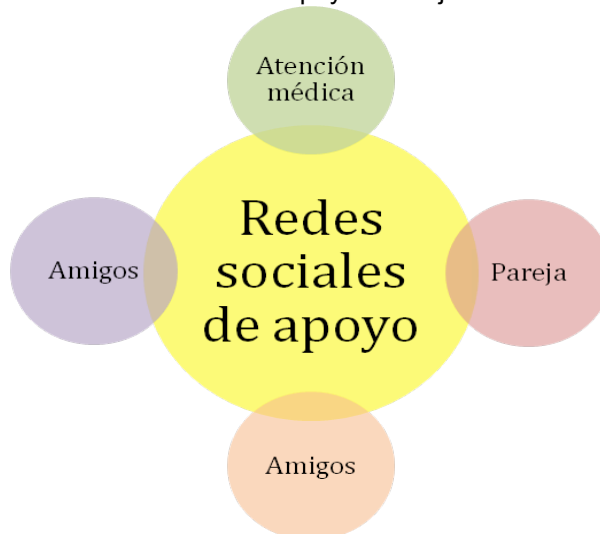
Figura 3. Las redes sociales de apoyo de mujeres con mastectomía.