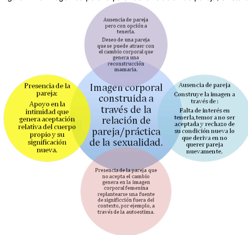
Figura 2. La imagen corporal a partir de la relación de pareja, exista o no.