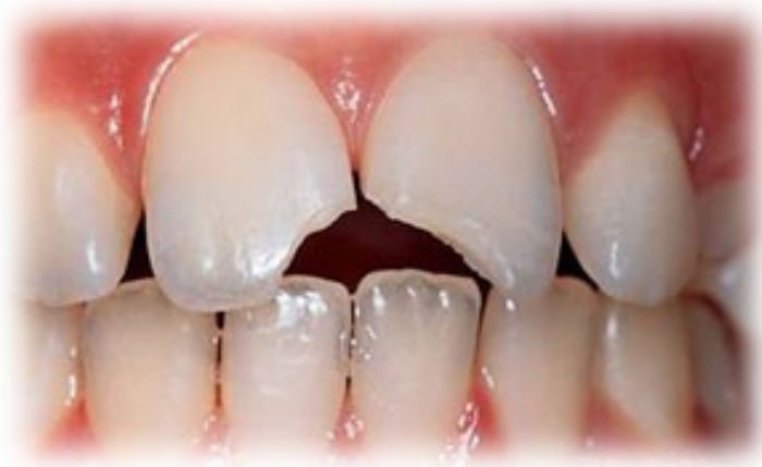
Figura 17. Traumatismo dental 59

El trauma cráneo-facial y bucodental afecta a personas de todas las edades, de cualquier género y cultura, con frecuencia no es intencional y es causado por accidentes. 58 (Fig. 17) El estilo de vida y la inconciencia, propios de la adolescencia, hacen que durante esta fase los individuos estén más susceptibles a accidentes de diferente naturaleza, lesionando las estructuras bucales como tejido blando o duro.