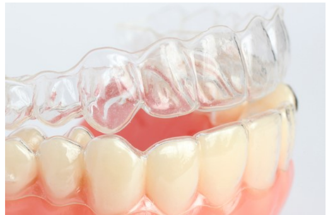
Figura 20. Férula oclusal 69

Por otro lado se debe poner especial cuidado a síntomas de estrés psicológicos propios de la edad, y sobre todo cuando esté relacionado con bruxismo y alteraciones musculares de la Articulación temporomandibular (ATM) 68 y en aquellos casos donde el adolescente refiera deportes de alto riesgo constituyendo un grave problema para los órganos dentarios permanentes, el tratamiento en estos casos es la elaboración de guardas o férulas oclusales de manera que eviten un daño severo en el diente joven.