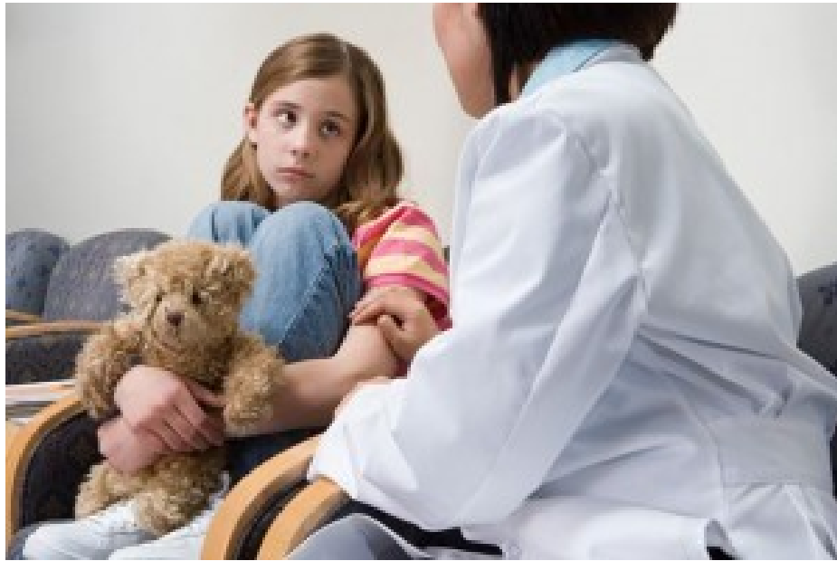
Figura 9. Miedo 37