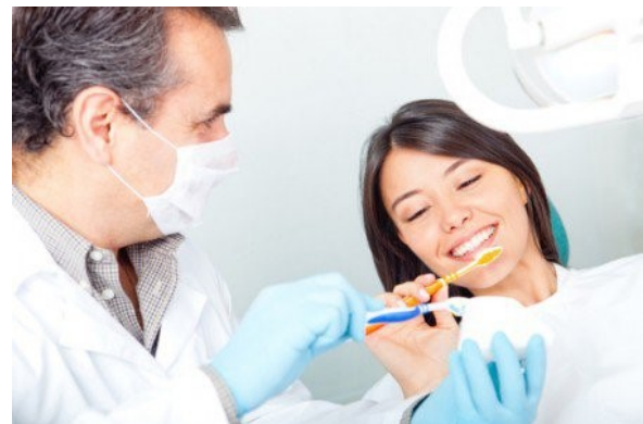
Figura 19. Técnica de cepillado. 65

Se debe intervenir directamente con las actividades que permitan el control de las alteraciones bucodentales, que corresponden en esta etapa siendo los más efectivos, la técnica de cepillado (Fig.19) donde solo se debe modificar la técnica que hayan adoptado los adolescentes sin tratar de cambiarlo pues tenderá al fracaso y el uso de aditamentos como el hilo dental el enjuague bucal serán de gran importancia como complemento de la limpieza bucal.