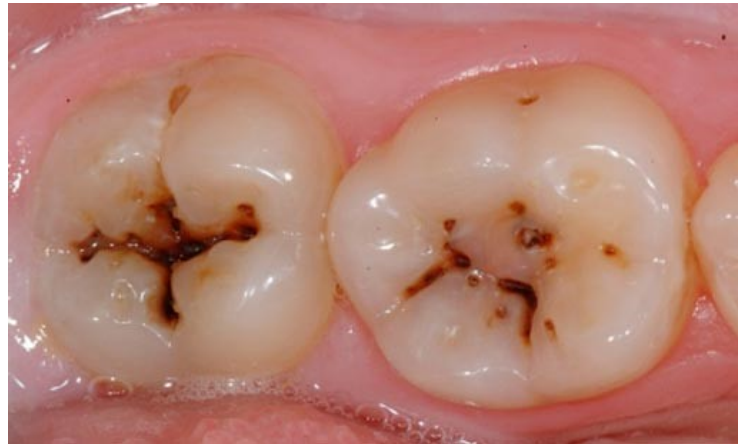
Figura 13. Caries en molares permanentes 46

La adolescencia es por sí sola es un periodo de exacerbación habiendo un aumento en la incidencia de lesiones cariosas, lo que está fuertemente relacionado con los cambios físicos y sociales e inherentes al periodo. El cambio de dientes es uno de los tantos cambios enfrentados por los adolescentes, y además de dificultar la higienización, hace que el adolescente adquiera un mayor número de superficies susceptibles para desarrollar caries.