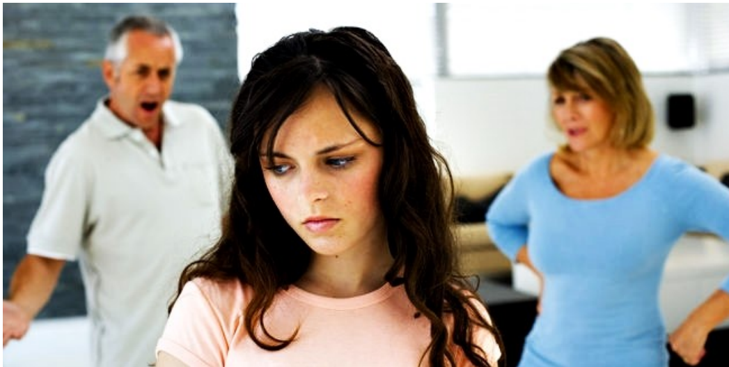
Figura 6. Conflicto con los padres 33

Cambios psicosociales destacan las relaciones sentimentales y amorosas y el inicio de las relaciones sexuales, todo ello en interrelación con los valores y experiencias del grupo de amigos. Predominan cada vez más los conflictos con la familia (Fig. 6) va mostrando menos interés por los padres y dedica mucho más tiempo a sus amigos, defienden su opinión y discuten frontalmente con sus padres en busca de límites, identidad, independencia y libertad.