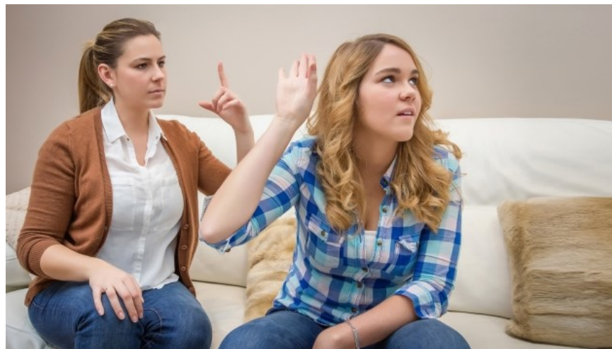
Figura 7. Conducta desafiante 35