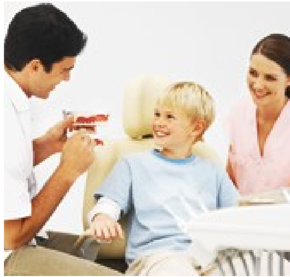
Figura 11. Atención Odontológica al Adolescente 39

La primera consulta ejerce una importante influencia en el establecimiento de una buena relación Cirujano Dentista-paciente. Si el adolescente viene acompañado de sus padres, ellos deben estar presentes en la primera consulta (Fig. 12), para que el Cirujano Dentista pueda escucharlos activamente y observar la relación padre e hijo. Es importante resaltar que a los padres se les debe informar acerca de los tratamientos así como las ventajas y desventajas de esto, porque serán ellos los que firmen el consentimiento informado. Sin embargo, el profesional debe tener en mente que el destinatario central de la consulta es el adolescente y que sus padres son importantes para su atención. 40