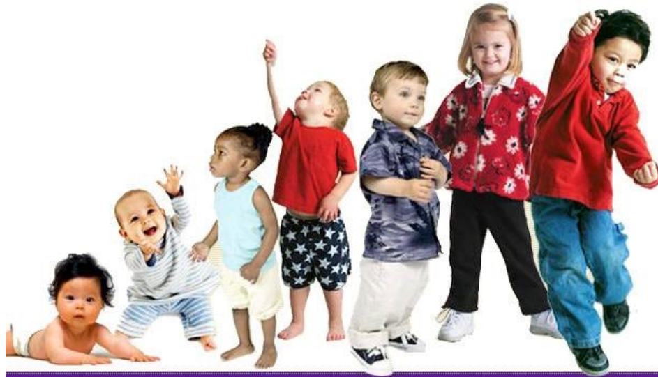
Figura 2. Desarrollo de la personalidad según Erikson 16

El cuerpo es el primer organizador de la identidad, los cambios corporales conllevan una nueva imagen que otorga al cuerpo una identidad sexual una identidad de género que es un conjunto de rasgos y características socioculturales propias de lo masculino y femenino. La pérdida de este sentimiento de confianza y seguridad en sí mismo, lo lleva a un sentimiento de confusión de la identidad, obstaculizando el desarrollo de la personalidad Adulta. 15