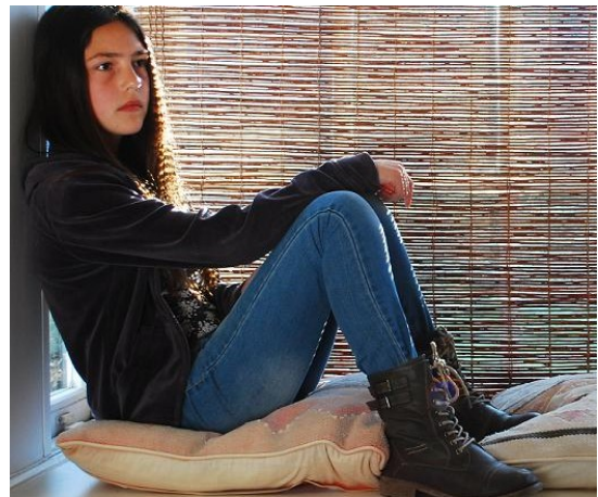
Figura 3. Pensamiento formal 21

Según Piaget, durante la adolescencia se desarrolla el pensamiento formal. (Fig. 3) Desde la fase anterior de las operaciones concretas comienza de forma gradual, a dominar nociones abstractas adquiriendo el pensamiento formal en la adolescencia, que se orienta hacia el futuro, empezando a construir proposiciones que cambiarán el pensamiento de lo real a lo posible. Este pensamiento formal permite al adolescente pensar, no solo en su existencia sino también en las otras personas 20