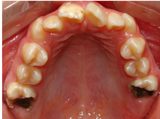
Figura 14. Destrucción de molares. 49

Los criterios diagnósticos expuestos en 2003 por la Academia Europea de Odontopediatría son los siguientes: