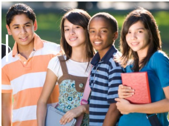
Figura 4. Adolescencia 28

La pubertad es la primera fase de la adolescencia y de la juventud, normalmente se inicia a los 10 años en las niñas, y a los 11 años en los niños, y finaliza a los 14 o 15 años. Y se lleva a cabo el proceso de cambios físicos, en el cual el cuerpo del niño o niña adquiere la capacidad de la reproducción sexual, la adolescencia (Fig.4), es el período de transición biopsicosocial que ocurre entre la Infancia y la vida Adulta; y la juventud es el estado que abarca los momentos intermedios y finales de la adolescencia así como los primeros de la edad adulta, y en un encuadre social comprende los grupos etarios entre los 15 y los 25 años. 27