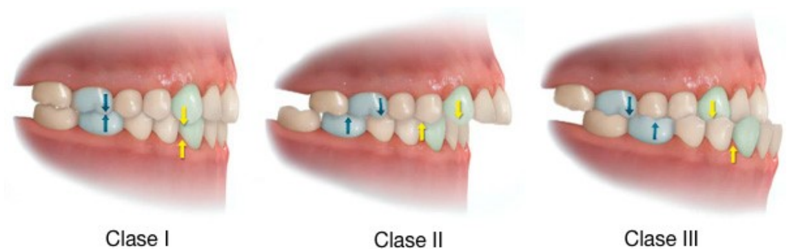
Figura 16. Maloclusiones 54

Dentro de las alteraciones bucales de mayor prevalencia se encuentran las maloclusiones, ya que afectan a un amplio sector de la población, por lo que son consideradas un problema de Salud Pública, sin embargo, su importancia se establece no sólo por el número de personas que la presentan, sino además, por los efectos nocivos que pueden generar en la cavidad oral. (Fig. 16)