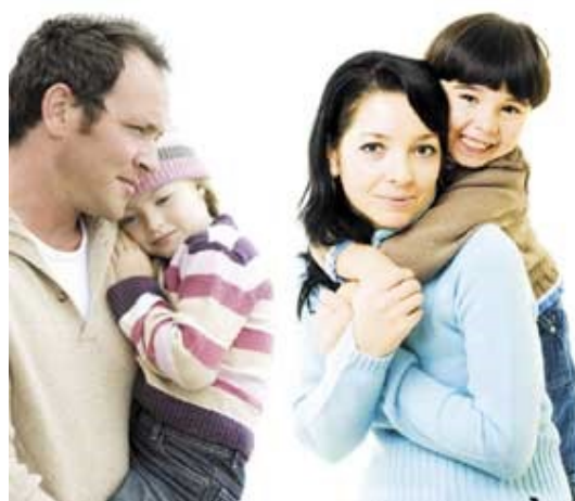
Figura 1. Estado Fálica 11