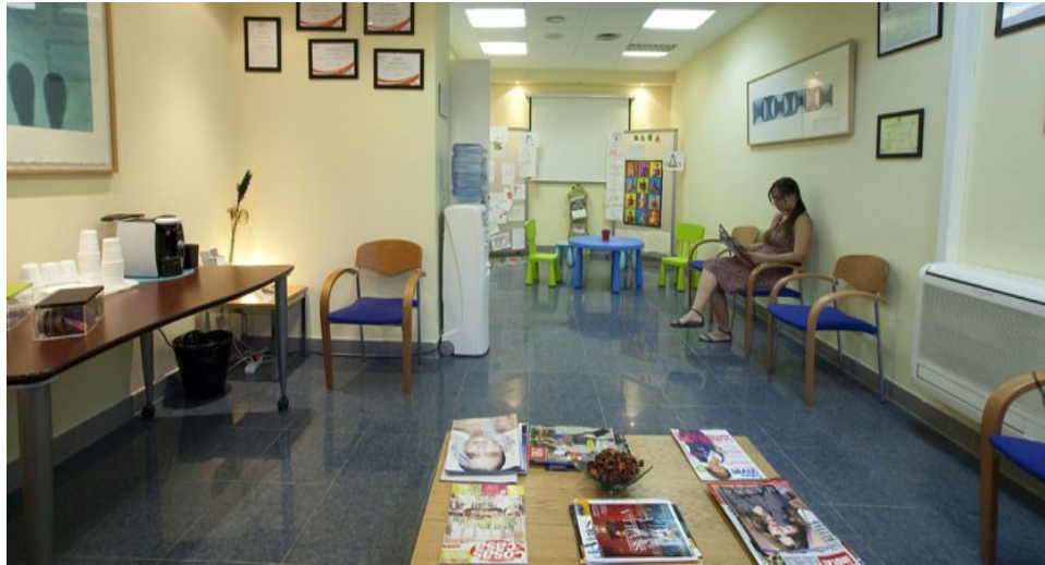
Figura 18. Sala de espera. 63