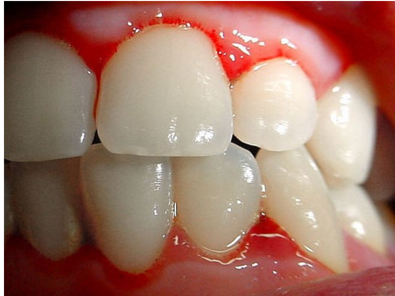
Figura 15. Gingivitis 53

es la pérdida de inserción irreversible, llegando hasta la pérdida de los órganos dentarios. 52