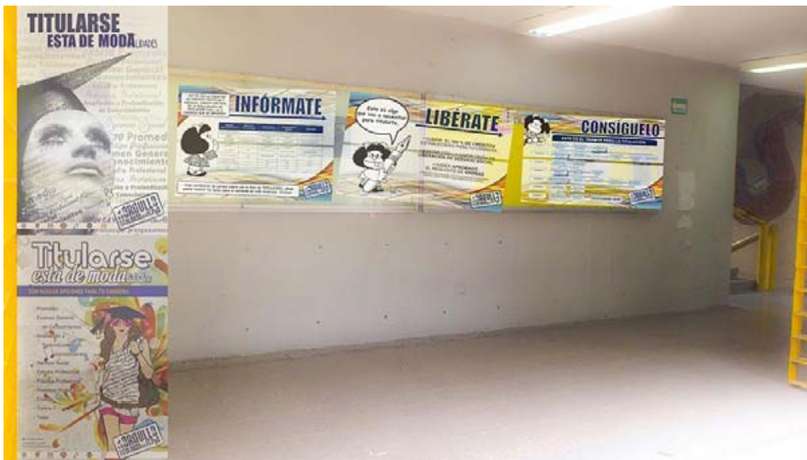
Pasillo de la titulación

Utilizando la mayor cantidad de espacios (físicos y digitales) de la facultad por los que transitan los estudiantes; incluyendo elementos impresos atractivos que reflejen la vida cotidiana de la comunidad. Con ello se busca acercarlos a la información que será desglosada con claridad en lo que llamaremos “ El pasillo de la titulación ” (se propone el edificio “A” planta baja, por el constante flujo de estudiantes a todas horas y aprovechando que es un lugar amplio con buena visibilidad desde la explanada) espacio destinado a mostrar a los estudiantes las características de las nuevas modalidades de titulación, qué debe contener cada una de ellas y los pasos a seguir en el proceso de la titulación. Reforzando lo anterior con ejemplos de egresados y su experiencia en la realización de su trabajo recepcional. La dinámica es, además de mostrar la información, referir a los que están por titularse las posibilidades y experiencias que las nuevas modalidades han dado a los que optaron por llevarlas a cabo.