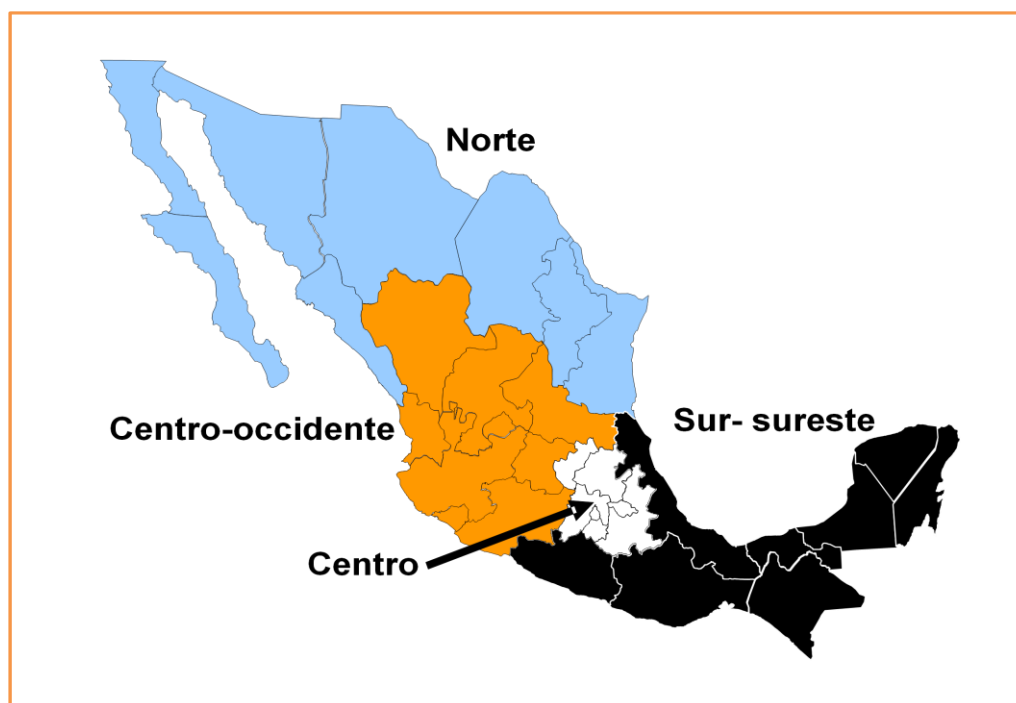
Mapa 1. Regiones migratorias en México (Zúñiga, Leite y Acevedo, 2005:235).

Con la introducción del ferrocarril en México, a finales del siglo XIX, se conectó al país con las líneas ferroviarias existentes en EUA, lo cual permitió que los habitantes del centro-occidente del país se convirtieran en los primeros con la oportunidad de entrar en el mercado laboral estadounidense, constituyéndose así la región de “intensa tradición migratoria” (o centro-occidente; que posteriormente tendría tres regiones migratorias vecinas: norte, centro y sur-sureste; ver mapa 1). En esas fechas, en EUA se creaba una Ley de Exclusión China , lo que dejó espacios de trabajo libres (Durand y Arias, 2000:24,34). Posteriormente, la escasez de mano de obra en el país vecino, como consecuencia de la Primera Guerra Mundial y posteriormente la Revolución Mexicana , aceleraron la emigración de connacionales (Durand y Arias, 2000:35-36).