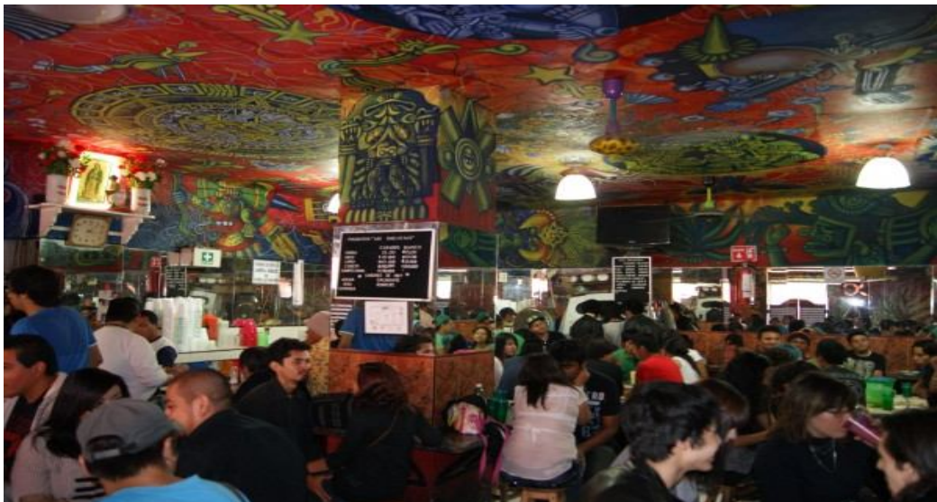
Día común en las Duelistas, foto de Peter Saltamontes.

Actualmente “Las Duelistas” está abierta, después de breves acuerdos con las autoridades pertinentes, se encuentra en el mismo lugar y a cargo del mismo dueño, cuenta con clientes adultos por las mañanas y jóvenes por las tardes, aunque se ha visto un incremento en los clientes de corta edad, de vez en vez pueden verse a ambos conviviendo. Intercambiando significados, apropiándose de esta expresión llamada pulque, pues la producción y recepción de las formas simbólicas son procesos, que ocurren en contextos estructurados como lo es la pulquería, estos contextos en ocasiones coinciden con el contexto de recepción, pero también pueden superponerse.