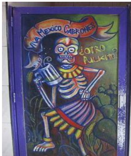
Pulquería las Duelistas interior.