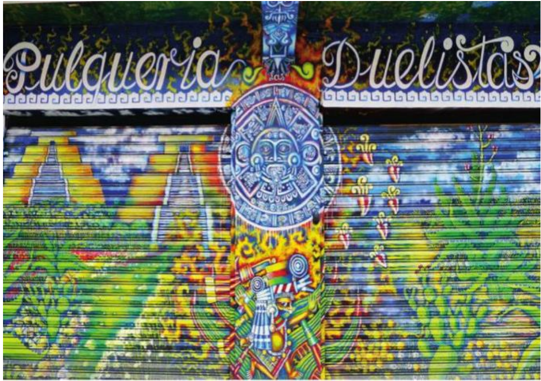
Fachada pulquería las Duelistas.