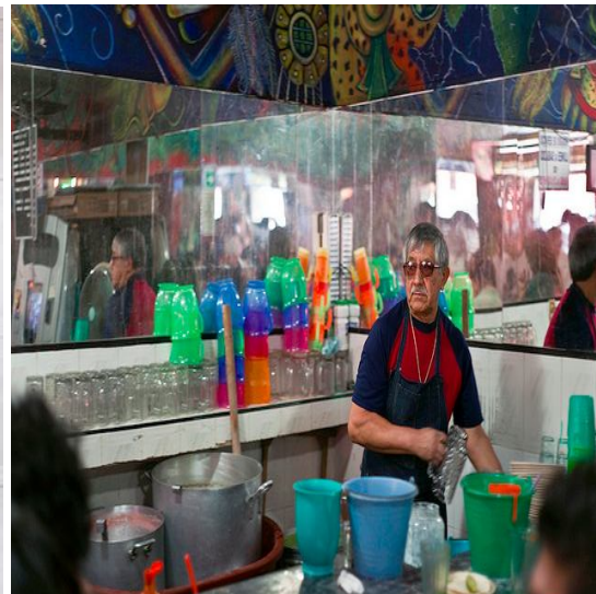
Pulquería las Duelistas interior "Don Miguel"