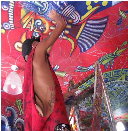
"Chube" graffitero.