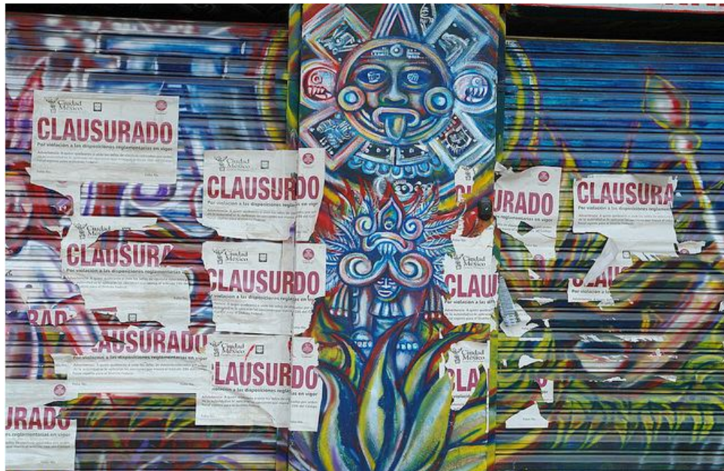
Fachada pulquería las Duelistas.