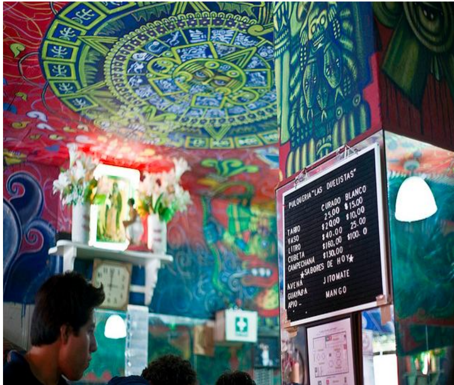
Pulquería las Duelistas interior, foto de Gabriel Bravo.