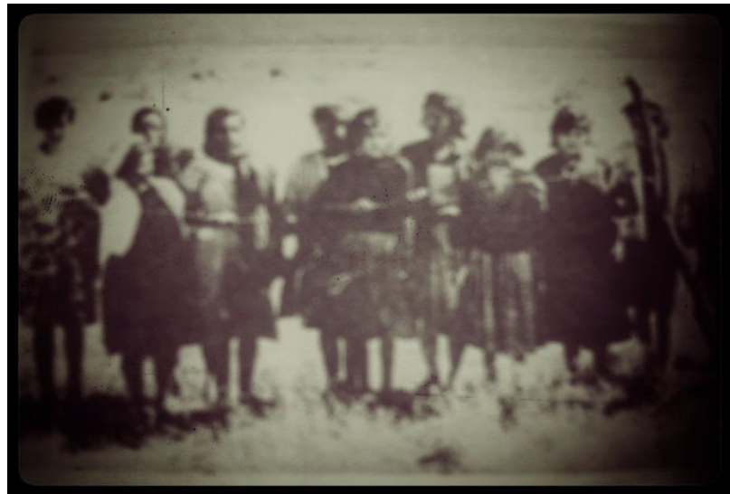
Mujeres encontradas en la finca de San Ángel. A quienes nombraron víctimas.