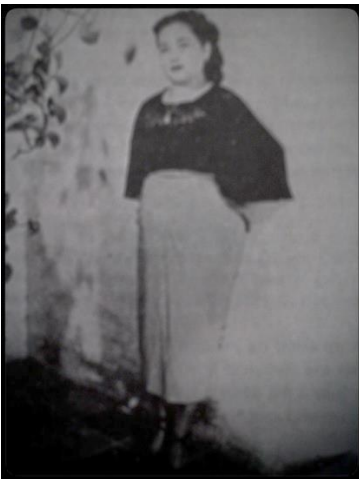
María de Jesús González Valenzuela

Fotos del libro. Yo Poquianchis! Por Dios que así fue.