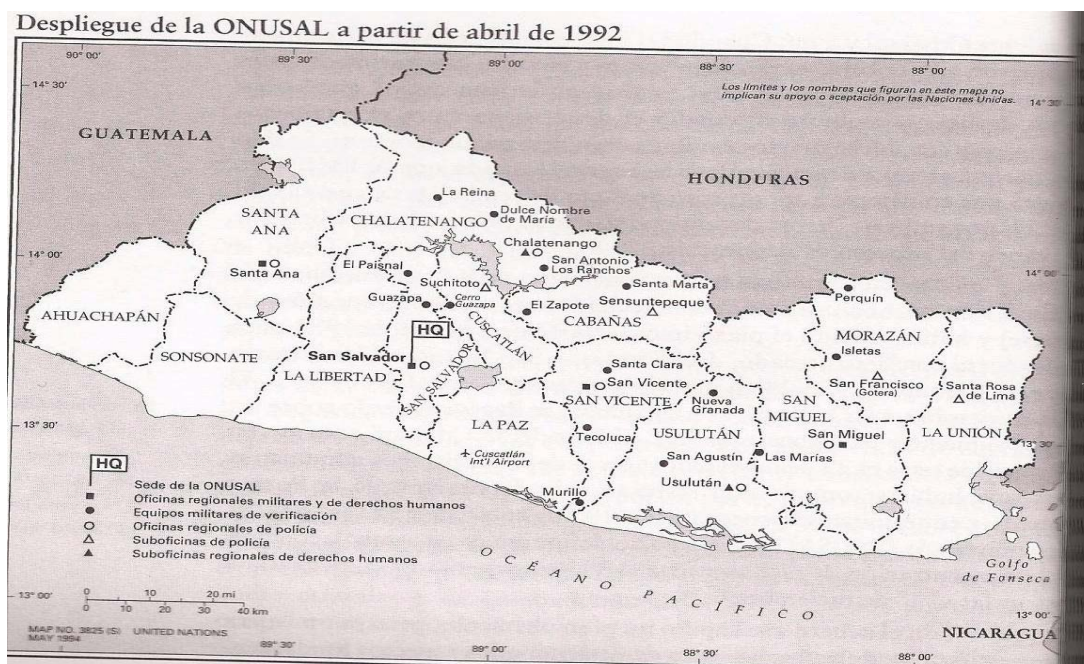
Mapa 3: Despliegue de la ONUSAL a partir de abril de 1992