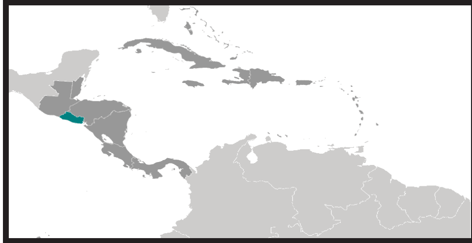
Mapa 2: El Salvador en Centroamérica