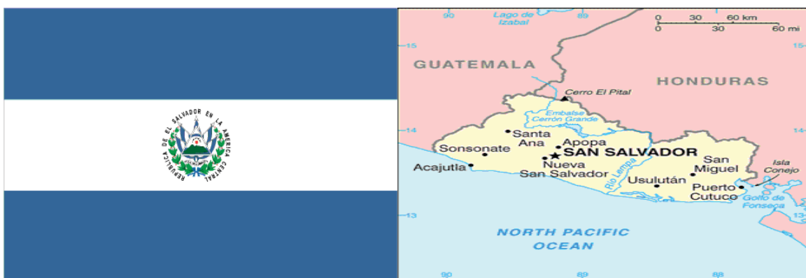
Figura 2: Bandera y Mapa de El Salvador