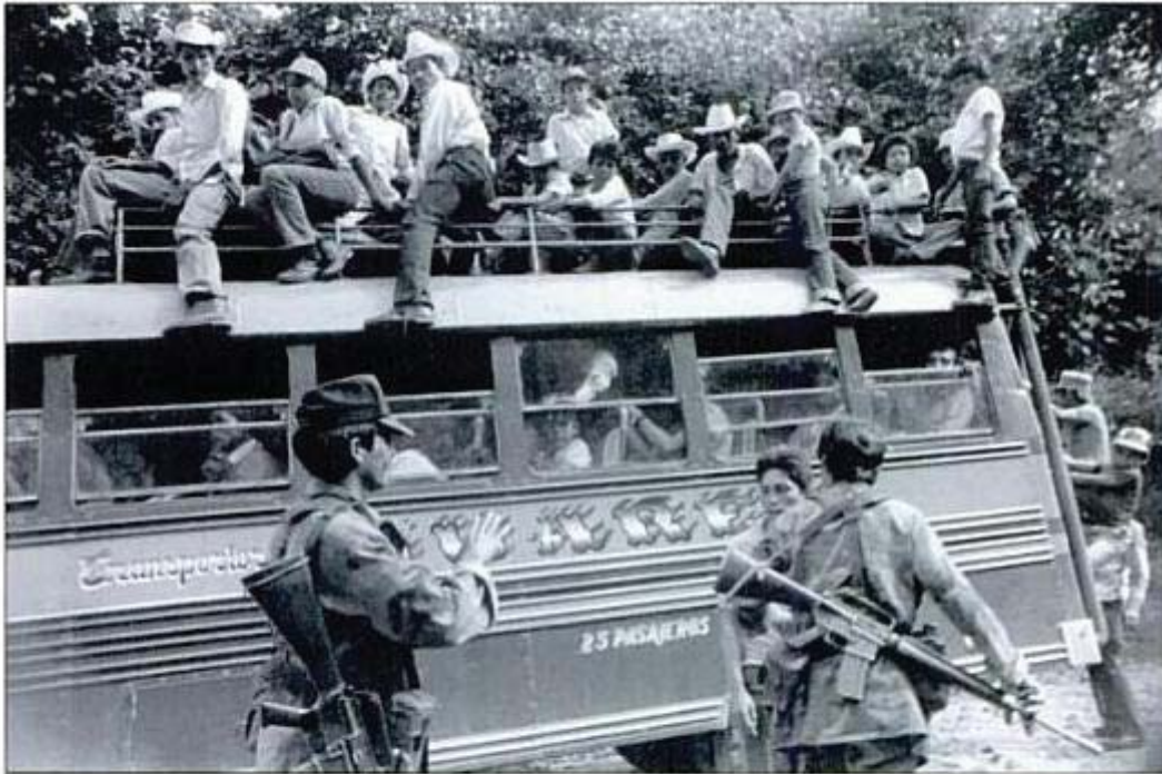
Figura 3: Reclutamiento del ejército salvadoreño