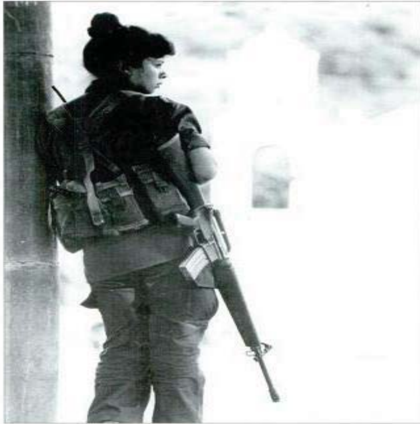
El Salvador, 1991 Michael Stravato — AP PHOTO Una joven guerrillera del FNLFM monta guardia junto a la iglesia acribillada de El Rosario, 160km al noreste de San Salvador, en la zona conflictiva de Morazán.

Fuente: IleneCohn y GuyGoodwin-Gill, en Los niños Soldado, un estudio para el Instituto Henry Dunant, Ginebra, pág. 193.