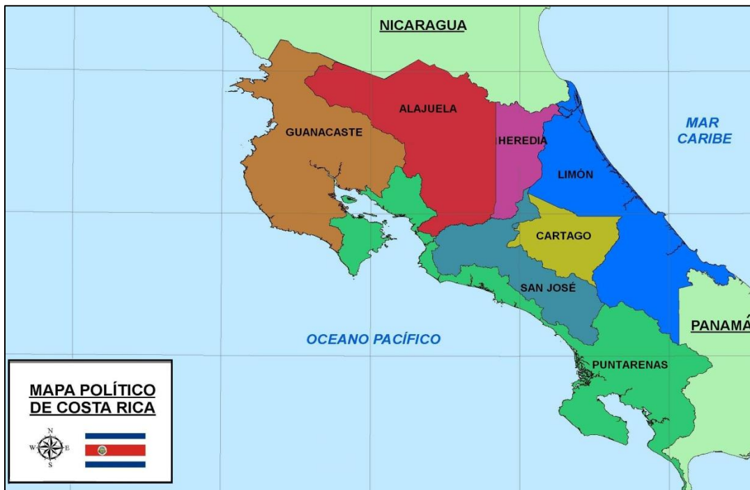
Mapa geográfico de Costa Rica