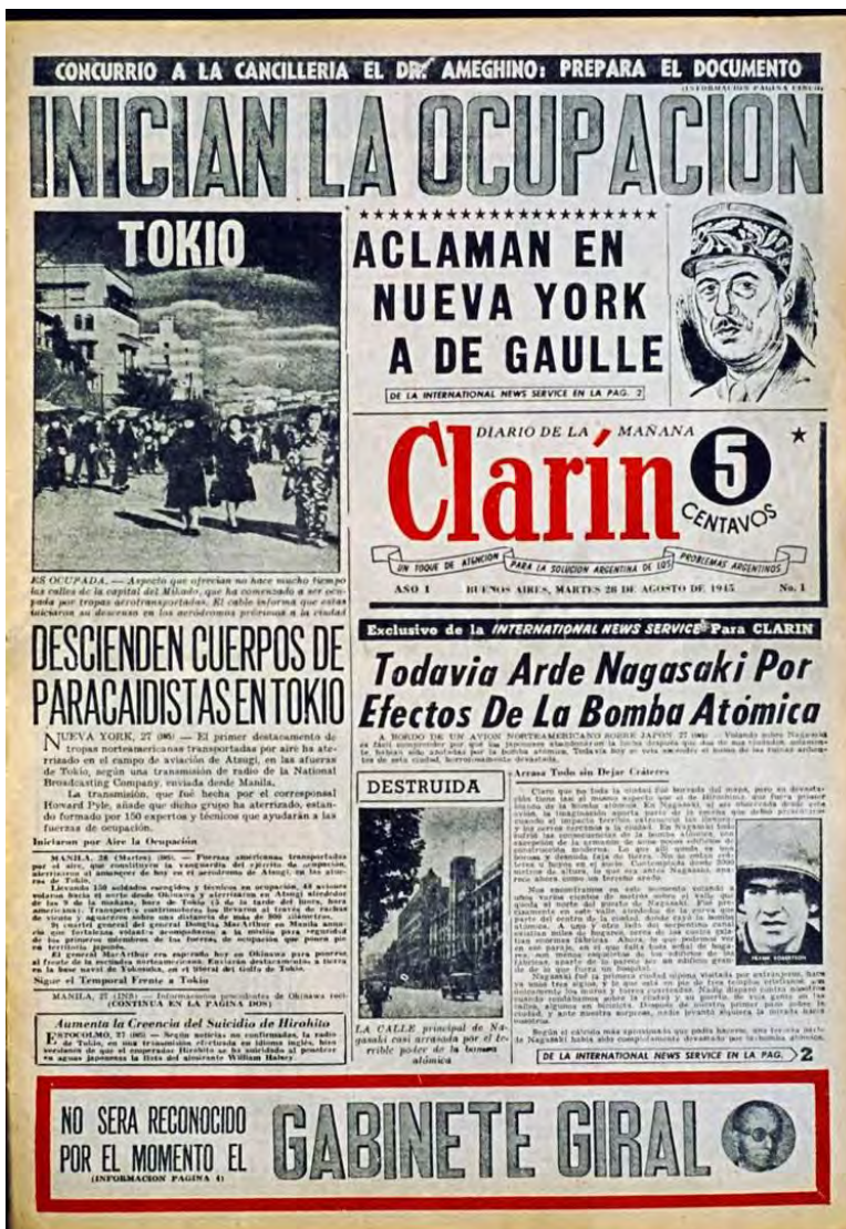
Primera Plana de Clarín 22 de agosto de 1945.

Clarín fue beneficiado por la clausura realizada por el gobierno peronista del diario “La prensa”, ya que los avisos publicitarios en gran parte se volcaron para el [...] y cuando sucedió la clausura en 1951, el diario dejó de ser adversario del peronismo. Su crecimiento hizo que ya en 1958 llegase a ser el diario más vendido en la Capital Federal (Corvaglia, 2009:45).