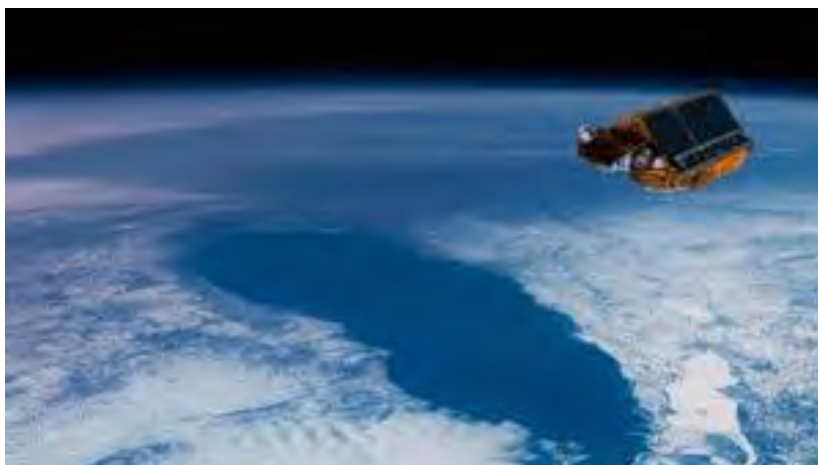
Foto 3. Lecho marino en el Ártico durante el verano del 2007

http://www.abc.es (Fecha de Consulta 19/07/2013)