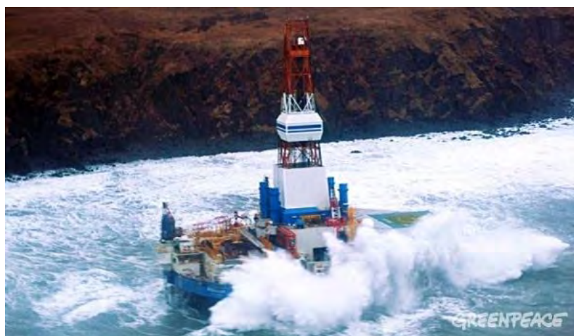
Foto 6. Plataforma de Shell encallada cerca de Kodiak Alaska

Fuente: http://www.greenpeace.org (Fecha de consulta 25/08/2013)