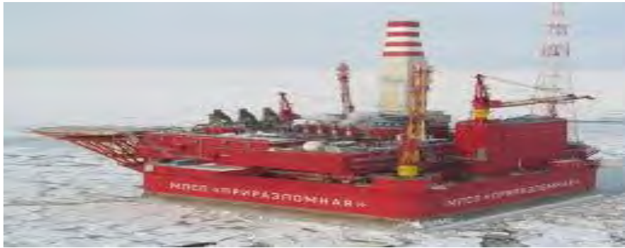
Foto 7. Plataforma rusa Prirazlomnaya en el Ártico

Fuente: http://www.gazprom.com (Fecha de consulta 25/08/2013)