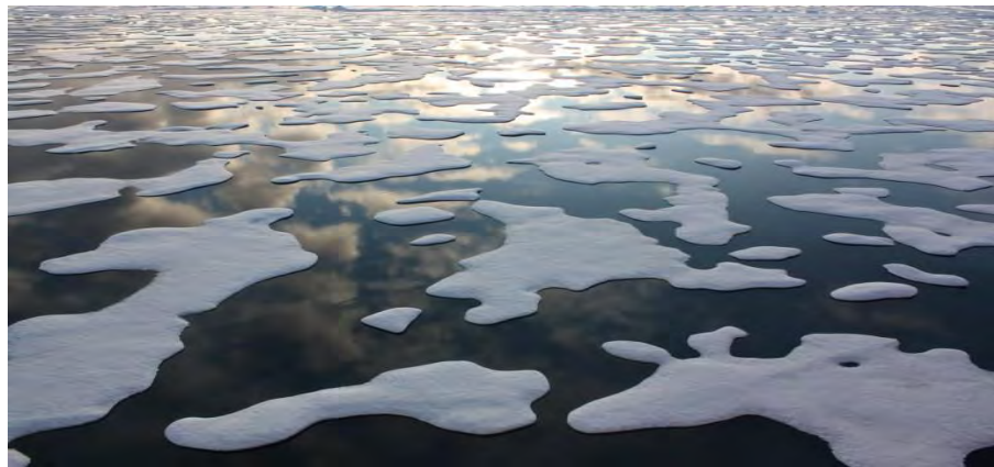
Foto 9. Capa glaciara ártica durante el 2012

Fuente: http://noticias.terra.com (Fecha de Consulta 06/10/2013)