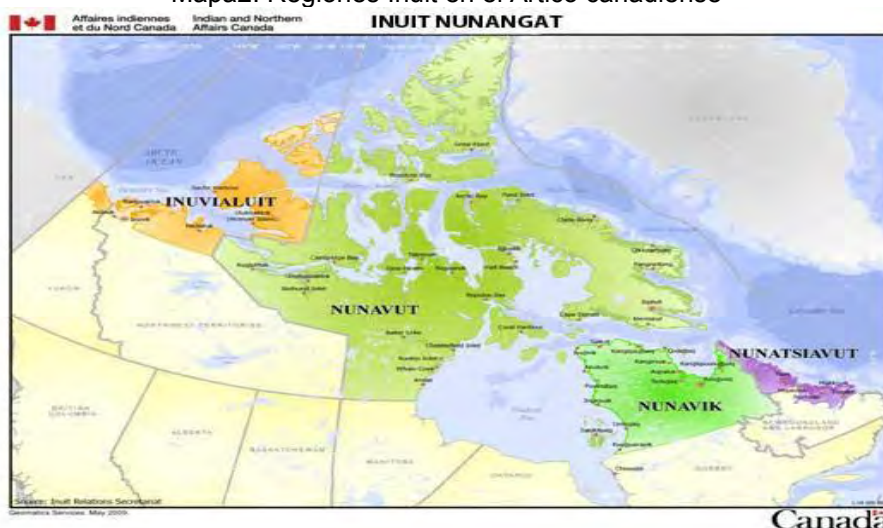
Mapa2. Regiones Inuit en el Ártico canadiense