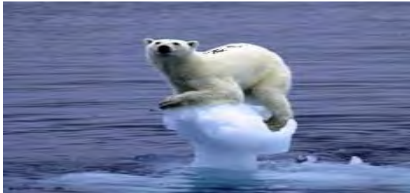
Foto 5. Oso polar en un trozo de hielo