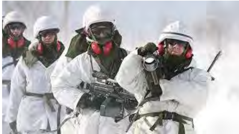
Foto 4. Soldados canadienses en la base militar de el Ártico

Fuente: http://www.octavodia.mx (Fecha de Consulta 25/08/2013)