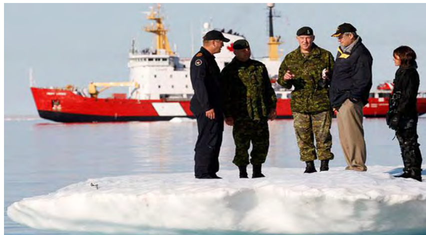
Foto 2. Presencia de Stephen Harper en el Ártico

Fuente: http://diarioelpopular.com (Fecha de Consulta 18/07/2013)