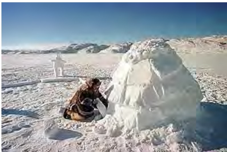
Foto 8. Inuit terminando la entrada de su esquimal

Fuente: http://www.elmundo.es Fecha de consulta 27/08/2013)