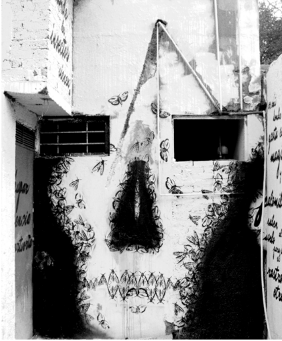
Maquetación adaptada a la arquitectura

la viñeta al formato del espacio por caprichoso que sea, sobre la arquitectura. Es en este momento que nos tenemos que salir de la estructura clásica de hacer narración con viñetas, pues los recuadros y márgenes del cómic harían rígida la fluidez dentro del espacio tangible y no se podría integrar al lugar. Es aquí cuando el arte urbano libera al romper el formato cuadrado de los medios impresos o de las pantallas, llevándolo al espacio vital del hombre, donde nunca se repetirá la forma de construir la viñeta, ningún lugar en el mundo es igual a otro. Se ocupa cualquier tipo de técnica para lograr que la narración sea fluida y la imagen interviene el espacio adhiriéndose al él. A este proceso se le llama Maquetación .