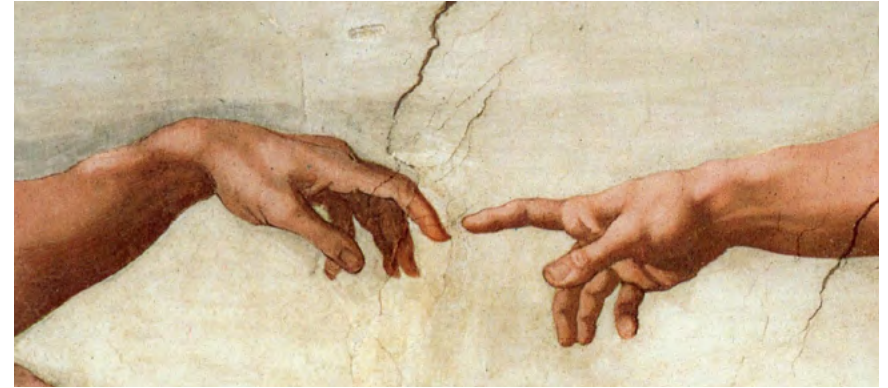
Lo divino en el humano, motor que origina la voluntad, el movimiento contenido.

También podemos encontrar ejemplos de murales narrativos en las iglesias para adoctrinar a las diversas culturas, ejemplos básicos de la charlatanería y la fe, que funcionaban de maravilla debido a su eficaz sistema gráfico para contar historias bíblicas, “orientando la verdad” en cualquier tipo de cultura en vías de evangelización, esto es la ilusión que generaba la religión cristiana con los murales y las enseñanzas de sus templos. No todos los intentos en el muro de esta religión son corruptos pues tenemos el trabajo del supercampeón internacional, sin límite de tiempo, de dos a tres caídas y del bando de los técnicos a Michelangelo Buonarrot , que para hacer la Capilla Sixtina y otras obras se recluyó por un largísimo tiempo con el único objetivo de entender a Dios, a tal nivel llegó este enclaustramiento que logró reunir la confianza necesaria para decirle a Julio II, el impulsador del renacimiento que era corrupto ¡El Papa era un reverendo ignorante sobre lo que significaba Dios, que sorpresa! O según el libro del Juicio Universal de Giovanni Papini, Michelangelo protestó: