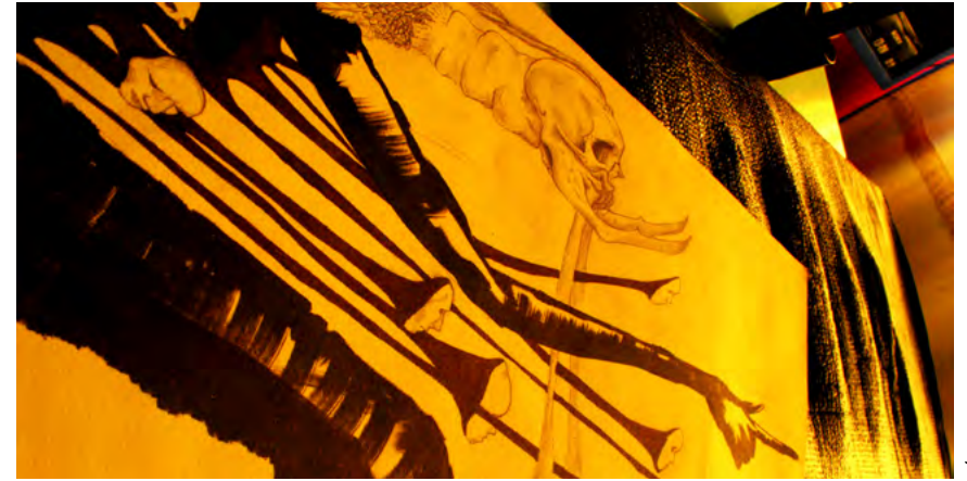
Boceto del cuento mural.

<Al sentarnos ante un escritorio junto a la ventana de una habitación, la vista lejana, la luz que procede de la ventana, el material del suelo, la madera del escritorio y la goma de borrar en una mano empiezan a fusionarse desde un punto de vista perceptivo. Este solapamiento entre