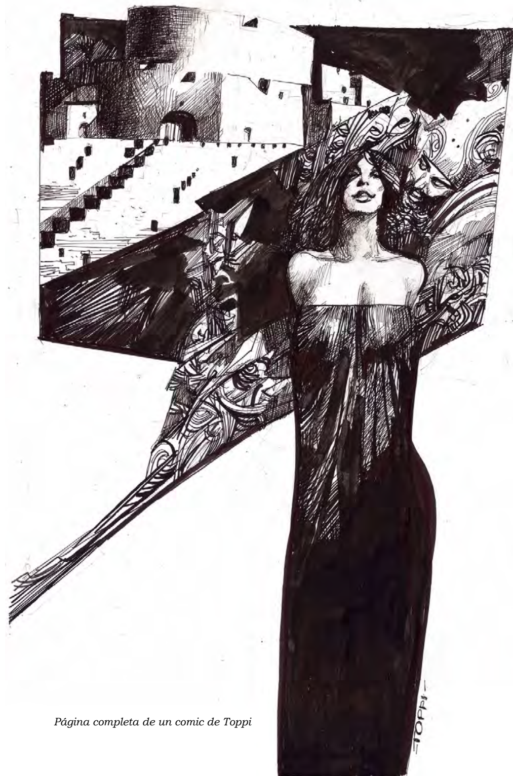
Página completa de un comic de Toppi

<Nuestra percepción se desarrolla a partir de una serie de perspectivas urbanas superpuestas que se despliegan según el ángulo y la velocidad del movimiento. Aunque podríamos analizar nuestro movimiento a lo largo de un trayecto determinado a una velocidad determinada, nunca llegaríamos a enumerar todas las vistas posibles. Los trayectos par-