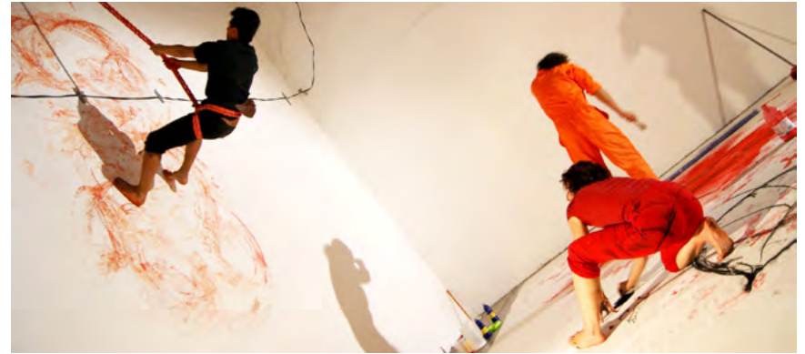
Interdisciplina de un mural en el CNA con danza.

A pesar de su interdisciplina, el lenguaje principal del cuento mural es el mismo del cómic, trabajar la secuencia a través de viñetas, Aunque también tiene la posibilidad de expandir su lenguaje a cualquier