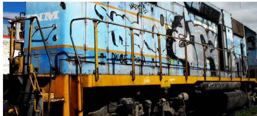
Graffiti en trenes.

Posteriormente en Estados Unidos, las paredes en las calles siguieron hablando y no descansaron, también los trenes, pues surgió un movimiento que empezaba a caracterizar enormemente las grandes urbes, a diferencia del arte urbano de fuentes y esculturas alegóricas en las avenidas que ya no tenía el menor significado para nadie, además de que solo representaba parte de la burocracia del estado, este movimiento de identidades se llama graffiti. Una pelea interminable de estilos y territorios, donde el capitalismo permeo en la percepción humana, inició una guerra de logotipos y marcas en el espacio vital de las megalópolis, la terrible lógica que usaron las corporaciones fue que entre más invadiera la identidad, más permanecerá en la mente de las personas, incluso inconscientemente, está lógica llegó a todos los sectores, hasta abajo, en los ghettos como en las empresas más grandes, sólo que en vez de logotipos se le llamaron “tags” o firmas, en todas las clases sociales, era una lucha de identidades, un abastecimiento al ego, pero a diferencia de las grandes empresas, la práctica del graffiti era completamente ilegal y por lo tanto desafiante a las autoridades judiciales y sociales, logrando generar grandes haza-