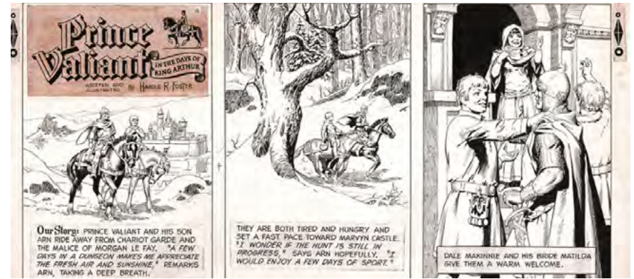
Secuencialidad de Harold Foster

<Por lo general, la escritura se percibe como la manipulación de palabras, escribir en una historieta o cuento mural es faena más compleja, pues se trata en principio de desarrollar un concepto, de describirlo y de construir la cadena narrativa que llevará de las palabras a las imágenes. El diálogo sostiene el dibujo, pues tanto uno como otro están al