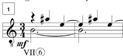
Figura 4.1: I. Campanas

En I. Campanas el motivo antes mencionado se intercala con materiales formados