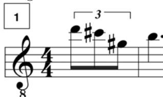
Figura 4.4: V. Sueños

La pieza IX. Vorágine (al igual que II. Canto ) no forma parte de ciclo ninguno, por lo que su función consiste en contrastar con los materiales que la rodean. Su forma es A - B - C - A', y está construida a partir de grupos de tres notas, en los cuales la mayoría de las veces hay una ligadura entre dos sonidos.