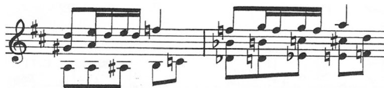
Figura 2.2: Escala cromática en bajo ( Andantino affettuoso ).

compás, precedido por una cadencia que extiende su tamaño al tener intercalados silencios (figura 2.3).