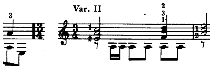
Figura 1.3: Final de Var. I , e inicio de Var. II .

La segunda variación contrasta con el material presentado previamente por la sensación de fuerza que le da el uso de figuras de dieciseisavo en los contratiempos.