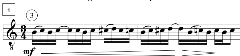
Figura 4.2: IV. Soplo

Las partes llamadas Sueños sólo comparten su carácter de ensoñación, pues sus partes no tienen materiales en común. La pieza V. Sueños tiene forma A - B, y está construida a partir de la sucesión de notas Re - Do sostenido - Sol sostenido - Si (figura 4.4). En VII. Sueños aparece material nuevo de principio a fin, aunque