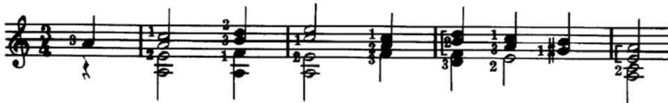
Figura 1.2: Inicio de Tema .

La primera parte de la obra funciona como presentación del tema (que aparece en la voz superior) y consta de cuatro frases de cuatro compases cada una. Las primeras dos frases representan un diálogo «pregunta - respuesta», pues en ambas se expone el tema, pero este es armonizado en diferente forma cada vez, la tercera frase funciona como una especie de pequeño desarrollo y en la cuarta frase vuelve a aparecer el tema como una reiteración del material que será tratado.