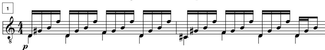
Figura 4.3: VIII. Soplo

este está supeditado a un modelo de arpeggio dentro del cual se diferencian dos voces.