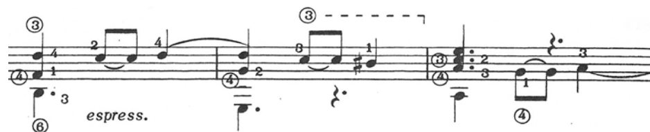
Figura 2.4: Agrupación binaria en desarrollo ( Allegretto un poco vivace ).

(por pares), funciona como si se tuviera un compás de 3/4 (subdivisión binaria), este caso se repite entre los compases 118 y 128. También dentro del desarrollo se cita el tema principal del primer movimiento de la Sonata , lo que ayuda a integrar toda la obra dándole lógica y claridad. Entre los compases 121 y 128 aparece una sucesión de acordes que se intercalan con un pedal en el bajo, hacia el final dicha sucesión, el movimiento de los acordes se vuelve cromático en una trayectoria descendente, lo que una vez más, hace evidente el buen manejo armónico del compositor.