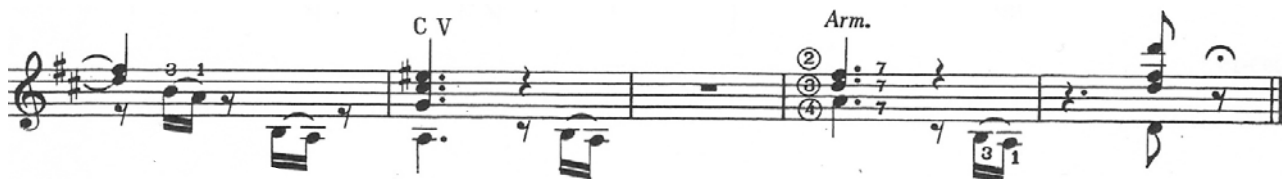
Tabla 2.3: Allegretto in tempo di serenata