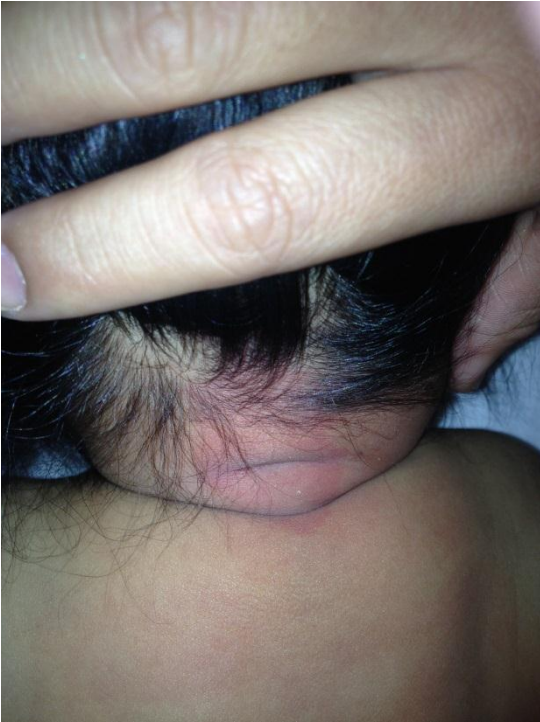
Fotografía 1. Donde se puede observar mancha color salmón compatible con angioma cervical alto.