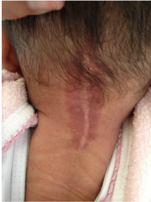
Fotografía 3. Donde se observa seno dérmico resuelto.