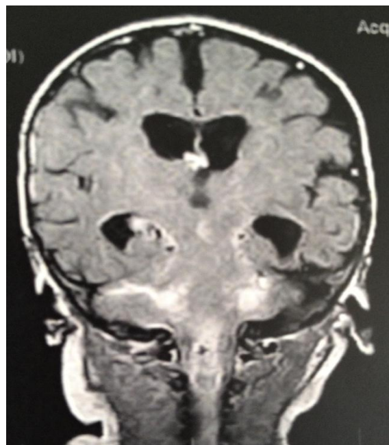
Imagen 1 y 2. Resonancia magnética de encéfalo con gadolinio en corte sagital y coronal con simetría de hemisferios cerebrales, ensanchamiento de espacio subaracnoideo compatible con ligera atrofia cortico-subcortical, ventriculomegalia sin datos de migración transependimaria, captación de medio de contraste periventricular en cisterna cuadrigeminal, cuarto ventrículo, porción posterior de bulbo, unión bulbo cervical y los 3 primeros niveles cervicales. Estudio de resonancia magnética compatible con seno dérmico cervical, absceso, ventriculitis secundaria y médula anclada del mismo nivel.