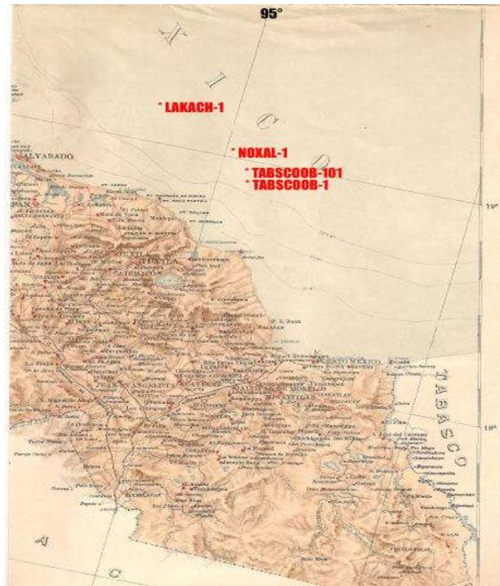
Mapa 4. Ubicación marítima de pozo de Lakach en la cuenca de Catemaco

Por su parte el campo gasero de Lakach fue descubierto en el mes de diciembre de 2006 en la llamada cuenca de Catemaco. Según información obtenida por Nydia Egremy, Lakach en conjunto con Colomo, un campo gasero situado en Macuspana Tabasco son los “ más grandes descubrimientos de gas en la historia de Petróleos Mexicanos ”. 331 También es preciso tener en cuenta que se descubrió el yacimiento llamado Tsimin en el litoral de Tabasco dentro de la región Marina Suroeste. 332 Las reservas que posee Tsimin son estimadas en 305 millones de barriles de petróleo.