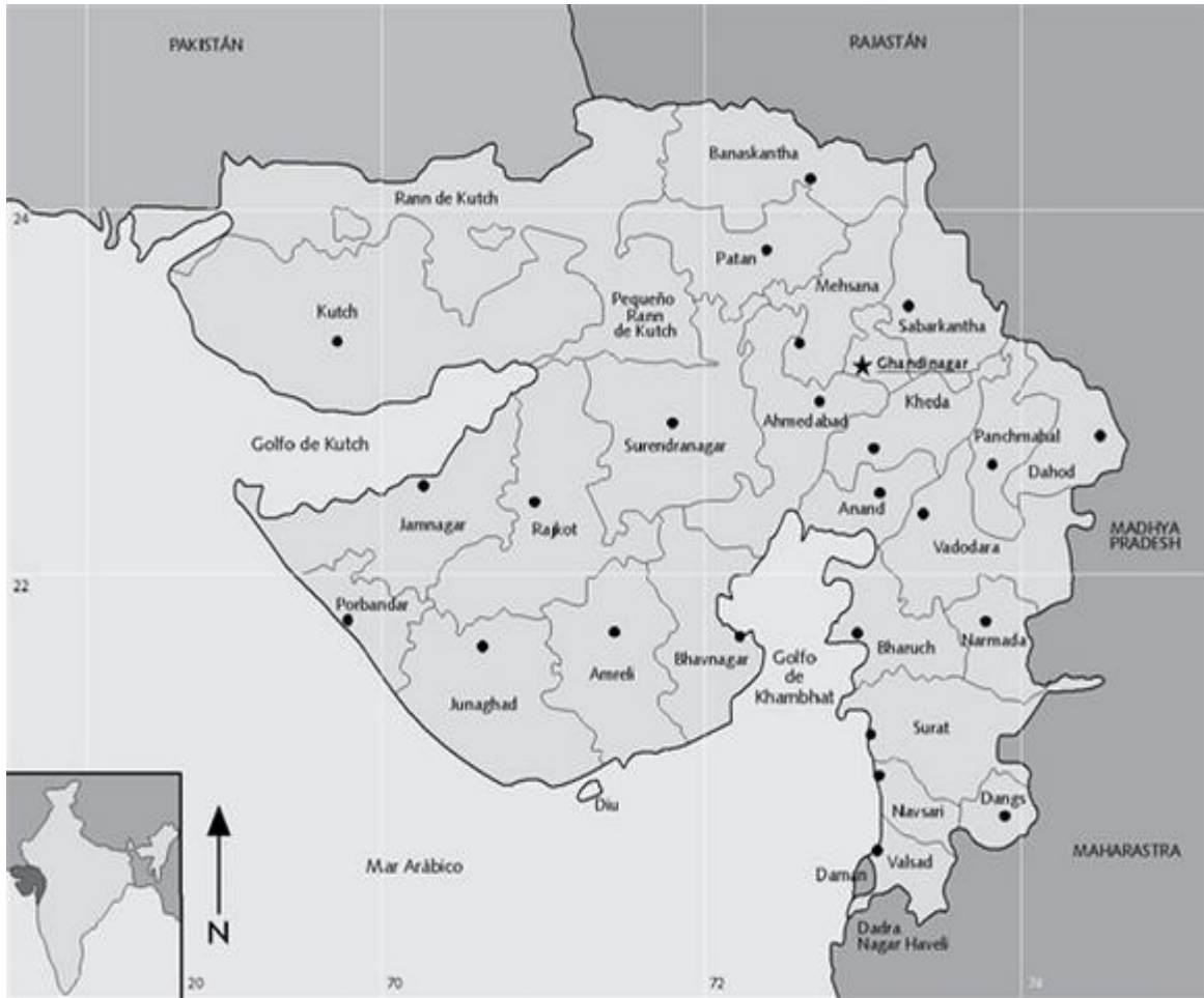
Mapa 2. Gujarat, la India

Fuente: Beatriz Martínez Saavedra, op. cit. , p. 144.