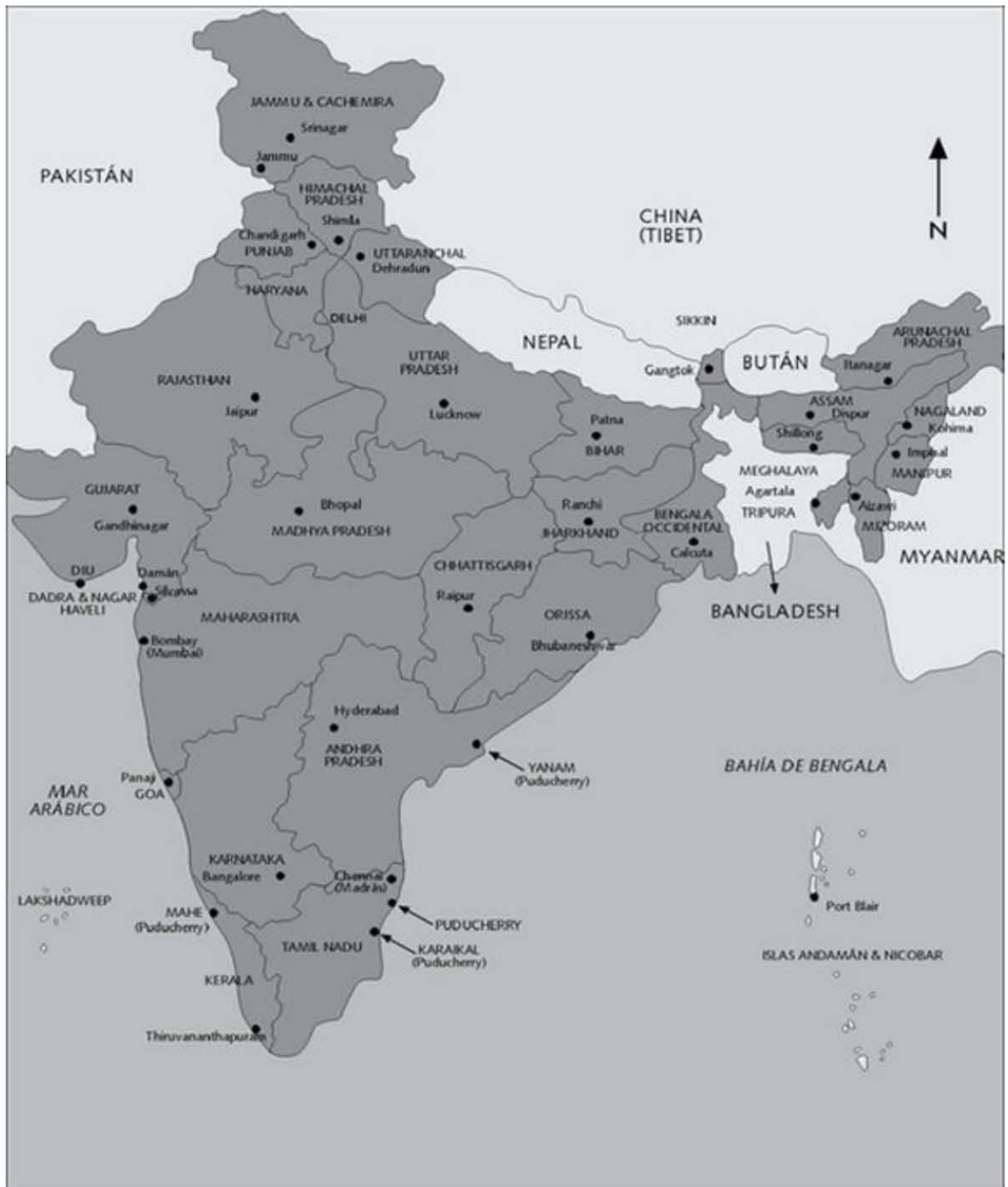
Mapa 1. La India