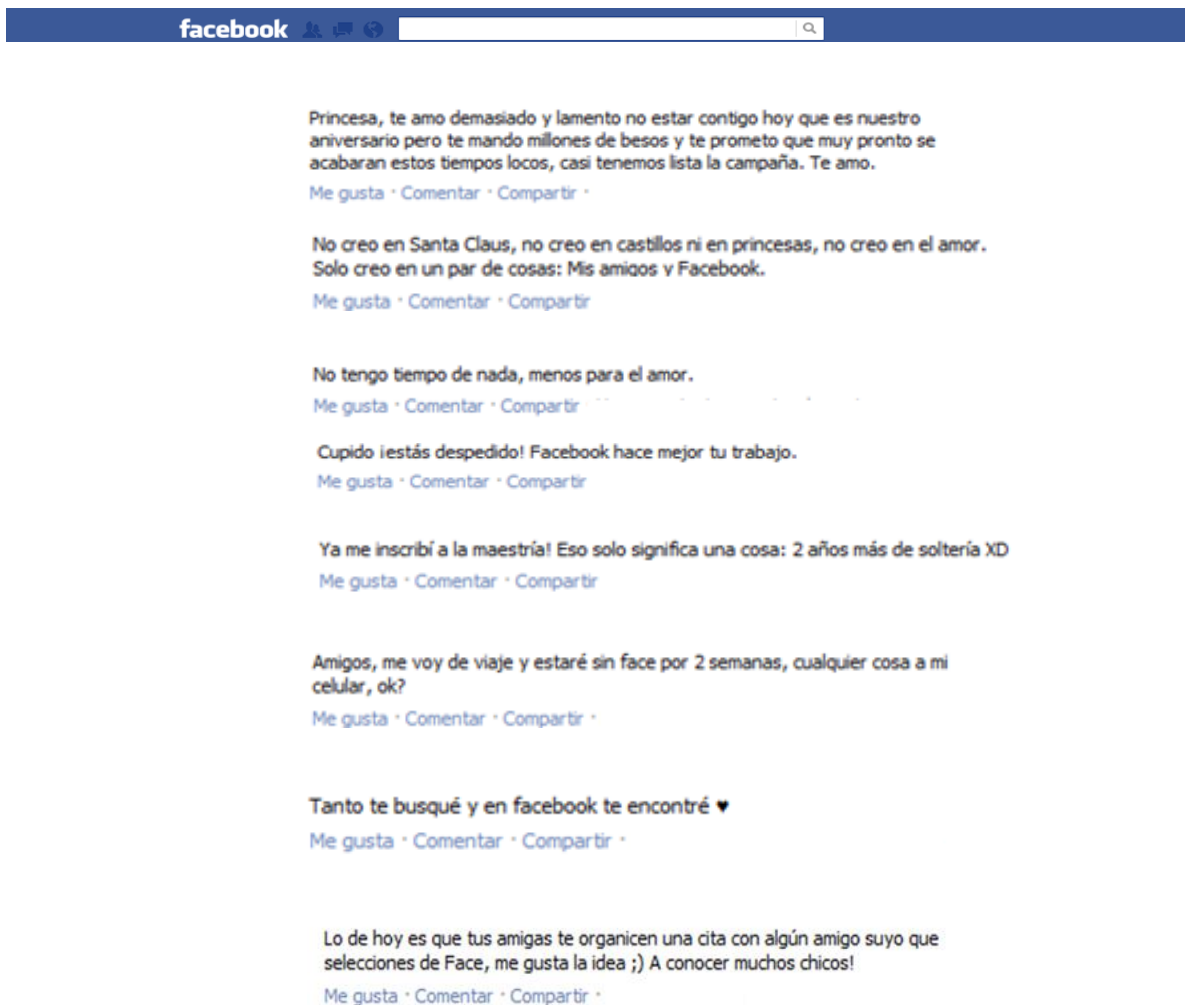
Imagen 4: Publicaciones reales.

A continuación, algunas publicaciones que expresan algunas ideas sobre el rol de Facebook y la dinámica amorosa.