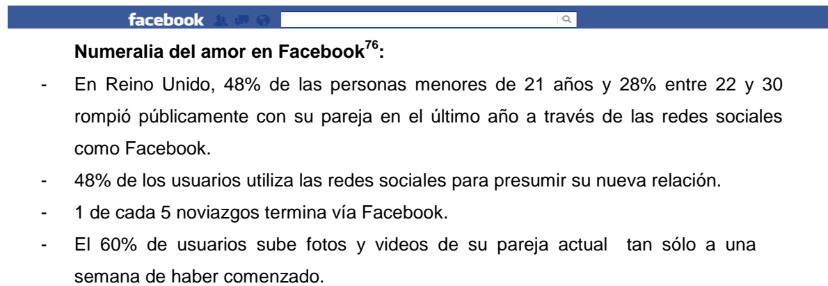
Imagen 3: Numeralia del amor en Facebook.

Por otra parte, con la característica de “etiquetas” para las fotos, con las cuales se puede señalar a los amigos que aparecen en ellas, también se ha facilitado el coqueteo virtual, ya que, es posible que un usuario vea las fotos de sus amigos y se interese por alguna persona que aparezca en ellas, así es posible generar un vínculo por medio del “amigo en común” (tal como sucede en la vida real). Cuando dos personas son etiquetadas juntas en repetidas ocasiones, comienzan las especulaciones de una relación sentimental.