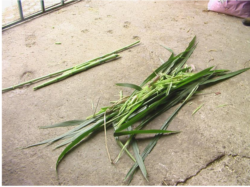
Imagen 4. Corte de la planta Maralfalfa.

Para obtener el rendimiento de Materia Seca (MS) se cortó todo el forraje de los 72 m 2 y se peso, el resultado se extrapolo a una hectárea.