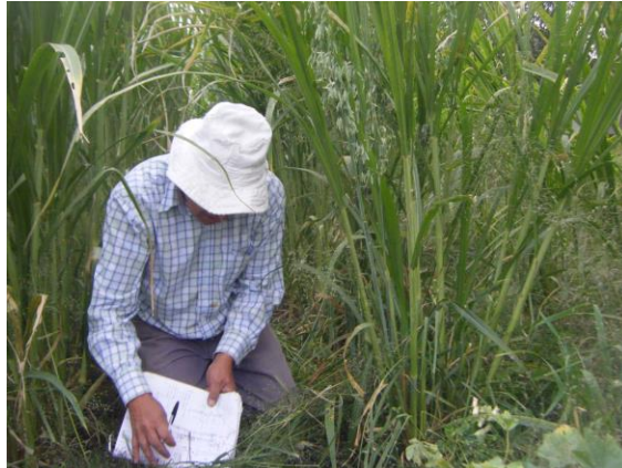
Imagen 3. Medición de características físicas de la planta Maralfalfa.

manualmente los tallos de las hojas. Para el pesaje se usó una báscula de reloj con capacidad de 5 kg.