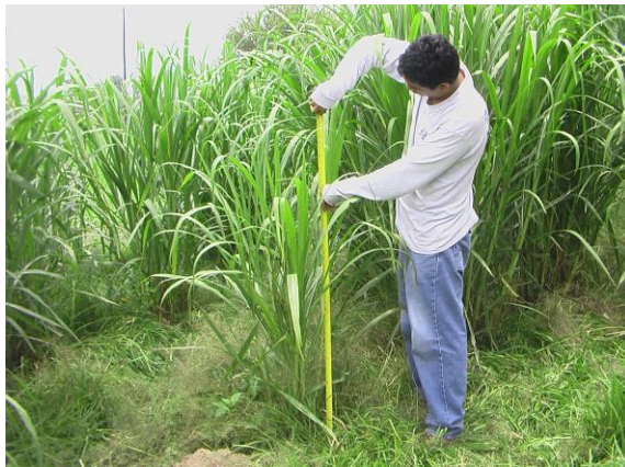
Imagen 2. Medición de algunas características físicas de la planta Maralfalfa.

El ancho de las hojas se midió a la altura de la lígula y el largo desde la base de la vaina hasta la punta del limbo (22).