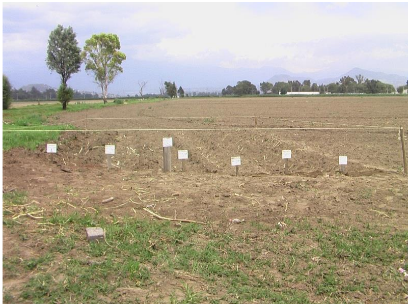
Imagen 1. Parcela de maralfalfa recién sembrada.

con hojas. Para el grosor se usó un vernier y una cinta métrica para las otras mediciones.