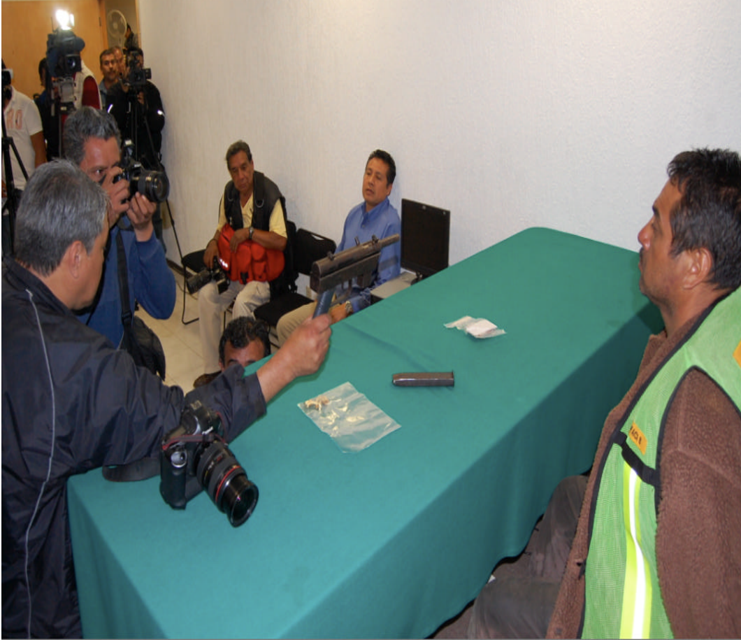
Presentación ante los medios de comunicación de un probable responsable en la comisión de delitos