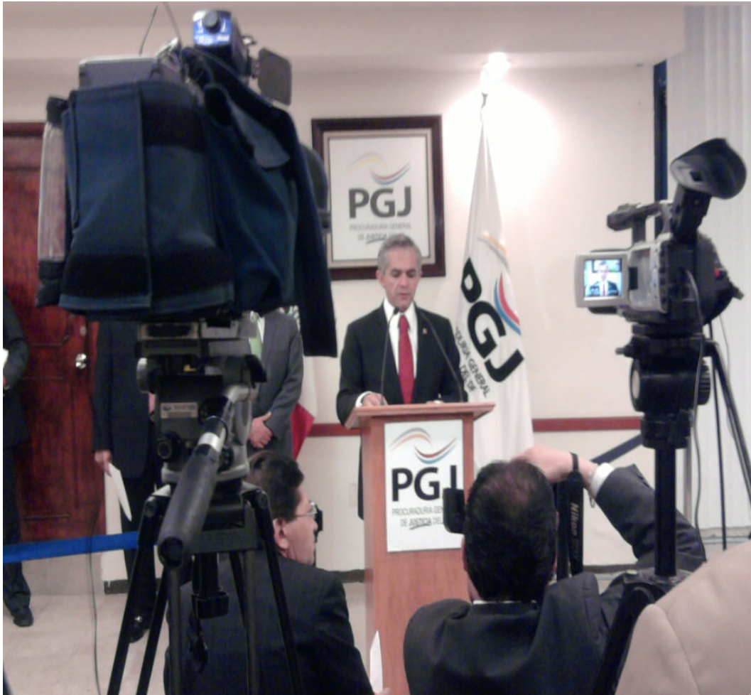
Conferencia de prensa ofrecida por el doctor Miguel Ángel Mancera Espinosa, Procurador General de Justicia del Distrito Federal.

Previo a la entrevista, quien redacta este documento o cualquiera de los otros líderes coordinadores que acompañábamos al Procurador lo poníamos al tanto sobre los temas que querían abordar los reporteros, lo anterior, con el propósito de que se allegara de la información más reciente para contestar con mayor precisión los cuestionamientos de interés social.