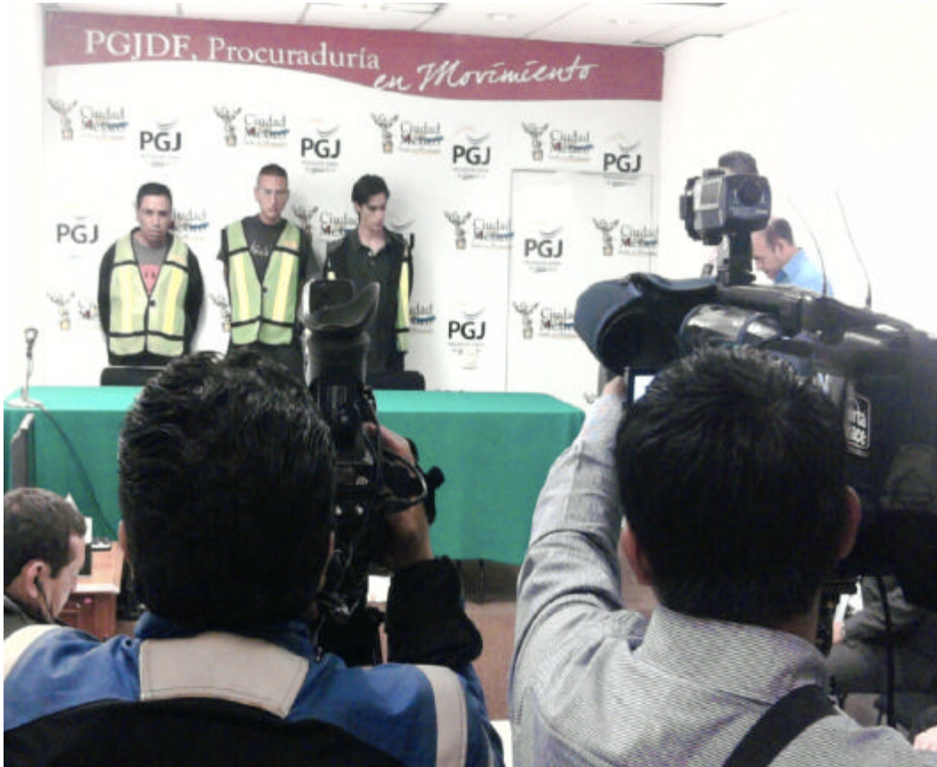
Presentación ante los medios de comunicación de probables responsables en la comisión de delitos

Así trabajábamos; los reporteros internos seguían siendo supervisados y guiados por los líderes coordinadores, entre ellos quien documenta este escrito, y de igual forma la información fluía, pero era necesario la incorporación del nuevo Director General y su equipo de trabajo para que delineara la nueva estrategia informativa para aplicarse al interior de la Unidad de Comunicación Social.