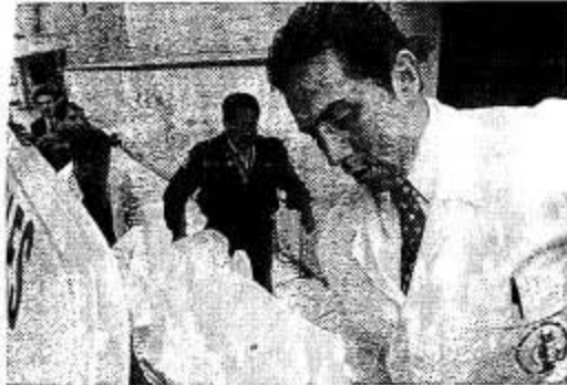
Tras el homicidio de una mujer de 82 años, en la Delegación Venustiano Carranza, fue detenida una mujer identificada como la asesina serial de ancianas.