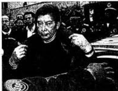
Algunos hechos de los delitos de homicidio a presencia de un sujeto que podría ser la misma persona que se mató en el caso de la 'mataviejitas'.

El homicidio se dio a presencia de un sujeto que podría ser la misma persona que se mató en el caso de la 'mataviejitas'.