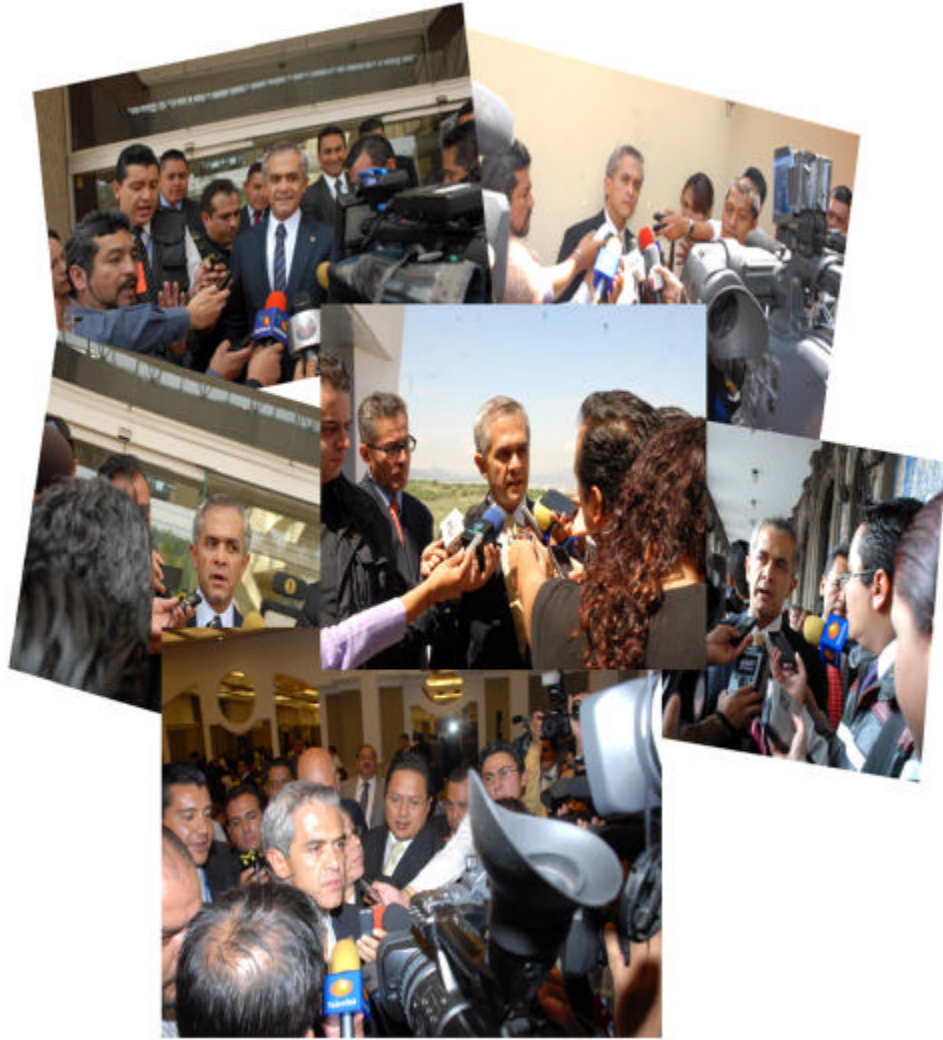
Entrevistas, conocidas como chacaleos , al Doctor Miguel Ángel Mancera Espinosa, Procurador General de Justicia del Distrito Federal.

Terminada la cobertura informativa, se organizaba el regreso a la oficina de la Unidad de Comunicación Social para hacer del conocimiento de los hechos al jefe inmediato, en este caso el Subdirector de Información, quien a su vez hacía lo propio con el Director General para recibir instrucciones para el procesamiento de la información.