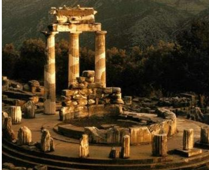
Figura 1. Oráculo de Delfos: utilizado en la Antigua Grecia como recinto.

El conocimiento se ha ido transformando a lo largo de la historia, en cada uno de los diferentes escenarios ha aparecido justificando la existencia del hombre, quien se ha dedicado a interpretar el mundo de distintas formas. Conforme el tiempo ha visto avanzar al hombre, éste último ha construido ciertas representaciones de aquello que lo rodea, encontrando aspectos imprescindibles que lo hacen ser y actuar de forma distinta a los demás organismos. Una de estas cualidades, es el lenguaje, el cual parece ser una capacidad que le permite al hombre predominar ante las demás especies.