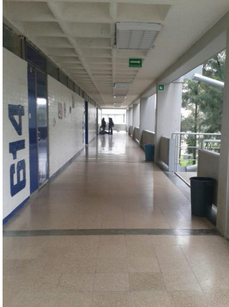
Pasillo que conduce a los espacios áulicos

El hombre es un ser vivo que se expresa de diferentes formas cuyas capacidades no están limitadas ni determinadas. Siendo el hombre una de las posibilidades que tiene el universo de manifestarse se debe entender que éste es energía que se transforma, que se expande y que en algún momento deja de formar parte. El tiempo le permite permanecer pero jamás quedarse estático, por ello la participación que tiene en cada una de las etapas de vida es importante para perpetuar su especie aún después de su muerte. Su trascendencia se sujeta a las posibilidades de creación que tiene éste a lo largo de su historia. Es por eso que el hombre es capaz de elegir su constitución. Se construye a través del orden de lo permitido, pero es él quien elige su camino, su destino, sus metas y objetivos. No obstante, es libre en un marco establecido por la sociedad, el Estado, las leyes, la política, la escuela y todas aquellas Instituciones en donde se gestan relaciones de poder.