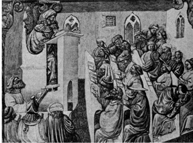
Figura 2. La Universidad de Bolonia.

Repensar la riqueza cultural que tuvieron otras civilizaciones permite reconstruir el ideal pedagógico que dentro de las Universidades podría considerarse viable, cuya orientación se inclina en la formación de jóvenes capaces de disfrutar la experiencia estética y ética que posee el acto de investigar. El recorrido histórico no subraya únicamente los aspectos que se consideran aplicables en el proceso enseñanza-aprendizaje ni representa una crítica hacia el modelo educativo que se practicaba en las culturas orientales.