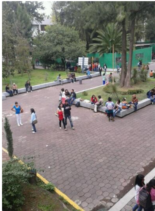
Facultad de Estudios Superiores Aragón. Foto tomada desde el edificio A.

Los ecosistemas son considerados una comunidad ubicada en un lugar físico , el hábitat , en el que interactúan diferentes seres vivos (elementos bióticos) y los inertes (elementos abióticos) . Las relaciones entre las especies y su medio, son tan importantes como las condiciones específicas del lugar, como por ejemplo: la temperatura, el clima, el suelo, etcétera. La dinámica que se lleva a cabo implica una cadena de interacciones entre los elementos bióticos y abióticos, los cuales desarrollan