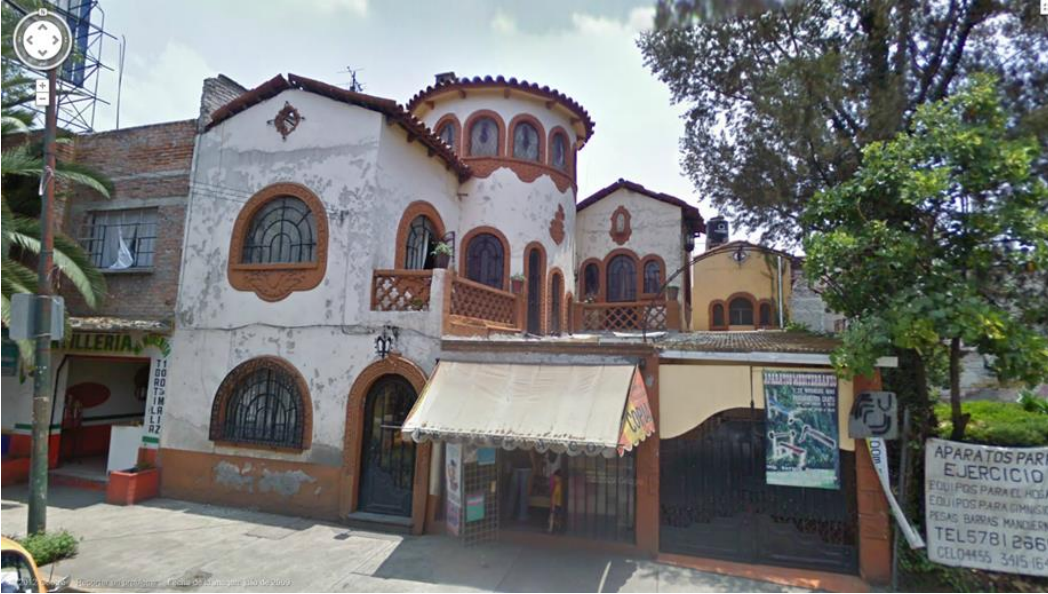
Fotografía 1. Una de las casas más antiguas de la colonia Industrial. Casa demolida.

Esta era una de las casas más representativas de la colonia Industrial, tanto por su arquitectura como por el tiempo que llevaba construida. Fotografía extraída de Google Maps.