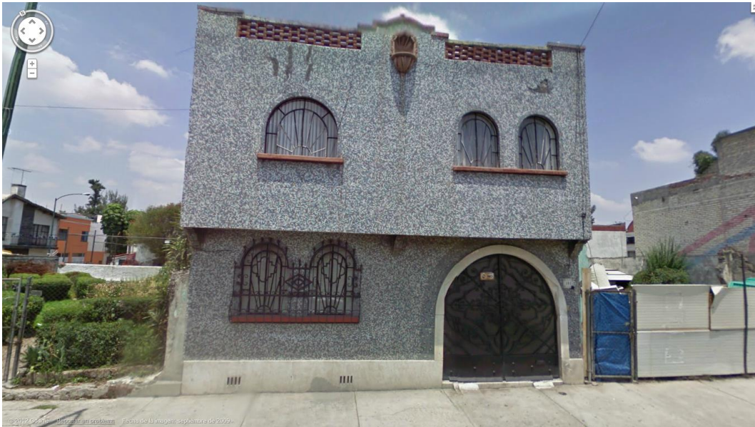
Fotografía 3. Ventanas y puertas semicirculares. Casa demolida.

Otra de las características de estos hogares, son las puertas y ventanas en semicírculo, al igual que los nichos religiosos.