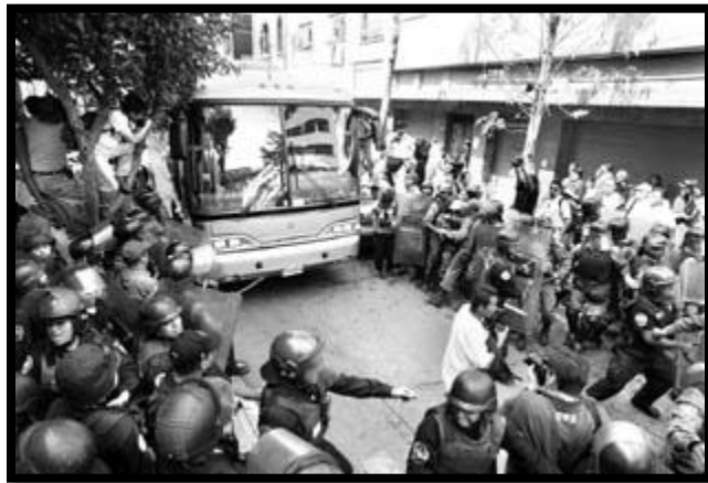
Foto 5: Enfrentamiento, trabajadores del IMSS con elementos de la PFP y Policía del D.F, abren paso al autobús que transportaba a los senadores al recinto para aprobar la reforma al RJP.

Los trabajadores del Seguro Social reaccionan a la pretensión del Senado en aprobar la reforma a la Ley del Seguro Social realizando una protesta en las inmediaciones de la sede parlamentaria, con la intención de suspender la aprobación, pero los legisladores del PAN, PRI y Verde Ecologista la aprobaron, recibiendo únicamente la respuesta de los cuerpos policiacos tanto del Distrito Federal como de la Policía Federal Preventiva, motivando un enfrentamiento (Torres, 2004, p.17).