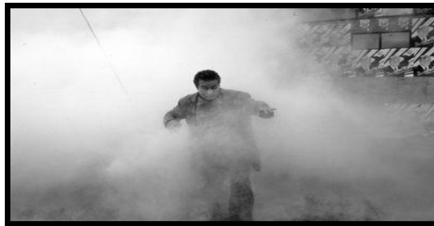
Foto 13: Trabajadores del IMSS usaron contenido de extintores como armas durante el enfrentamiento en las instalaciones de la colonia condesa.