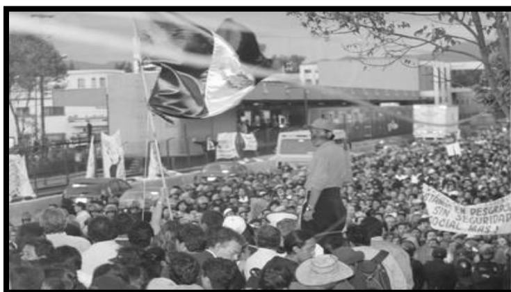
Foto 11: Movilización de trabajadores del SNTSS afuera de la sede sindical en calzada de Tlalpan.