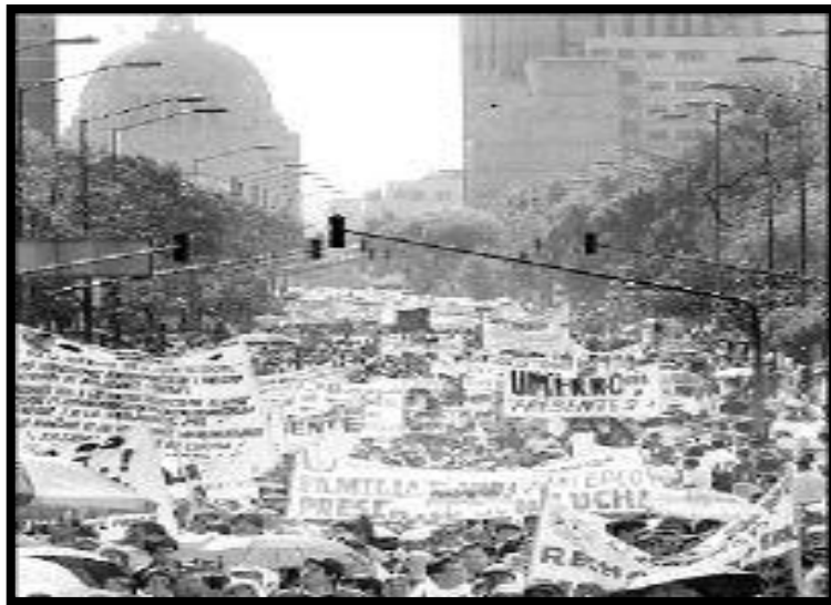
Foto 1: Multitudinaria marcha en paseo de la reforma hacia el zócalo capitalino SNTSS y organizaciones sindicales.

Este hecho generó molestia en los trabajadores sindicalizados, y en acción de repudio realizaron una marcha el 14 de octubre de 2003, con nutrida participación, logrando un gran impacto en los medios de comunicación y la sociedad, razón por la cual se evidenciaba un conflicto en el IMSS.