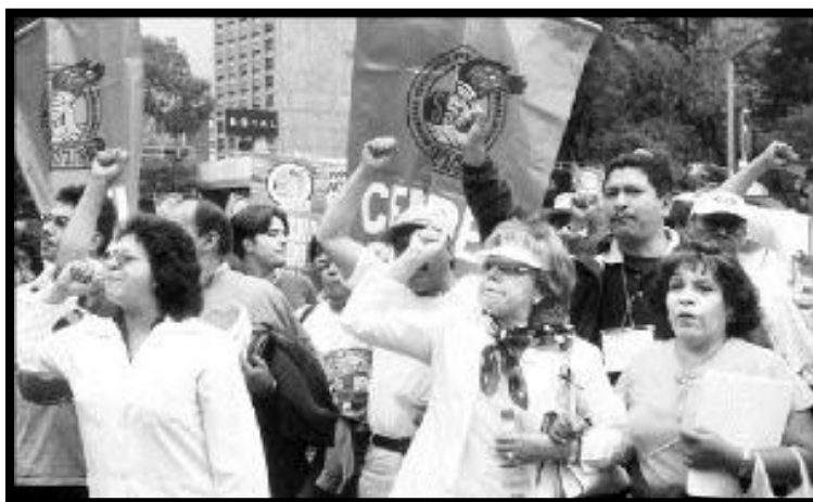
Foto 3: Logra solidaridad por parte de organizaciones sindicales (Fuente: “La Jornada”).

Con el contexto económico desfavorable, el Seguro Social vivió una crisis de enormes magnitudes, demográficamente el país cambio, la esperanza de vida aumentó, pero es obligado preguntarnos ¿Qué tipo de vida?, aumentaron los precios, los impuestos, el desempleo, elementos íntimamente ligados con los ingresos del Instituto (sin duda, sin cuota obrero-patronal, no hay Seguro Social), la incapacidad de generar nuevos empleos y conservación de los mismos, agravó el problema del IMSS, la insensibilidad política del gobierno generó un conflicto laboral con el sindicato.