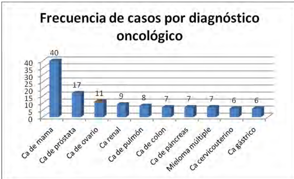
Grafica 1. Frecuencia de casos de acuerdo al Diagnóstico Oncológico.

Aquí observamos los principales diagnósticos oncológicos.