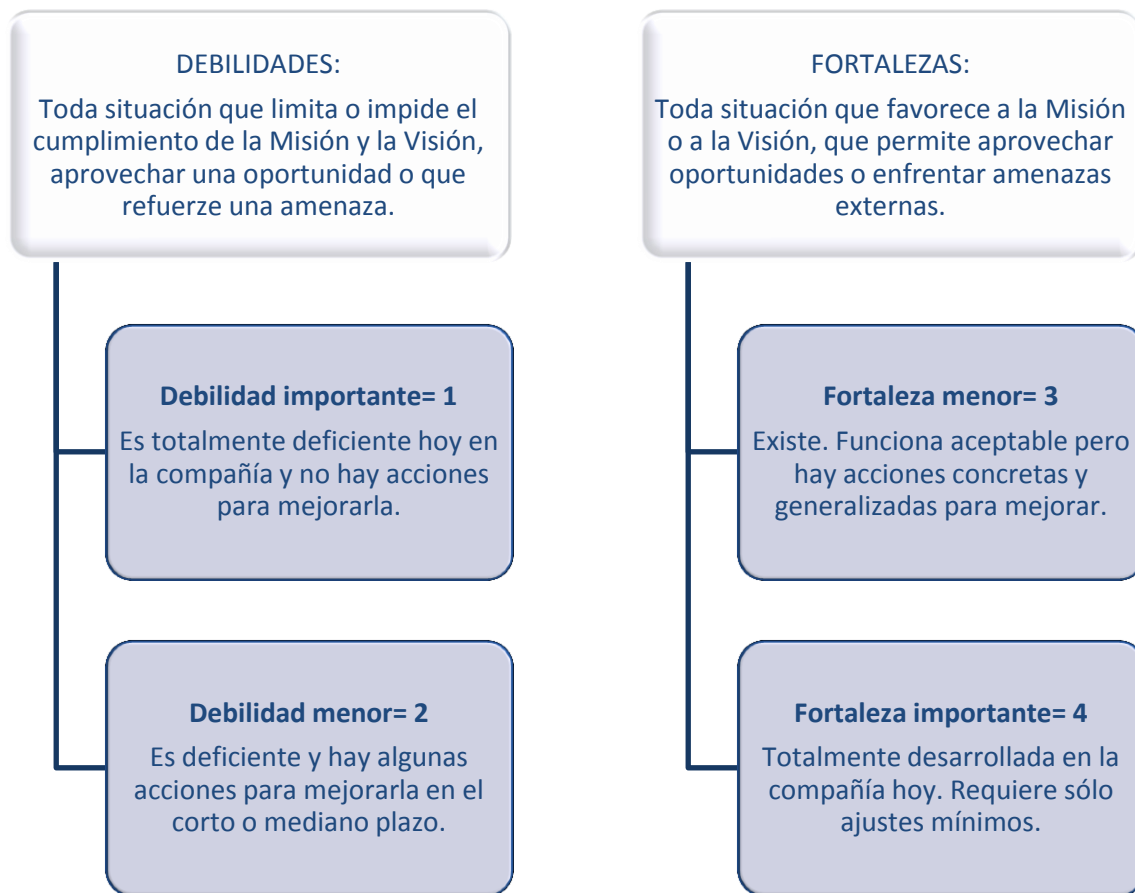
Cuadro 3. Definición y calificación para el análisis interno 1