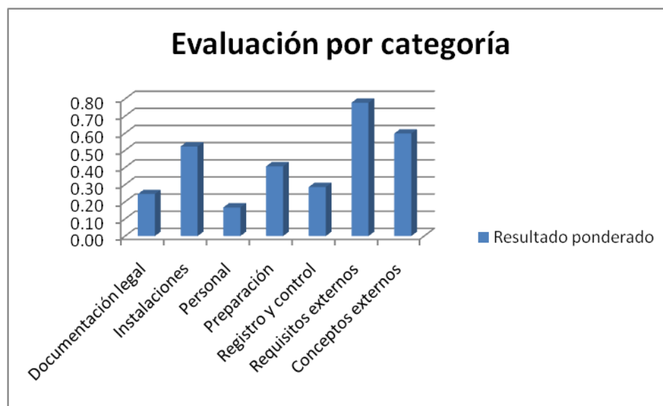
Figura 4. Gráfica del resultado ponderado por categoría.

Para un análisis más detallado de los requisitos que deben cumplirse en el área de Farmacotécnia se presentan los resultados obtenidos en la evaluación, en la Figura 4, los cuales se expresan por cada categoría con la finalidad de identificar fácilmente el rubro más deficiente en el que pudiera ser de orden prioritario las acciones correctivas.