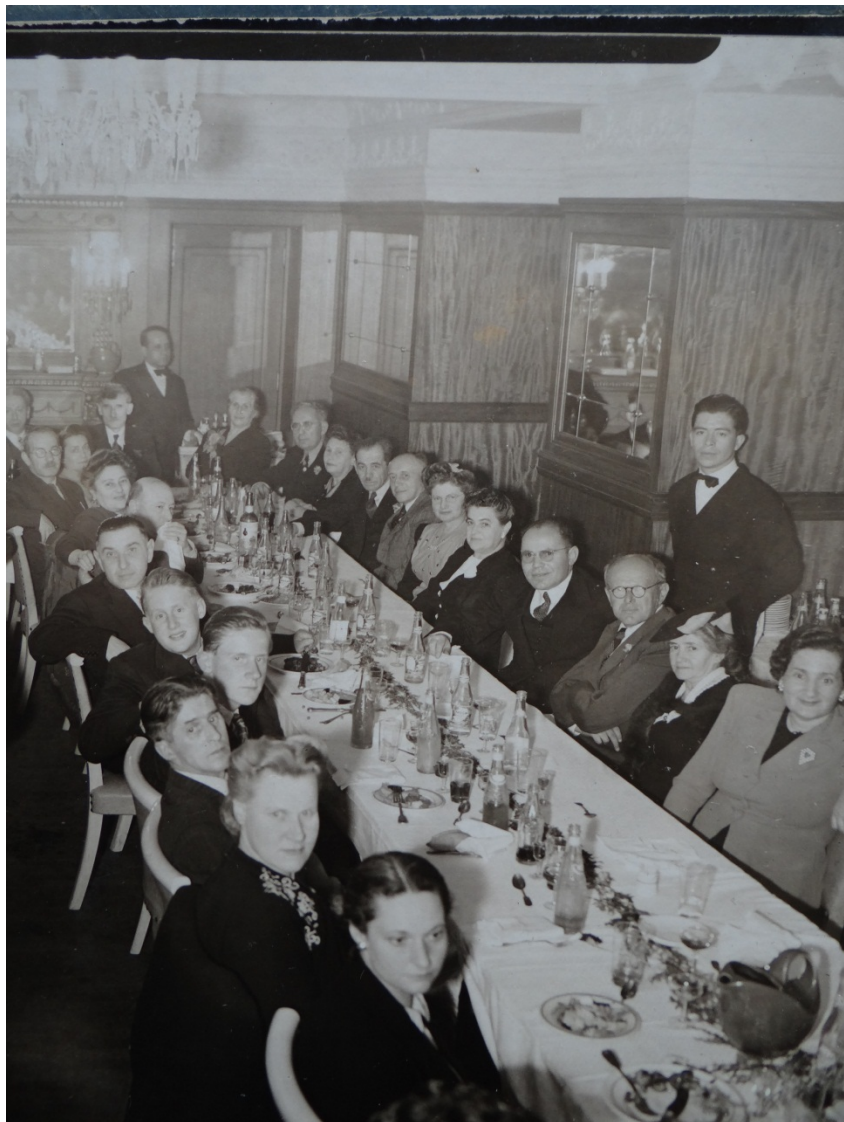
¿Bundistas en México? Un grupo fuera de la estructura