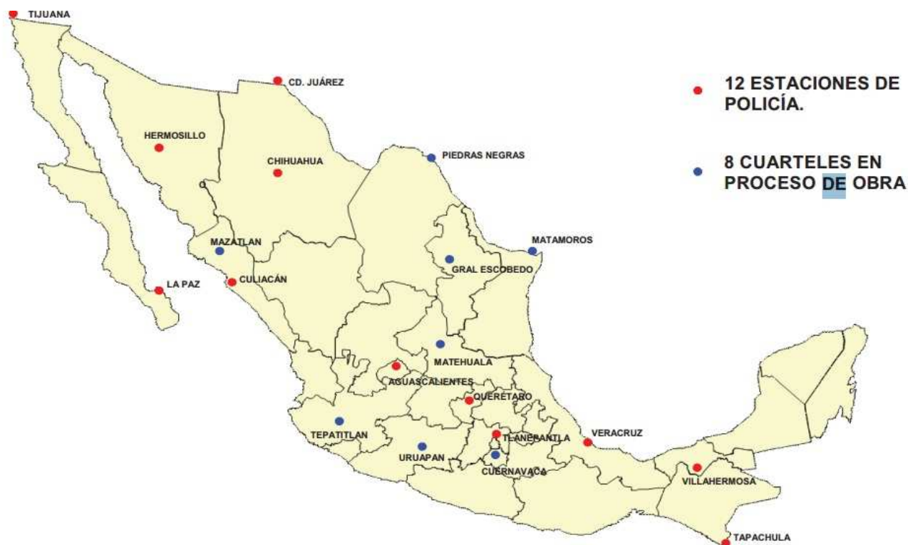
Mapa 1. Estaciones de la PFP a julio del 2009. 769

En segundo lugar se planteó una reorganización de las policías locales en concordancia con la vertiente estructural en materia de seguridad y acorde al eje rector 17 del Plan Nacional de Desarrollo. 770 Se partió de la valoración negativa del servicio policial, pues según documentos oficiales, la policía “se ubica entre aquellas [instituciones] a las que la sociedad confiere menores