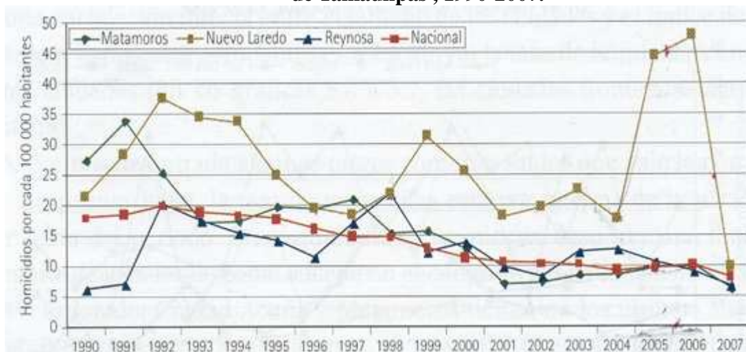
Gráfica 2. Evolución de la tasa de homicidio en las ciudades fronterizas de Tamaulipas , 1990-2007. 581

En síntesis, el estado de Tamaulipas muestra los errores de la militarización en la lucha antidrogas. Pone en evidencia la poca cooperación, y en muchos casos obstrucción, entre los tres órdenes de gobierno en la seguridad pública, pues como lo he documentado los policías locales desarrollaron fuertes vínculos con las organizaciones traficantes de drogas. Contradice a la política de captura de líderes de traficantes, pues tras la captura de Osiel Cárdenas Guillen se observa un incremento en la violencia como producto de la lucha por la supremacía al interior de la OTG y en