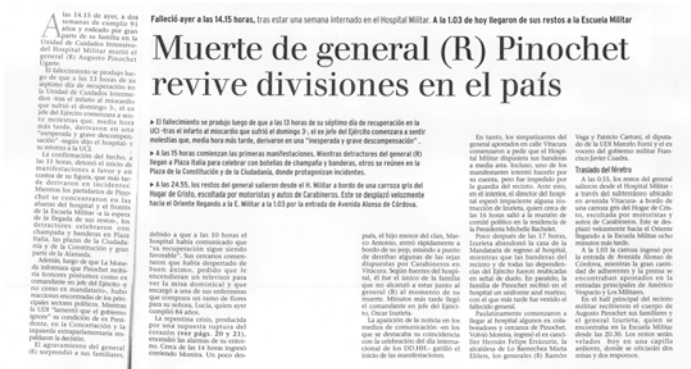
Muerte del General Pinochet revive divisiones en el país”, La Tercera , 11 de diciembre de 2006.

“Muerte del General Pinochet revive divisiones en el país”, decía el periódico La Tercera .