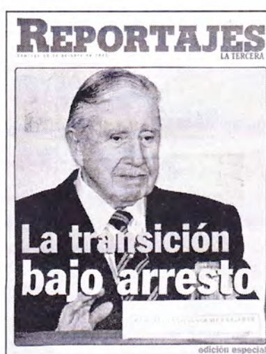
“La transición bajo arresto”, La Tercera Reportajes, Octubre 25, 1998: portada 202

Y sí: es probable que la mayoría de los chilenos se acuerden del 16 de octubre de 1998. A la larga, sería un día casi tan significativo en el plano de la memoria como el 11 de septiembre de 1973 o el plebiscito del 5 de octubre de 1988 que terminó con la dictadura. Con el “accidente Pinochet”, el entonces senador vitalicio perdería finalmente el poder.