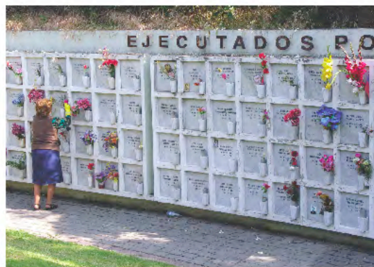
Memorial del Detenido Desaparecido y Ejecutado Político. Cementerio General de Santiago.

4) El vacío de los desaparecidos . El tejido social que la guerra civil puso a prueba de modo radical experimenta un proceso de reconstitución a raíz de la vuelta de la democracia en 1990. Empero, los remanentes que la dictadura deja tras de sí rebasan los límites de lo socialmente pensable. ¿Qué hacer con el vacío de los desaparecidos? ¿Qué espacio ocupan en el entramado histórico de un hecho que, reinaugurado el régimen democrático, busca cerrarse para “Nunca Más” repetirse?