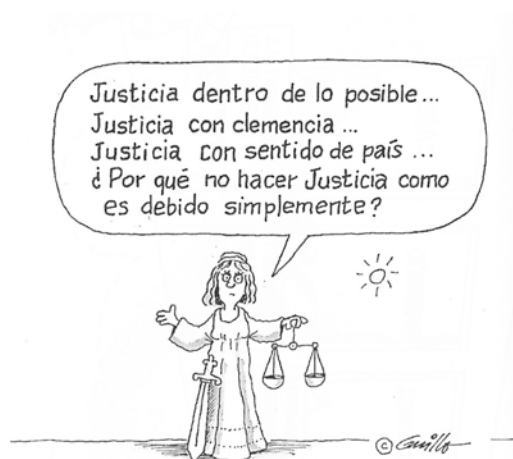
“Justicia”, @tentamente Guillo. 186

Además de los efectos múltiples de este proyecto en la sociedad chilena, la Ley Aylwin dio cuna a una de las discusiones más enérgicas vividas hasta el momento dentro de la Concertación de Partidos por la Democracia. ¿Cuánta y qué verdad? ¿Cuánta y cuál justicia? El 18 de agosto de 1993, la Cámara de Diputados aprobó la ley, después de tres sesiones de debates intensos. Los socialistas votaron en contra, los diputados del Partido por la Democracia se abstuvieron y la Democracia Cristiana la apoyó. Miles de civiles llenaron las galerías de la Cámara, gritando su oposición a la propuesta de ley. Miembros de la Agrupación de Familiares de Detenidos Desaparecidos comenzaron una huelga de hambre en protesta por la legislación.