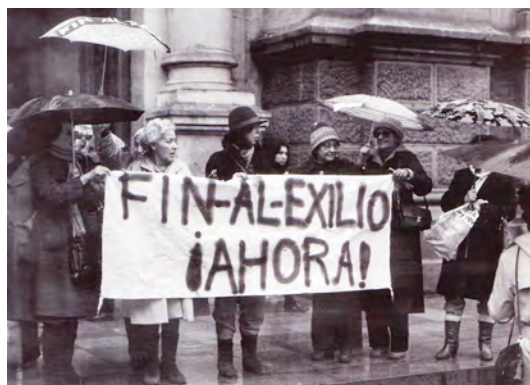
De derecha a izquierda: Cartel pro Solidaridad con Chile (Ámsterdam); afiche que invita a boicotear el juego por el paso a la final de la Copa Davis de 1975, entre el equipo chileno y el de Suecia (Suecia); Fotografía de una manifestación relámpago en Santiago de Chile, exigiendo el fin del exilio.