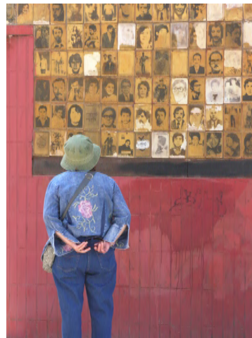
“Muro de la Memoria” de Claudio Pérez y Rodrigo Gómez. Puente Bulnes, Santiago de Chile.

Con todo, el espacio no escapa al mismo desgaste que describíamos en la Villa Grimaldi. Los rostros están rayados, borrados o modificados. De cualquier forma, la reaparición del “desaparecido” mediante una colección de fotografías restituye la identidad personal de las víctimas, tantas veces borrada por placas conmemorativas o cifras estadísticas que refieren al periodo de represión militar. La interacción de la gente con el Muro significa por lo menos que la sociedad ha notado las “nuevas presencias”; la foto ha logrado interpelar al peatón y, en ese sentido, ha cumplido un objetivo pocas veces logrado con otros memoriales.