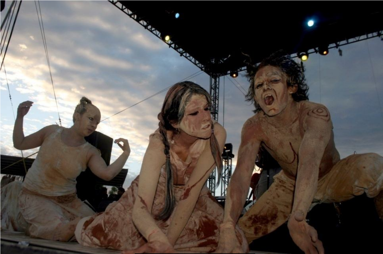
Catarsis Quetzalli Nichte Ha 13/03/2010