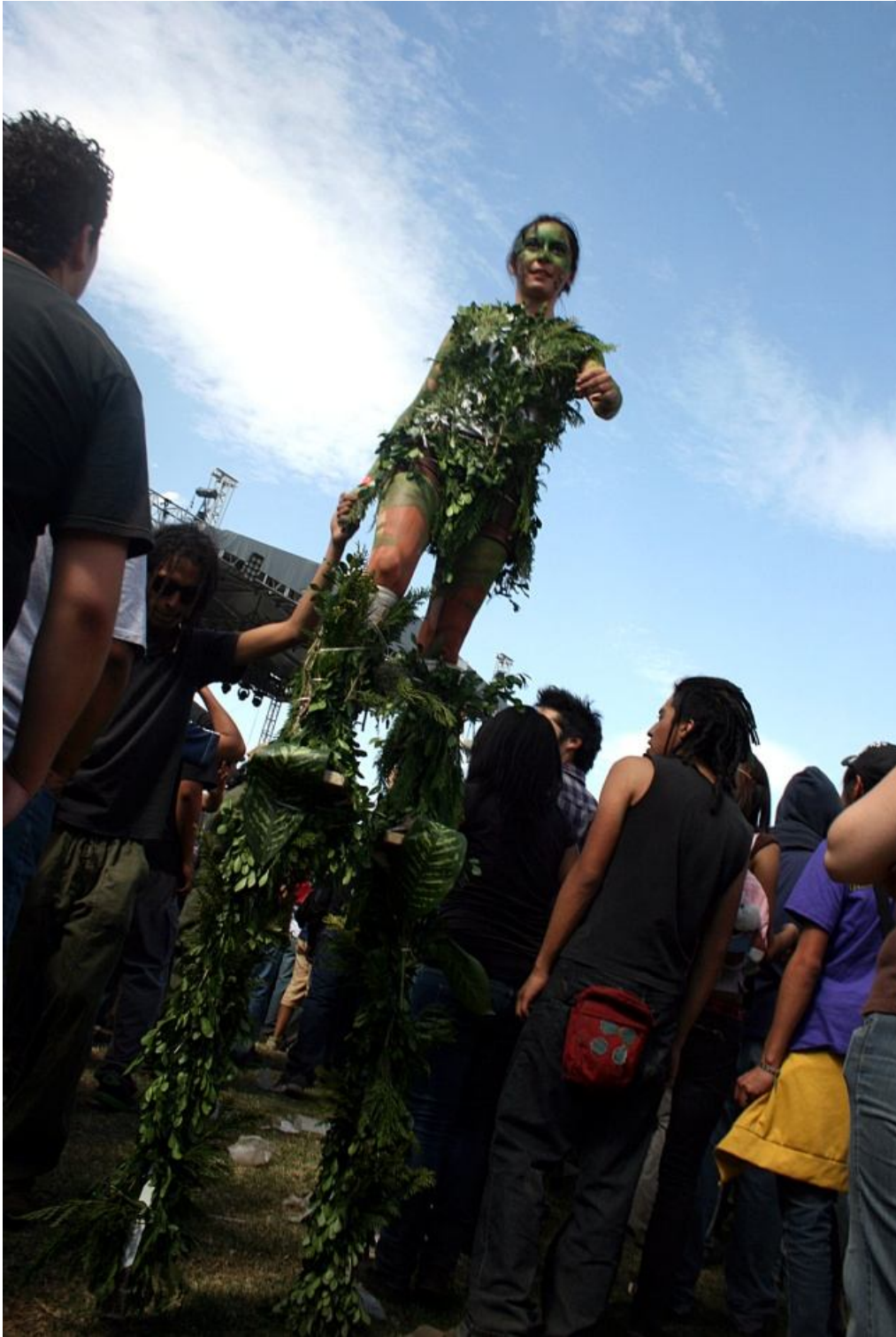
Ents y rock Quetzalli Nichte Ha 13/03/2010