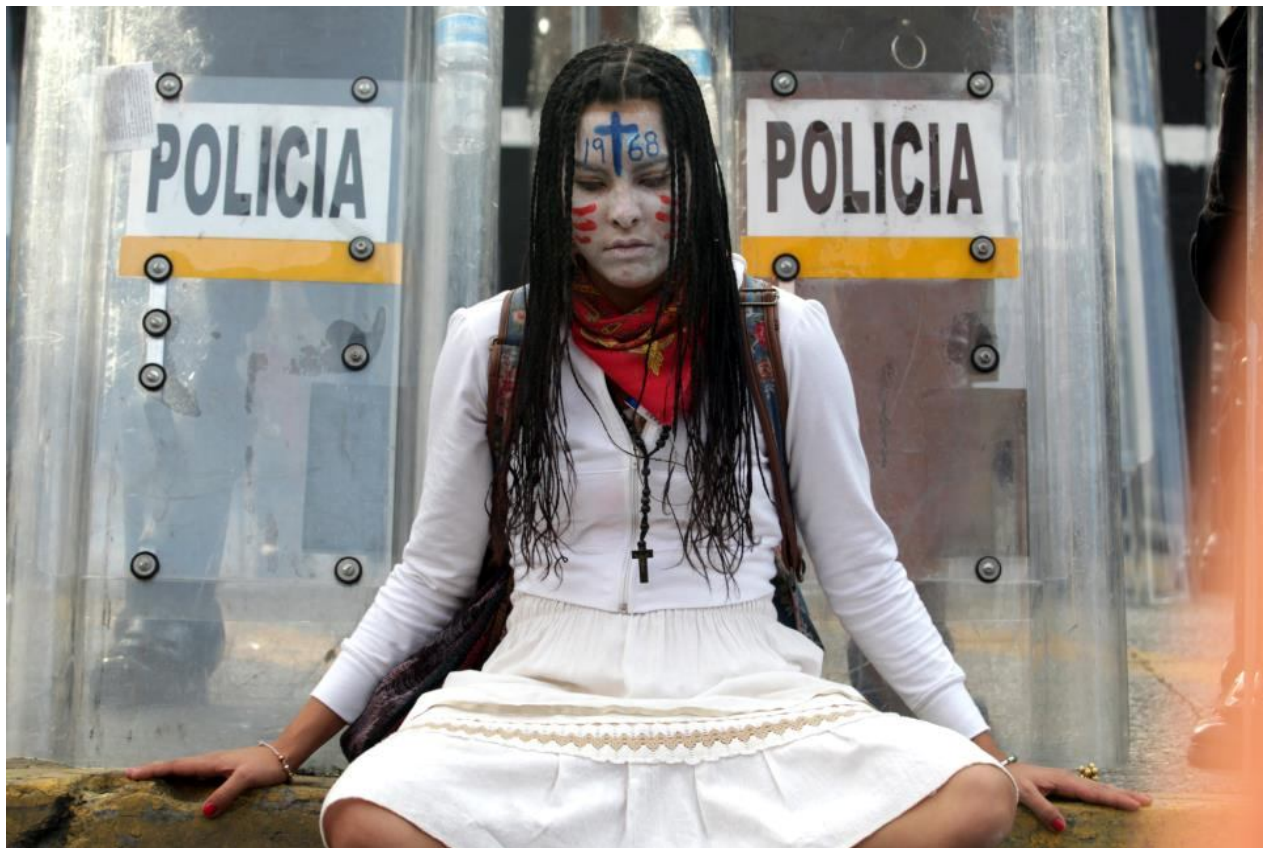
Memoria Autor: Quetzalli Nicté Ha 02/10/2012