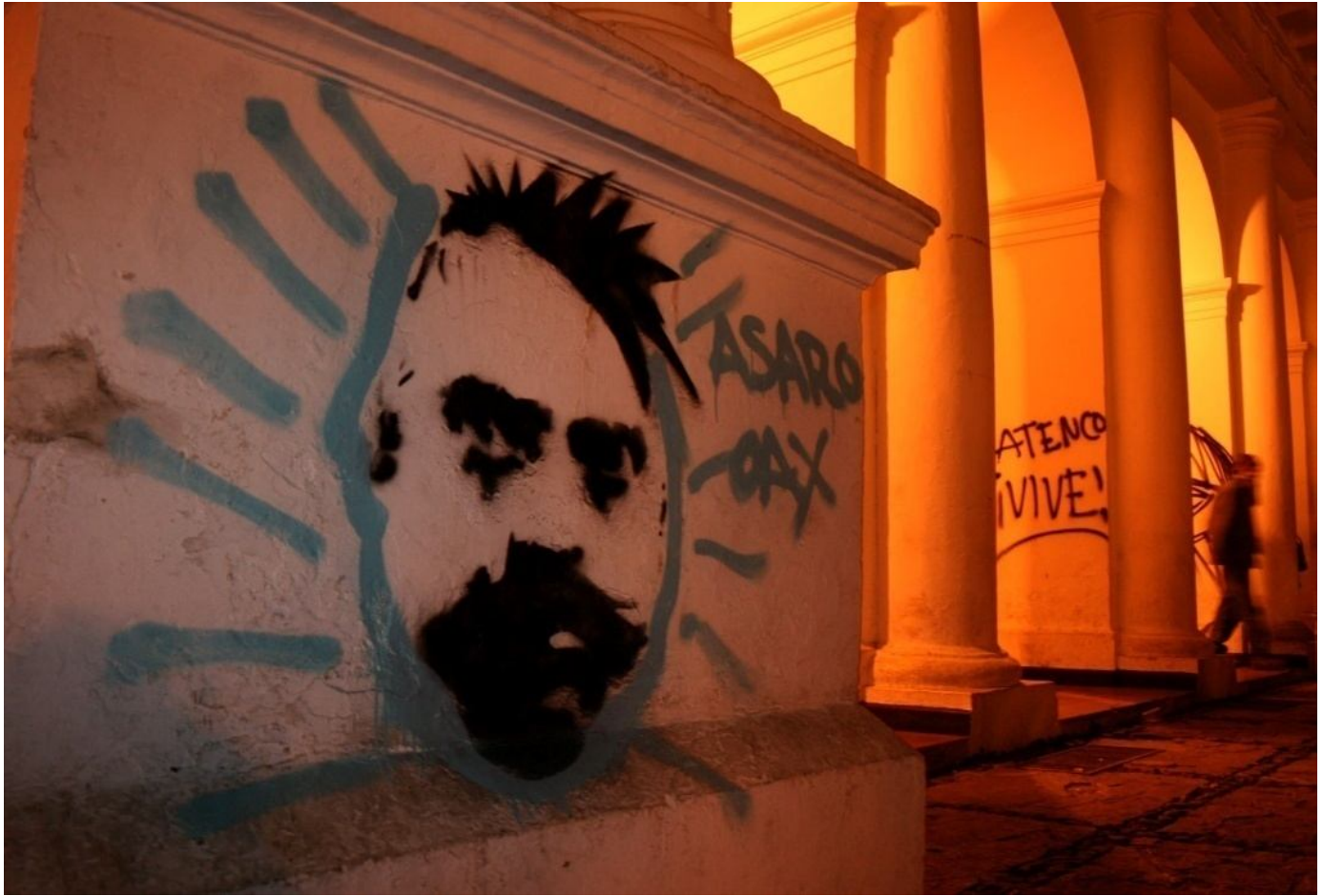
Herencia Quetzalli Nichte Ha 03/01/2009