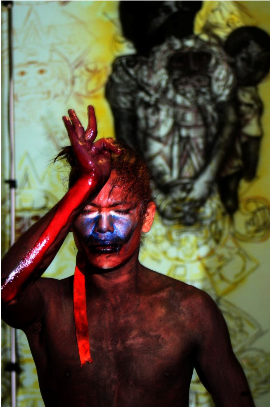
Dignidad Quetzalli Nichte Ha 12/09/2009