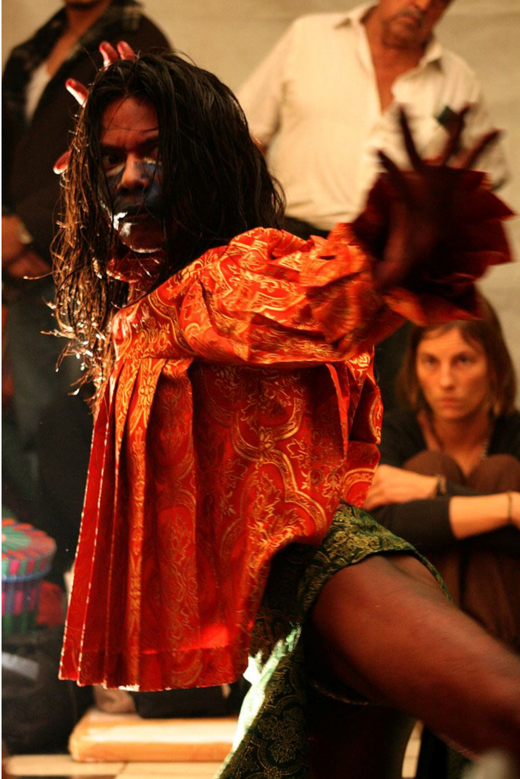
Conquista Quetzalli Nichte Ha 12/09/2009