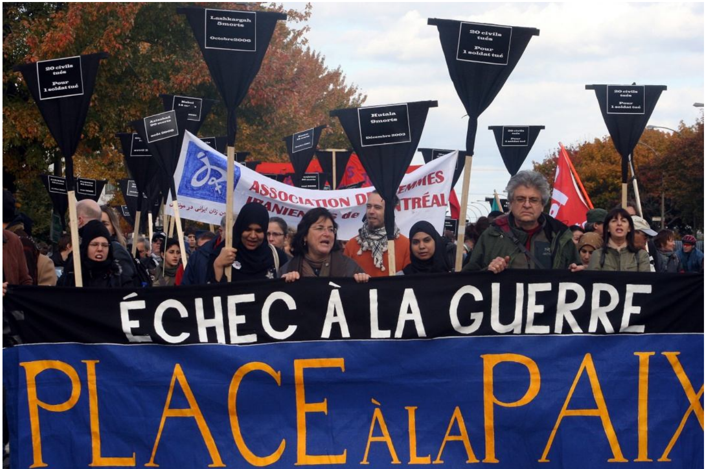
Afganistan Quetzalli Nichte Ha 18/10/2008