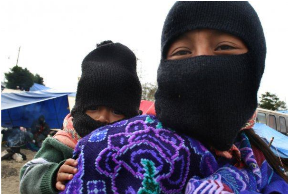
Sembrando Dignidad Quetzalli Nicté Ha 01/01/2009