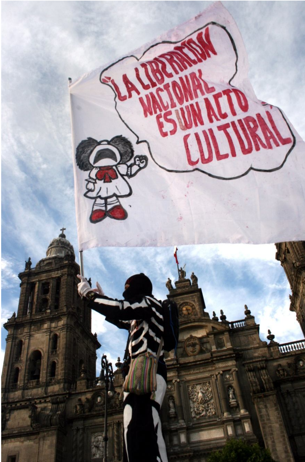
Arte y cultura, revolución segura Quetzalli Nichte Ha 25/02/2010