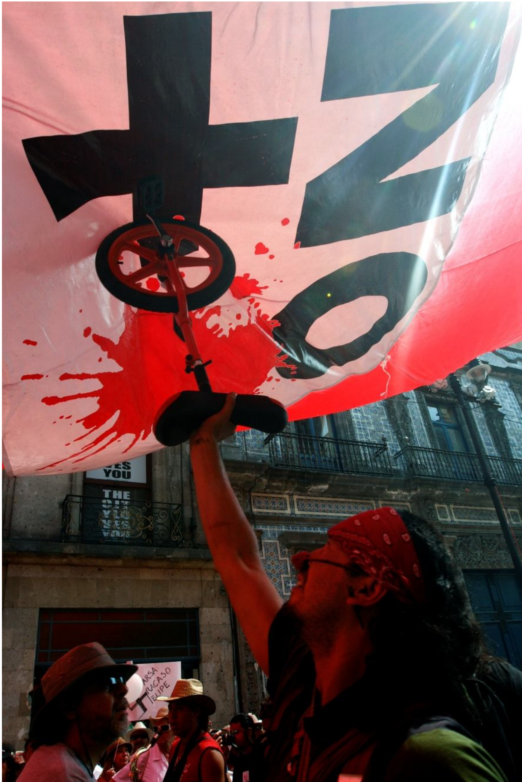
Clown Quetzalli Nichte Ha 08/05/2011