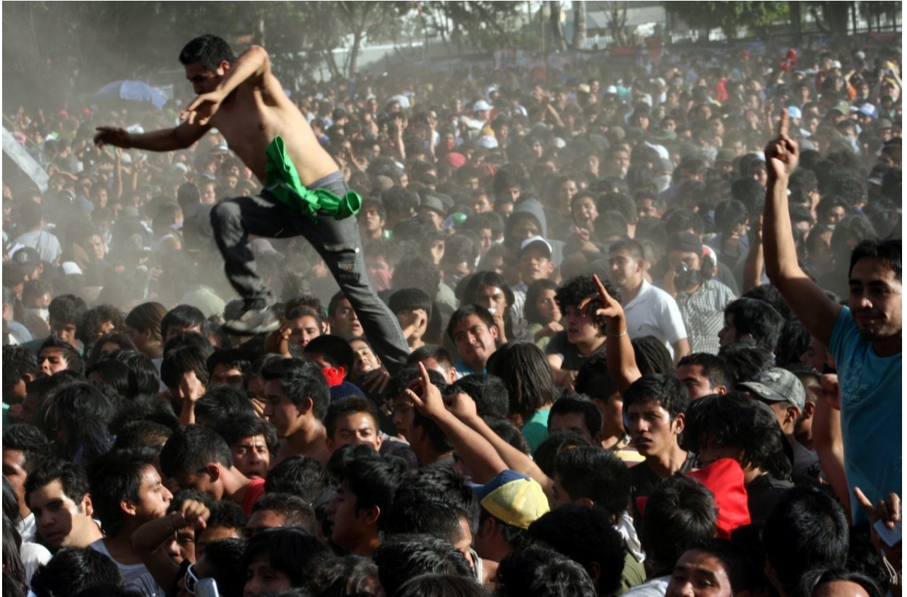
Impulso Quetzalli Nicté Ha 14/03/2010