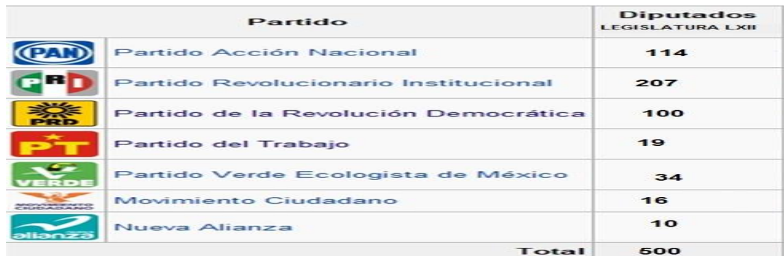
CUADRO DE LA CONFORMACIÓN POLÍTICA DE LA CÁMARA DE DIPUTADOS DE LA LXII LEGISLATURA 169 .

El Partido Acción Nacional con 114 diputados, el Partido Revolucionario Institucional tiene 207 diputados, el Partido de la Revolución Democrática tiene 100 diputados, el PT tiene 19 diputados, el Partido Verde Ecologista de México tiene 34 diputados, el Movimiento Ciudadano tiene 16 diputados y el Partido Nueva Alianza tiene 10 diputados.