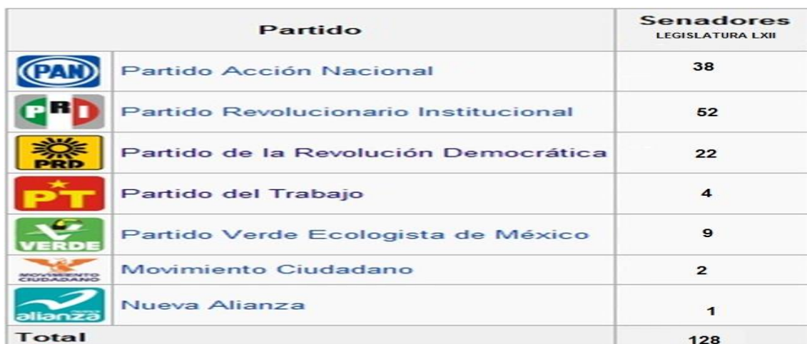
CUADRO DE LA COMPOSICIÓN POLÍTICA DE LA CÁMARA DE SENADORES DE LA LXII LEGISLATURA 170 .

Ecologista de México tiene 9 senadores, el Movimiento Ciudadano tiene 2 senadores y el Partido Nueva Alianza con 1 senador.