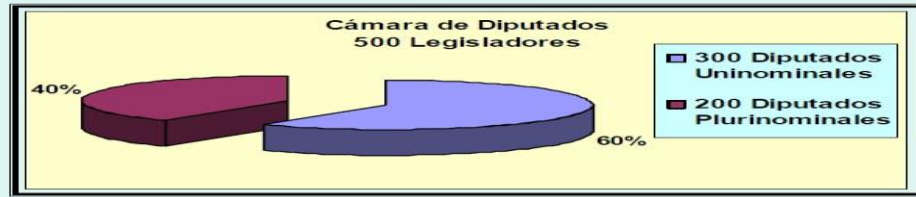
GRÁFICA DE LA INTEGRACIÓN DE LA CÁMARA DE DIPUTADOS 161 .

La Cámara de Diputados se conforma por 500 representantes de la Nación, electos en su totalidad cada 3 años, por los ciudadanos mexicanos.