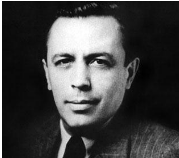
Manuel Gómez Morín (1897-1972) fundador del Partido Acción Nacional.

El Partido Acción Nacional es ejemplo del conservadurismo moderno. Sostenido por un discurso democrático liberal, pero con principios de corte conservador en el aspecto de la política económica y la Hacienda Pública, tuvo en Manuel Gómez Marín, su creador y primer gran personaje destacado de la oposición blanquiazul, las bases ideológicas que guardan múltiples semejanzas con los idearios y las palabras de Lucas Alamán, el Edmund Burke mexicano.