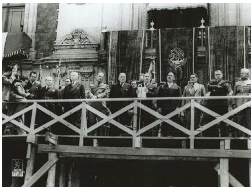
Imagen del Palacio Nacional que muestra a los primeros siete presidentes del México Institucional: al centro con la hoja en las manos, el presidente vigente, Manuel Ávila Camacho, corriendo hacia la izquierda de la foto están Plutarco Elías Calles, Abelardo L. Rodríguez (vestido de militar), Pascual Ortiz Rubio y Adolfo de la Huerta. Del centro a la derecha, Lázaro Cárdenas y Emilio Portes Gil.

Los partidos de oposición aunque cumplían con los requisitos y las características con los cuales se pueden considerar como tal, es un hecho que la mayoría se clasificaban como partidos antisistemas. 51 Organizaciones que atacaban al PRI, pero en el fondo reconocían sus triunfos (en elecciones fraudulentas) y aplaudían sus iniciativas, de modo que socavaban el discurso y fomentaban la legitimidad del gobierno al que supuestamente se oponían.