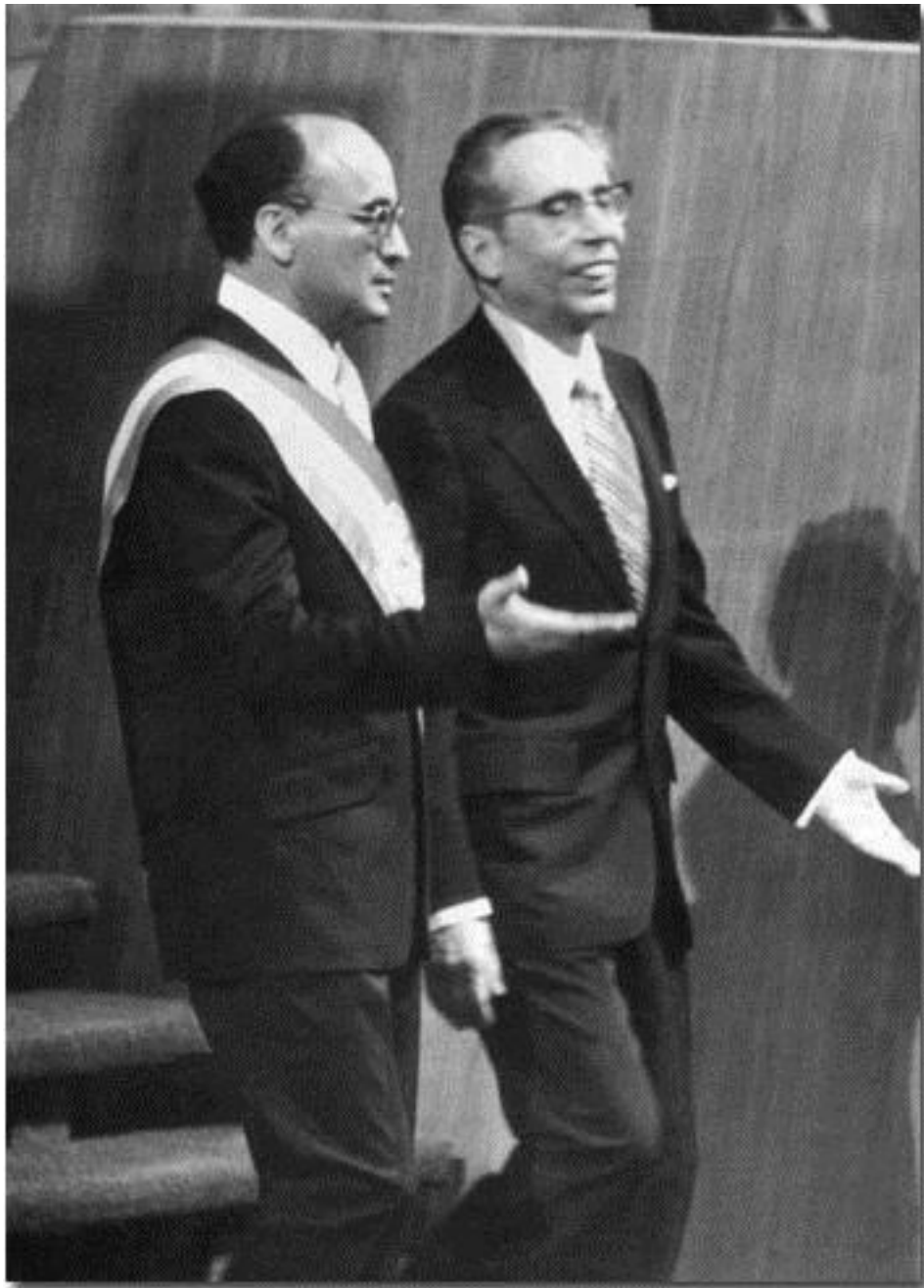
Imagen de 1970 con Gustavo Díaz Ordaz al momento de entregar la banda presidencial a su sucesor Luis Echeverría Álvarez. Ambos son señalados como los autores intelectuales de lo ocurrido en Tlatelolco el 2 de octubre de 1968.

Sin embargo los parámetros establecidos en la tabla nos muestran claramente el descenso y declive de la economía mexicana desde la década de los setenta y finalmente el tránsito al neoliberalismo en los años ochenta, que fueron un víacrucis del régimen. El famoso “halconazo” de 1971 y los levantamientos de guerrillas populares en el sureste mexicano encabezados por Lucio Cabañas y