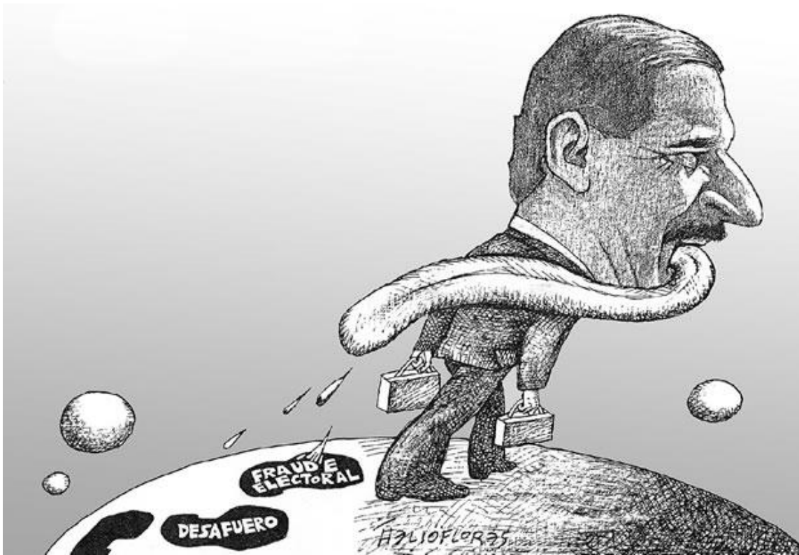
Helioflores. Cartón político aduciendo la fragilidad de Fox al abrir la boca.