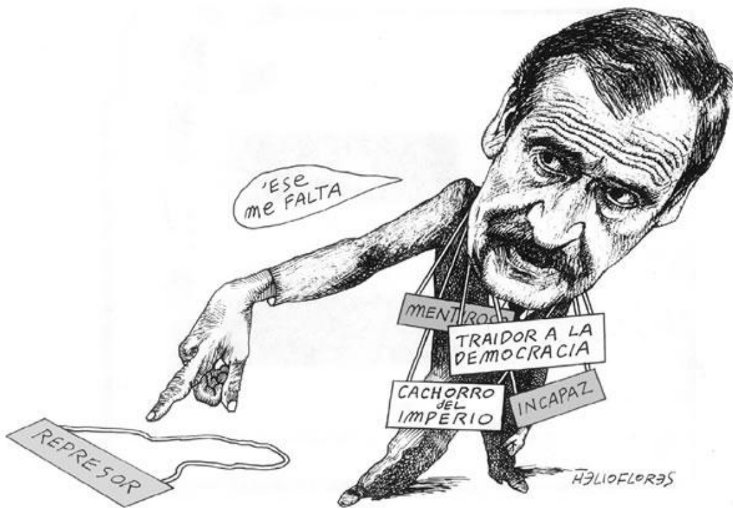
Helioflores. Cartón político.