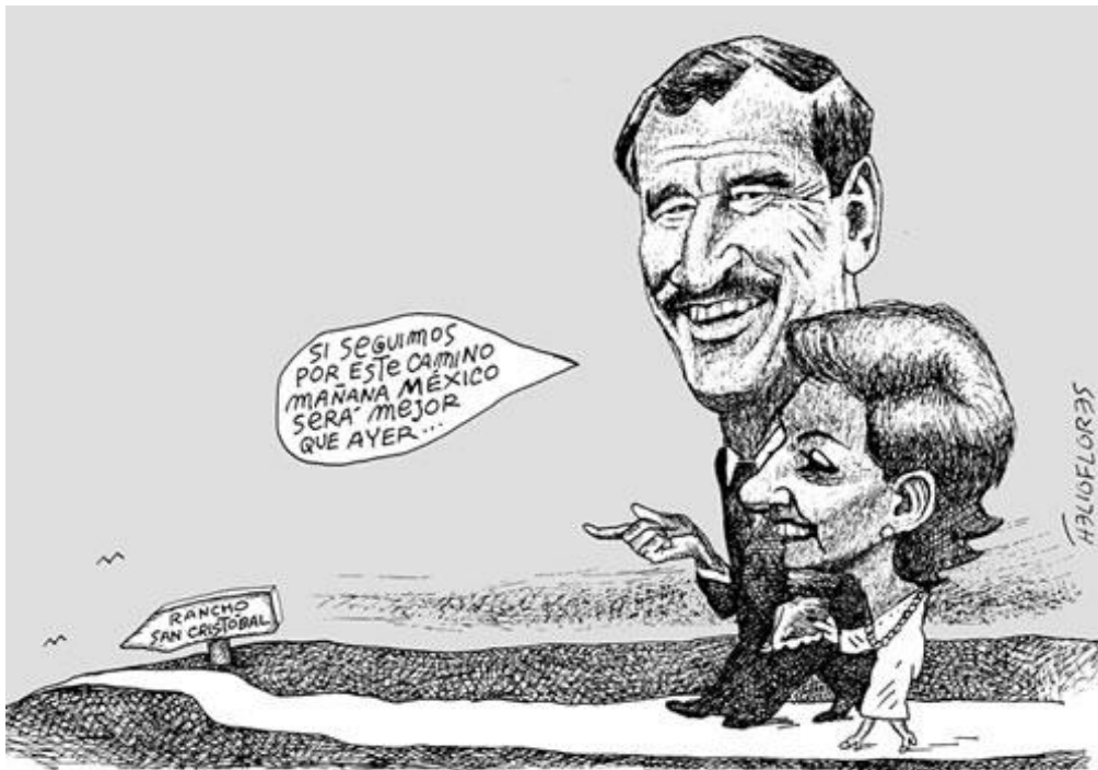
Helioflores. Cartón Político. "Mañana México será mejor que ayer"

El mismo Vicente Fox se expresaba así del reino de la fantasía en el que gobernaba: "El resultado es que tenemos un país maravilloso, que las cosas caminan en este país, que la gente trabaja, que la gente hace inversiones" . Posteriormente a mediados del sexenio se saboteaba, solo se ponía el pie: "La verdad es que las cosas marchan bien en el sentido del presupuesto, las tareas de gobierno, de los programas, ciertamente tenemos el problemón de que no hay crecimiento en el país, pero eso tarde o temprano se va arreglar"