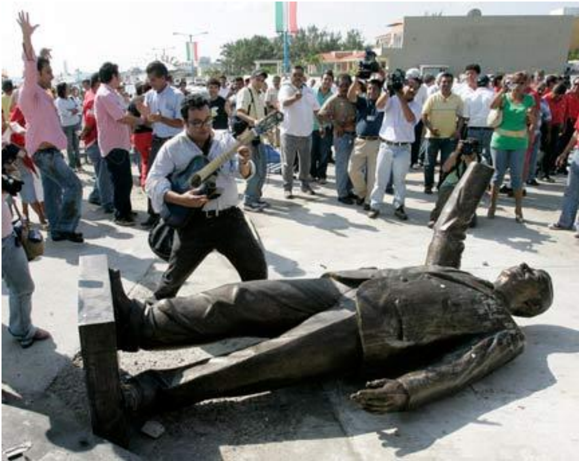
El fin del mito de "México ya cambio"