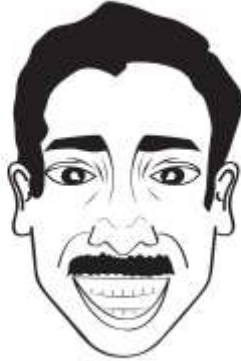
Jorge Ortiz de Pinedo

Una de las personalidades actuales más importantes dentro de la historia de la comicidad en México, tenemos al Sr. Jorge Ortiz de Pinedo quién en una entrevista para Notimex opinó lo siguiente: