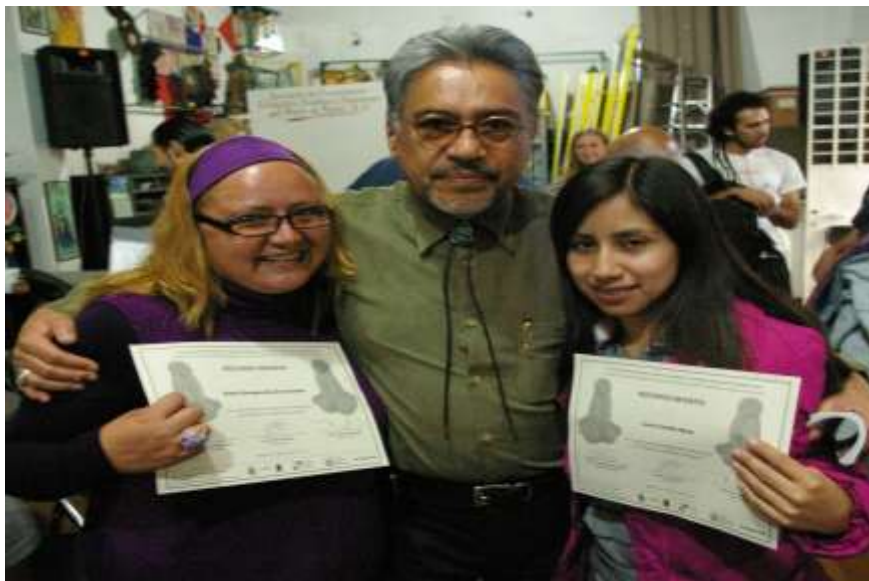
Tepito Bravo: 2º Diplomado de albures. CONACULTA.