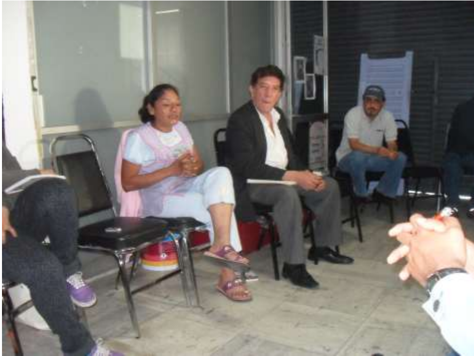
Tepito Bravo: 1º Diplomado de albures. CONACULTA. Foto tomada el 6 de marzo de 2012 en la Galería José María Velasco. Lourdes Ruiz