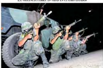
En un operativo de seguridad en un estado de la república, soldados de la Guardia Nacional y del Ejército Mexicano se enfrentaron a un grupo de delincuentes que intentaban robar un camión con mercancía.

LA VIOLENCIA COBRA 19 VIDAS EN CUATRO ESTADOS