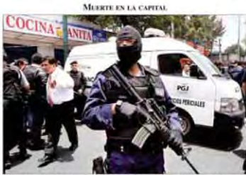
MEERTE EN LA CAPITAL