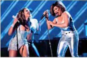
Una muestra de cómo Amy Winehouse se comportó en el escenario durante su actuación en el Grammy Awards. En la imagen se la ve cantando y tocando el piano.

■ Huyen ante amenazas criminales; la mayoría son rechazados