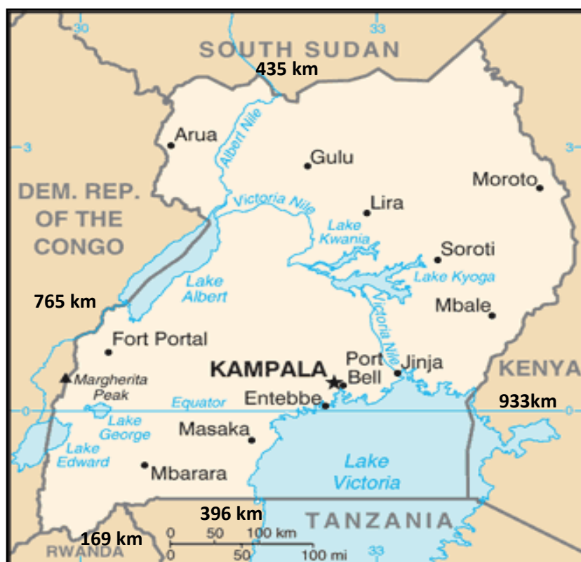
Mapa 1 Uganda