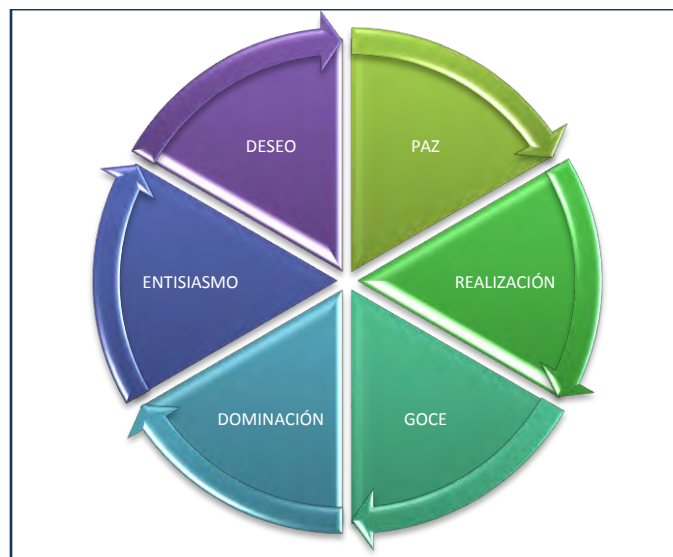
Ilustración 2.3 Diagrama de Respuestas emocionales

El punto de vista de este autor es interesante, de alguna forma generaliza dentro de estados emocionales las reacciones del individuo independientemente de que sean emociones contrarias, es decir dos emociones opuestas pueden caber dentro de un mismo estado emocional. El siguiente diagrama explica la funcionalidad de estas respuestas emocionales: