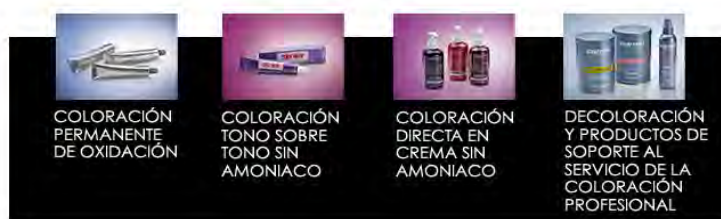
Ilustración 3.6 Líneas de color Fuente: ALFAPARF MILANO México

El servicio color, tiene como finalidad cambiar completamente la imagen, pero también conseguir unos reflejos ligeros, decoloraciones, mechas o cobertura de las canas, supone una difícil elección que requiere el consejo de un experto. Los productos que se aprecian en la tabla 3.3.