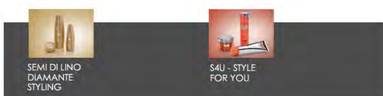
Ilustración 3.8 Líneas de estilizado

Se compone de productos de estilizado para satisfacer los gustos y la personalidad de todos. Trend avant-garde, fórmulas hi-tech y texturas versátiles, para una creatividad de estilo ilimitada.