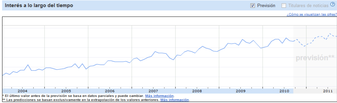
Ilustración 3.3 Nivel de Interés en el tiempo

El siguiente gráfico muestra el nivel de interés del Mercado por regiones geográficas en donde se destaca la presencia de Brasil, México e Italia que son 3 de los 5 países donde ALFAPARF cuenta con plantas de producción.