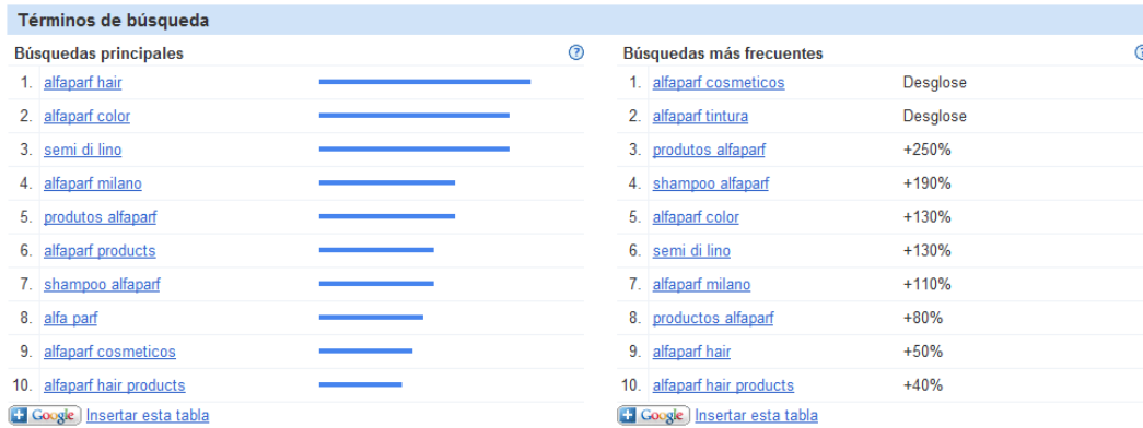
Ilustración 3.5 Productos con mayor demanda

Cabe mencionar, que sólo hay una marca en Estados Unidos que ha logrado posicionarse como la marca de cosmética capilar mayor vendida y querida en ese país: AVEDA, sin embargo esta marca no se encuentra a la venta en territorio mexicano.