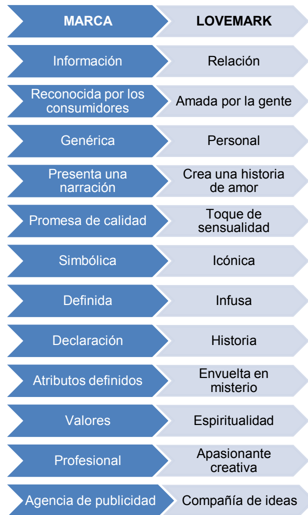
Ilustración 2.4 Diferencias entre marca y Lovemarks

éste será el mejor. Las Trustmarks van un paso adelante porque superaron a las marcas simples, sin embargo las Lovemarks las marcas que amamos no van un paso más allá que las Trustmarks, si no que han ganado la competencia. Así que viéndolo desde este punto de vista tener una relación de amor verdadera es mejor que tener una relación de confianza, a lo que nos llevan las: Lovemarks es que se ganan las dos. Para profundizar un poco más en el de Lovemarks se analizarán las diferencias entre una la presentación de una marca, y la promesa de una Lovemarks.