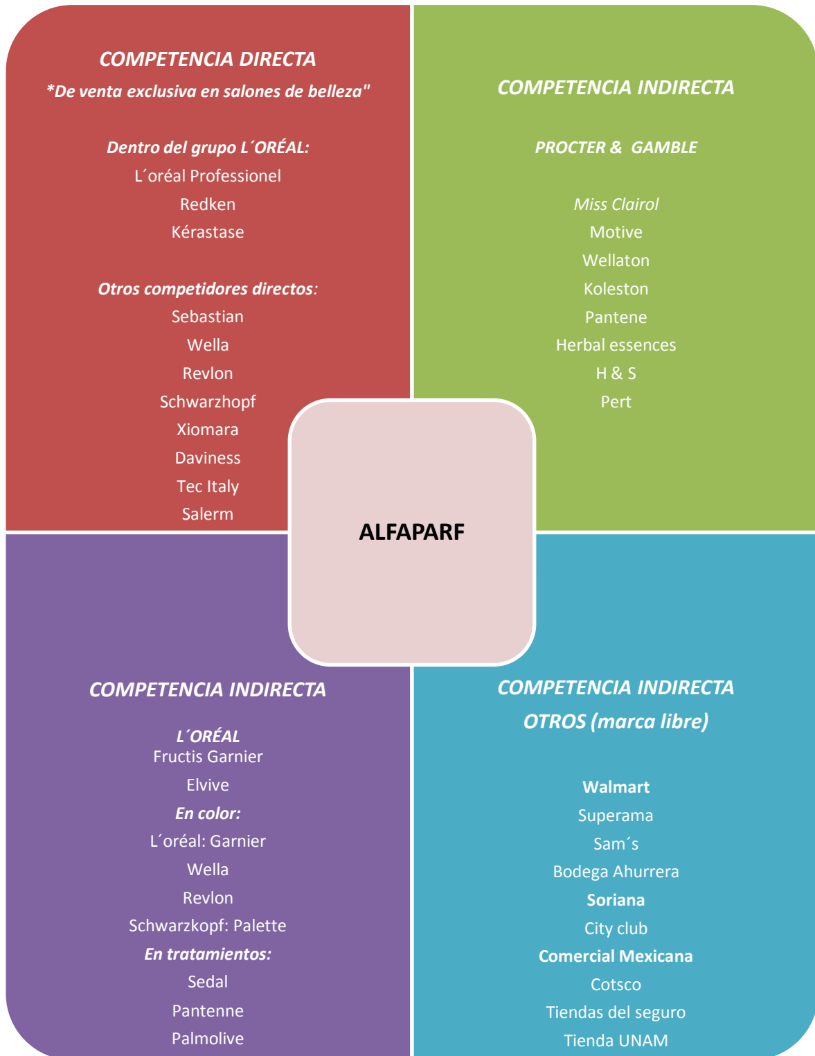
Ilustración 3.2 Cuadro comparativo de competencia