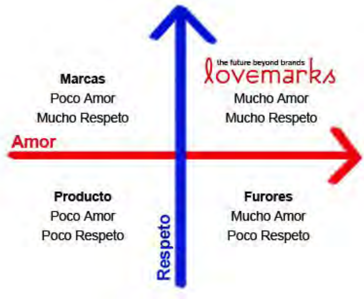
Figura 2.5 Representación de Los ejes amor y respeto

Kevin Roberts, presentó un mapa en el que claramente se puede diferenciar en donde los principales ejes para forjar a una marca, son: el amor y el respeto. Es sencillo, el mapa se puede interpretar de la siguiente manera: