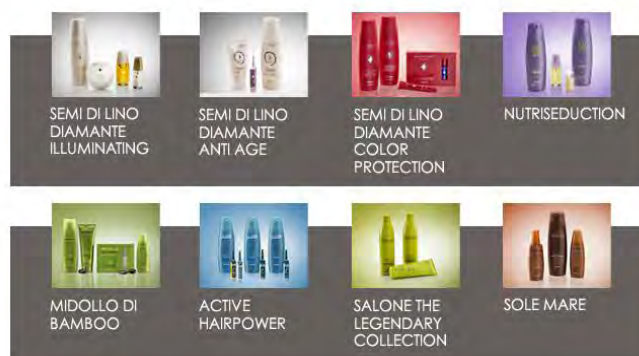
Ilustración 3.7 Líneas de cuidado