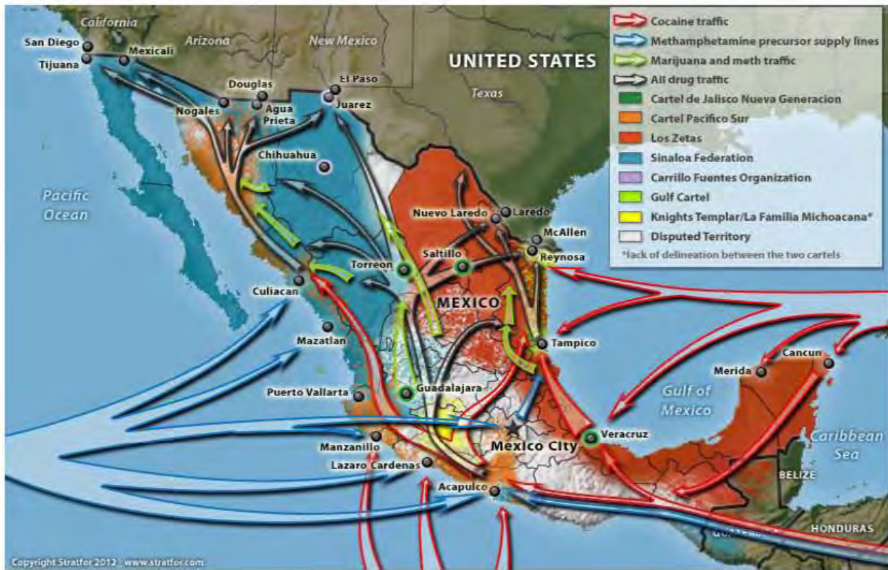
Mapa de rutas del Narcotráfico.