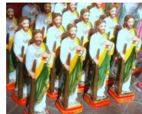
Imágenes 4,5 y 6