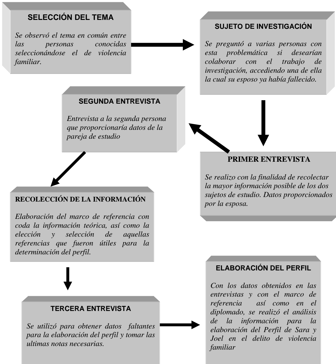
DIAGRAMA DE OBTENCIÓN DE LA INFORMACIÓN.