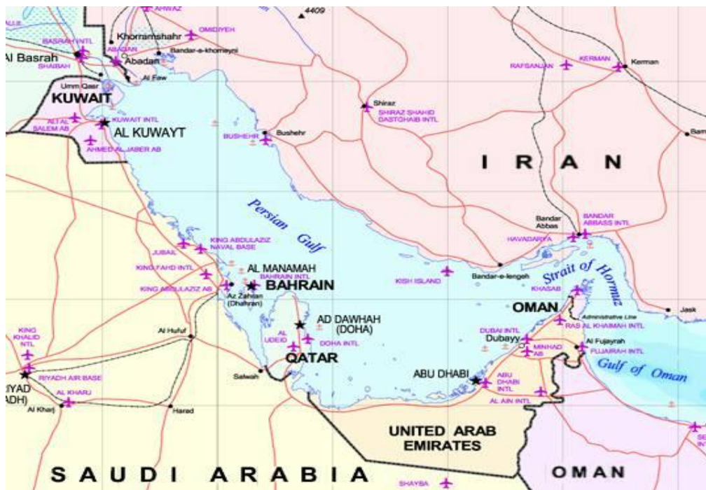
Imagen 3. Véase: http://www.canariasantelacrisisenergetica.org/2007/03/28/importancia-del-estrecho-de-ormuz-para-el-abastecimiento-energetico-mundial/

En esta pretensión de Israel de acabar con Irán como potencia regional se visualizan también razones de geoestrategia mundial fundamentadas no solo por el control de los recursos energéticos de la región, sino sobre todo, por conseguir el dominio del estrecho de Ormuz clave en el flujo del petróleo mundial, pues por el mismo transita aproximadamente el 40% de la producción petrolífera mundial.