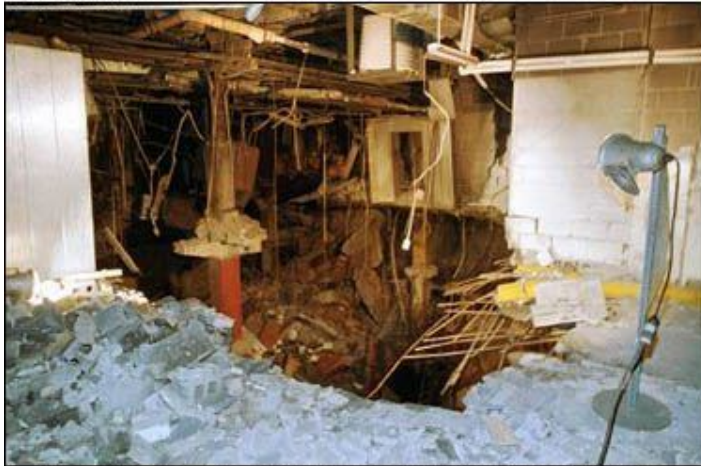
The underground parking garage of the World Trade Center one day after the February 1993 explosion