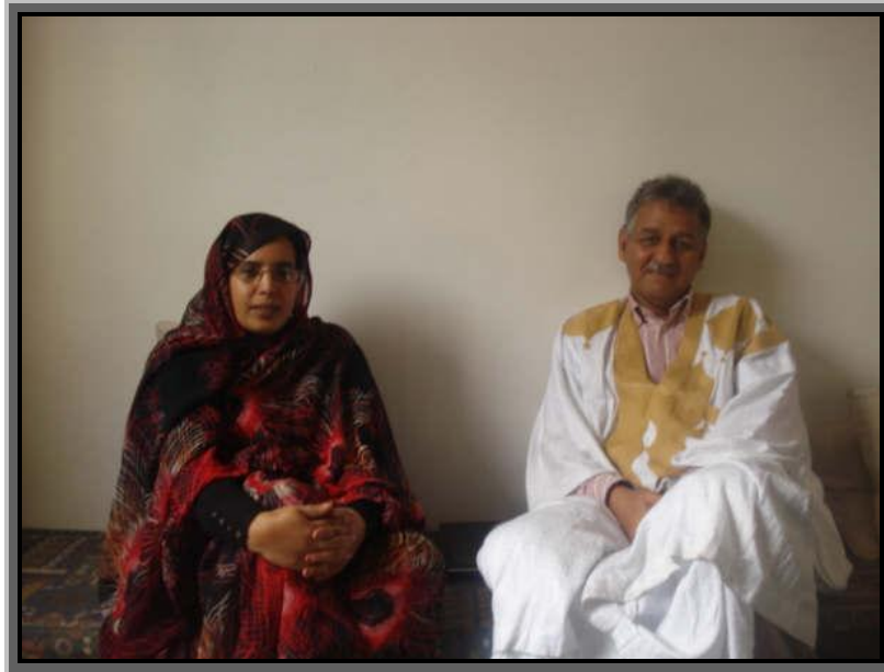
Sra. Fatma El Mehdi y Exmo. Embajador Ahmed Mulay Ali Hamad

las mismas oportunidades en el área educativa, ya que para ir a estudiar al extranjero se requiere que tengan buenas calificaciones y por lo general las mujeres obtienen mejores notas, por lo que hay un mayor porcentaje para salir.