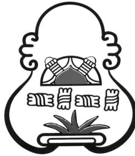
Jeroglífico de Acambay

Este jeroglífico representa el maguey que se cultiva y explota en la región. El sol, la fuente de luz, calor y vida; la cueva que se localiza en la Peña Redonda y los peñascos que se encuentran en la cordillera que rodea a Acambay.