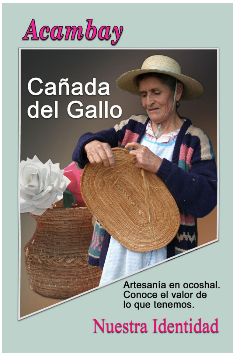
Fig. 2.4 Las mujeres de la comunidad de Cañada del Gallo, municipio de Acambay, Estado de México, se dedican a la elaboración de la artesanía en ocoshal. Diseño y fotografía: Héctor Andrade Pioquinto.

Carteles publicitarios para promoción de las artesanías producidas por los artesanos del Municipio de Acambay, Estado de México.