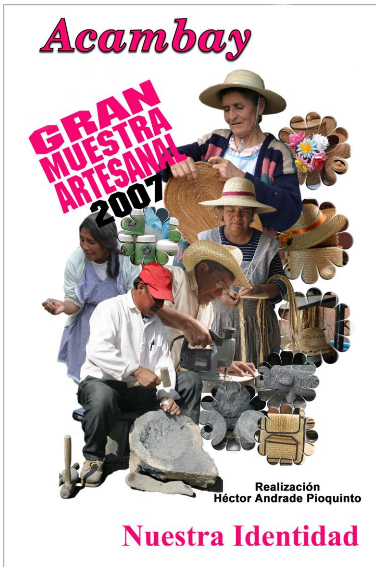
Fig. 2.5 Cartel para promocionar a los artesanos de Acambay, durante la Gran Muestra Artesanal 2007 celebrada en el auditorio del municipio de Acambay, Estado de México, durante el mes de septiembre de 2007. Diseño y Fotografía: Héctor Andrade Pioquinto.

Carteles publicitarios para promoción de las artesanías producidas por los artesanos del Municipio de Acambay, Estado de México.