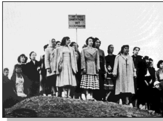
Las mujeres se solidarizan con los mineros

Ya desde los inicios del conflicto, una vanguardia de mujeres, la mayoría esposas de mineros de la comunidad, venciendo el obstáculo del temor y la vergüenza, se habían hecho presentes en las reuniones (a las que sólo asistían hombres) donde se definían las acciones a seguir, luego de la suspensión de las labores en la mina.