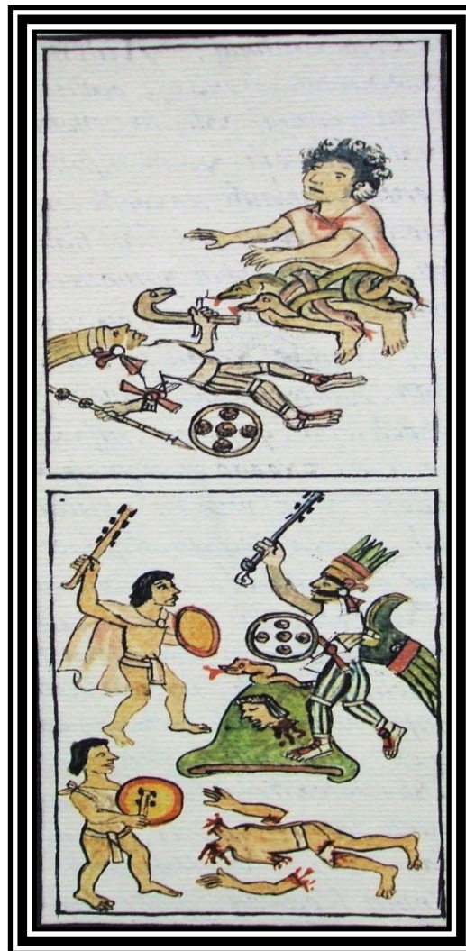
La saga del nacimiento y triunfo de Huitzilopochtli, viñeta del Códice Florentino .

poderoso hijo de Zeus-Júpiter nació de madre humana, Alcmena en una noche de pasión que se extendió tres veces más de lo normal. Huitzilopochtli nació de Coatlicue y sin padre evidente, fue concebido por un acto divino. 547 Hércules cuya característica principal es una fuerza sobrenatural y gran destreza en la guerra, mata a sus hijos y es condenado a obedecer a Euristeo que le encomienda cumplir doce trabajos . Huitzilopochtli desde el mismo parto establece su poderío beligerante: recién nacido mata a sus hermanos mayores, y descuartiza a la Coyolxauhqui. Establece su poderío desde el nacimiento.