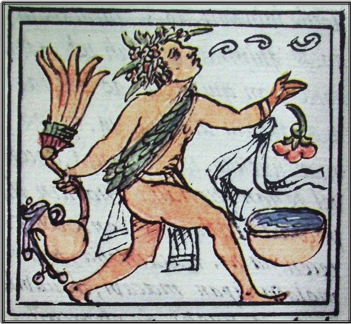
Las figuras del goce indígena del vino remiten a las antiguas imágenes Báquicas. Códice Florentino

La posibilidad del goce en su consumo queda anulada: en las retóricas produce adulterios, estupro y corrupción de vírgenes; el pulque procede los hurtos y robos; latrocinios y violencias; las maldiciones y murmuraciones y detracciones, las vociferáis riñas y gritas: Los antiguos eran severos en la restricción de su consumo: “Lleva al pecado de la soberbia y la altivez, de su boca salen palabras destempladas. En fin lleva a la destrucción de la paz de la república y