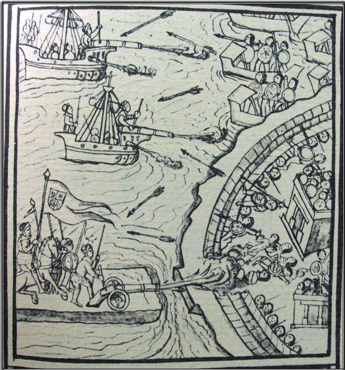
El sitio de Tenochtitlán. Códice Florentino.

bergantines y trabucos, pero también es un ejército que trabaja con la picota, destruye la obra pública prehispánica, los acueductos, las calzadas. El agua, la gran alteridad en el relato por primera vez jugaba de su lado ya que “la llave de toda la guerra” estaba en los bergantines. Con ella cumplirían el sitio de Tenochtitlan.