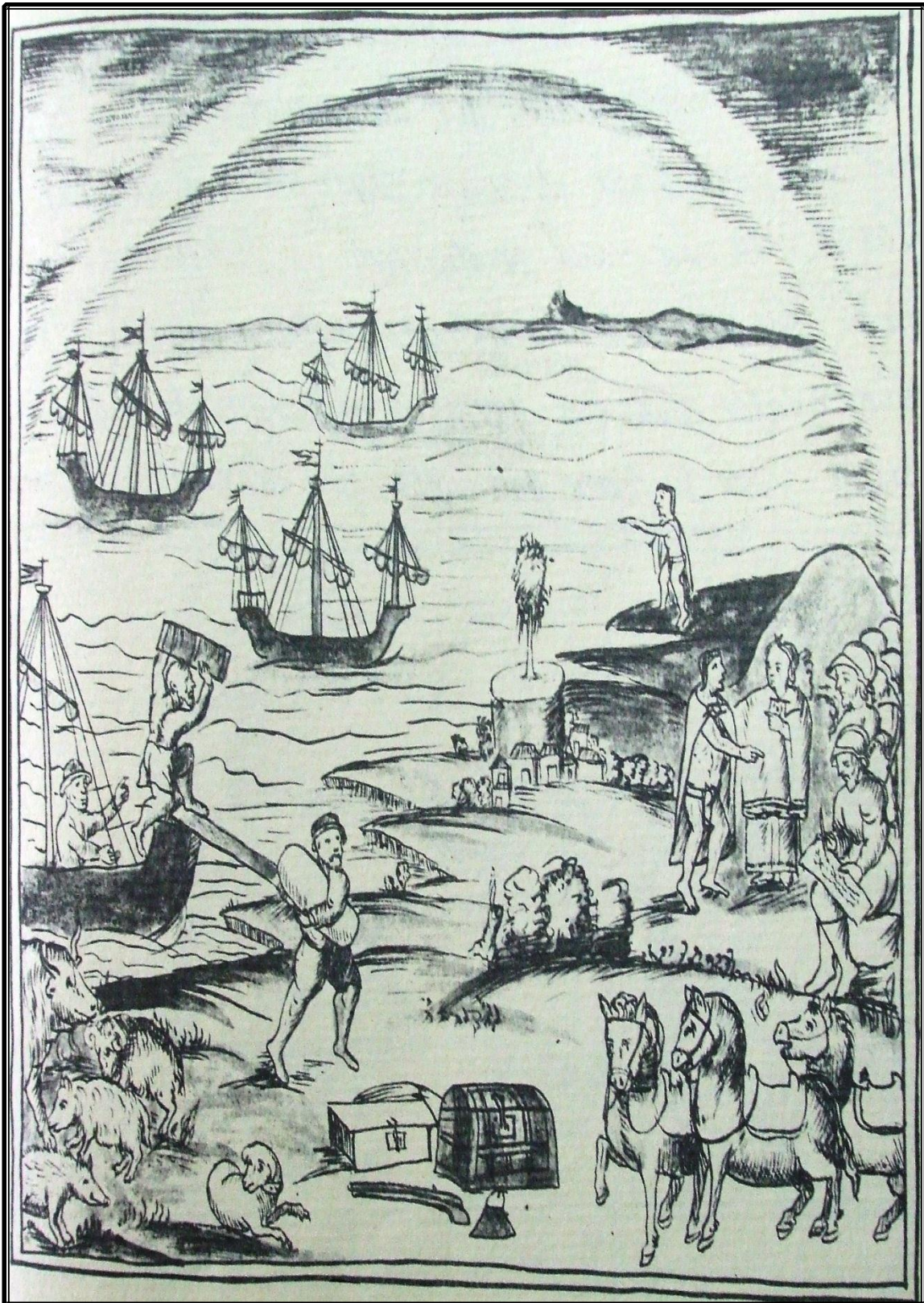
La invención del Nuevo Mundo. Códice Florentino.