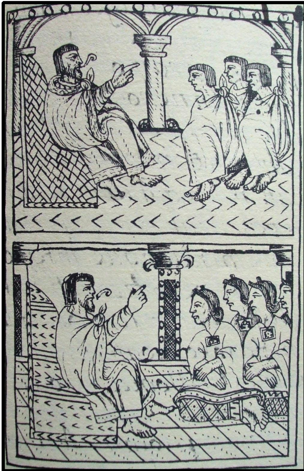
Las exhortaciones a los jóvenes en el cultivo de si para un horizonte sobrenatural configura la trama de los huehuetlatolli . Códice Florentino