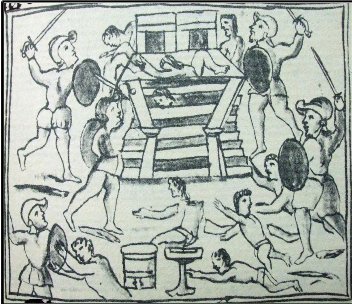
Las guerras de Dios. Códice Florentino.

de gente y tan animosa y diestra en el pelear, y con tantos géneros de armas para nos ofender, salimos tan libres. 182