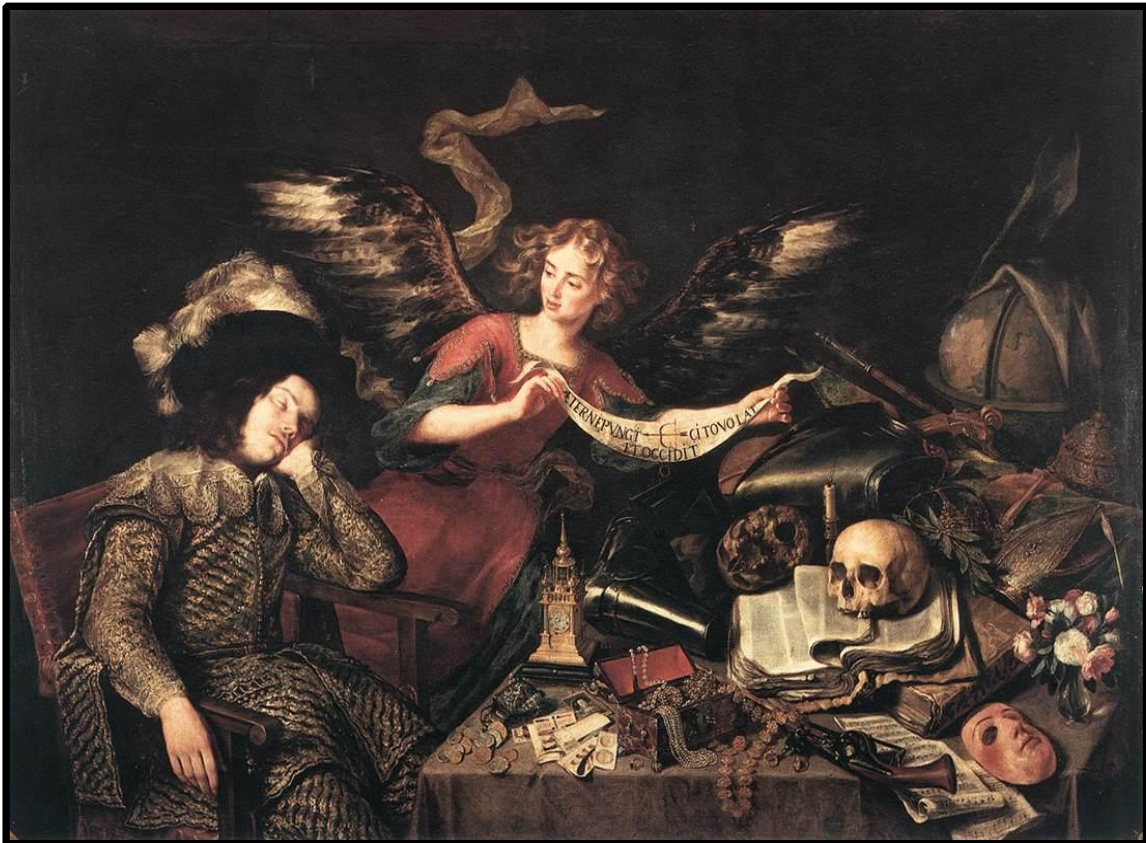
El sueño del caballero de Antonio de Perea. En Europa un mundo de alegorías se apropia del horizonte de la caballería.

La “forma de vida más bella” en el siglo XIV y XV se acerca más a un juego noble. Torneos y justas bajo la sociedad cortesana tienen sentido como ideales éticos para los nobles, en una lógica de burla y juego frente a la paulatina pero firme mecanización de la guerra. En ese mundo la caballería es útil para la construcción del Estado, estableciendo un modelo cortés para ahuyentar el tedio y la molicie de la Corte. El regreso de los héroes de la Antigüedad se realiza para la formación del cortesano. Los manuales y el ideal caballerescos sirven ahora para definir y decantar la moral del Príncipe. Los militēs en la sociedad cortesana, frenan los movimientos de ascenso social 159 en un mundo que está cambiando. Un simulacro que anuncia al Quijote.