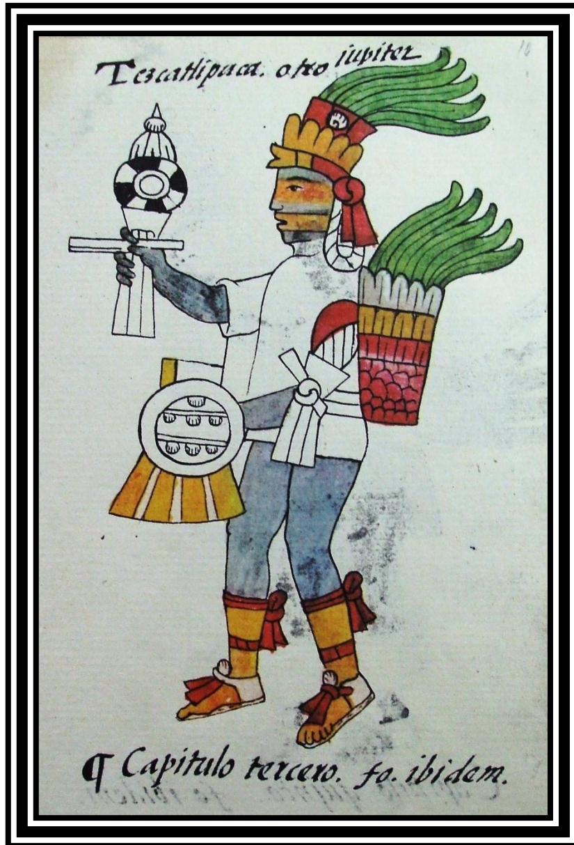
El Tezcatlipoca del Códice Florentino

El otro dios emblemático del panteón mexica era Tezcatlipoca. Según Sahagún “era tenido como verdadero dios, e invisible, el cual andaba en todo lugar, en el cielo, en la tierra y en el infierno; y tenían que cuando andaba en la tierra movía guerras, enemistades y discordias, de