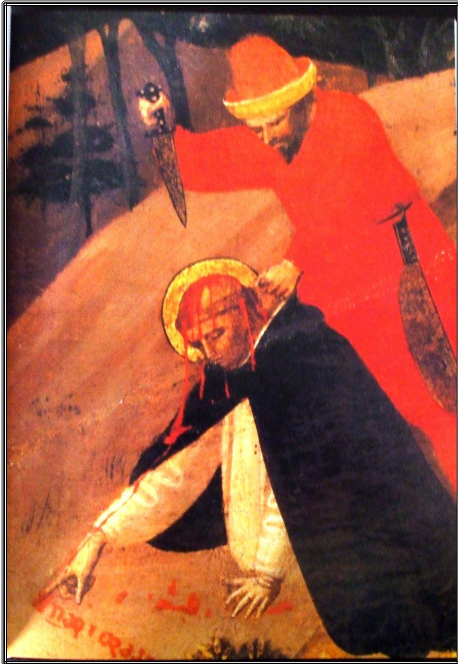
Morir por la fe, superar la carne, llegar a la santidad por el martirio. Detalle del Tríptico de San Pedro Mártir , 1425.