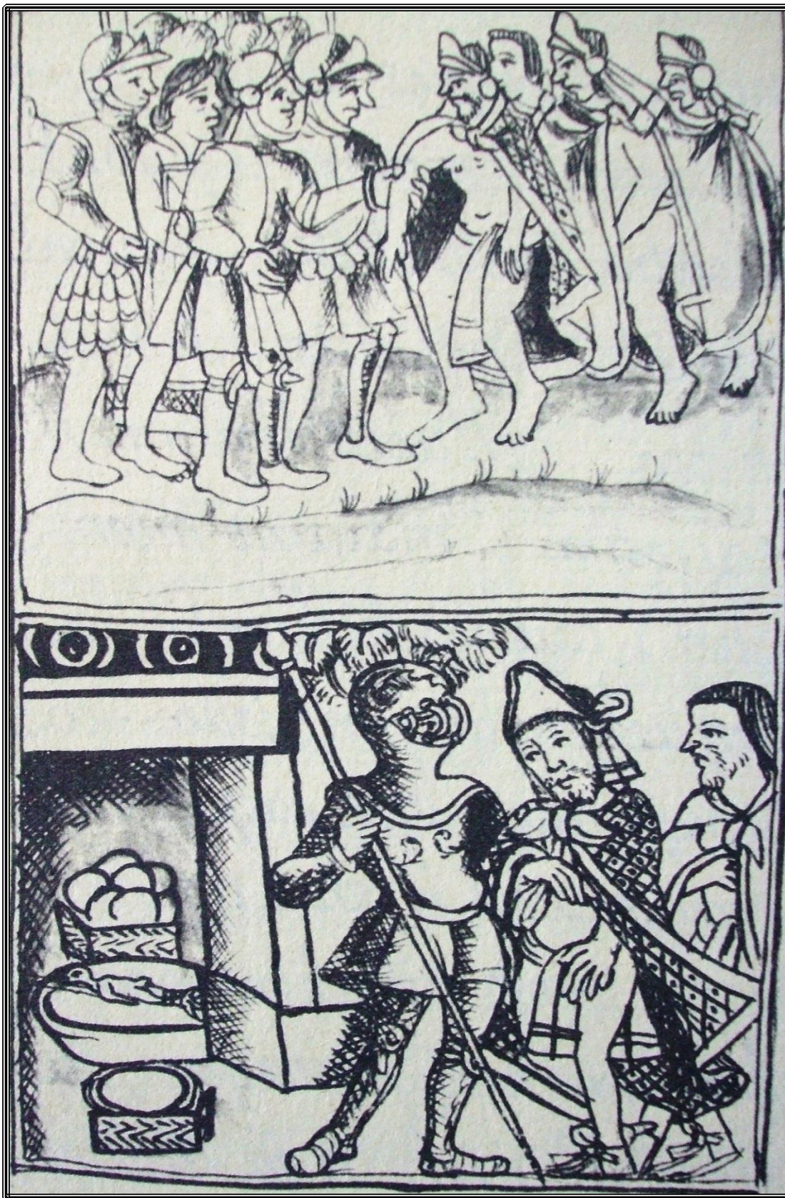
El cautiverio del Señor bárbaro. Códice Florentino.