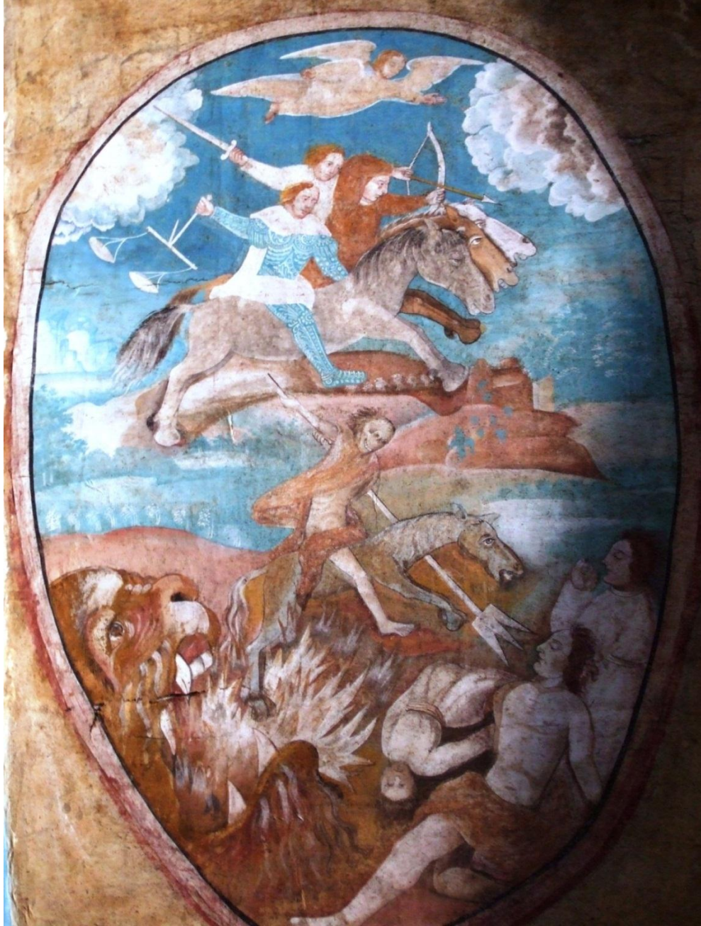
Los jinetes siguen a la apertura de los siete sellos: “Se les dio el poder sobre la cuarta parte de la tierra, para matar con la espada, con el hambre, con la peste y con las fieras de la tierra ”. Apocalipsis 6:8. Iglesia de Tecamachalco, siglo XVI.

expansión mongola por el Oriente ocurre una explosión de imágenes, conteos y miedos desencadenados por el Otro.