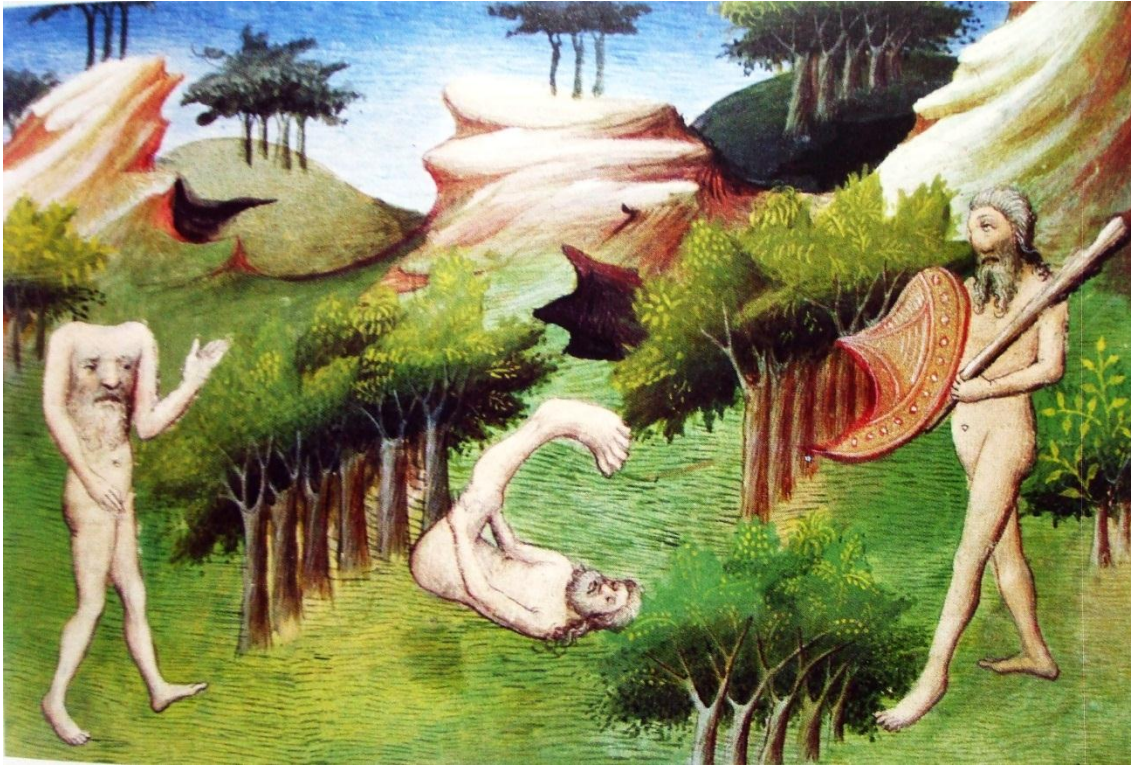
En los confines de la cristiandad se encuentran razas fantástica. Livre de Merveilles , siglo XV.

La embajada de Guillermo de Rubrock fue concebida por el monarca francés San Luis. Es de origen flamenco, peleó en Egipto contra el infiel, es un sujeto “que ha visto” y luchado desde varias fronteras la expansión del cristianismo. Su viaje fue de 1253 a 1255. Desde Siria escribe su Itinerarium . Su mirada es amplia, horizontal; su pluma rítmica, capaz de transmitir múltiples sucesos de su experiencia. Acerca al otro al mundo de la corte: está escribiendo para la mirada del rey San Luis. En su encuentro con la otredad se apoya en una autoridad para ejercer la mimetización: en Eclesiástico 1 “Pasará a tierra de pueblos extraños, en todo probará lo bueno y lo malo”. Todo un principio etnográfico para transitar por tierra de infieles. Pero es un visitante encubierto, sabe fingir, su travesía no debe ser interpretada como una embajada, a todos les decía en su camino que “iba a tierra de infieles en cumplimiento de la regla de nuestra Orden”. La tradición