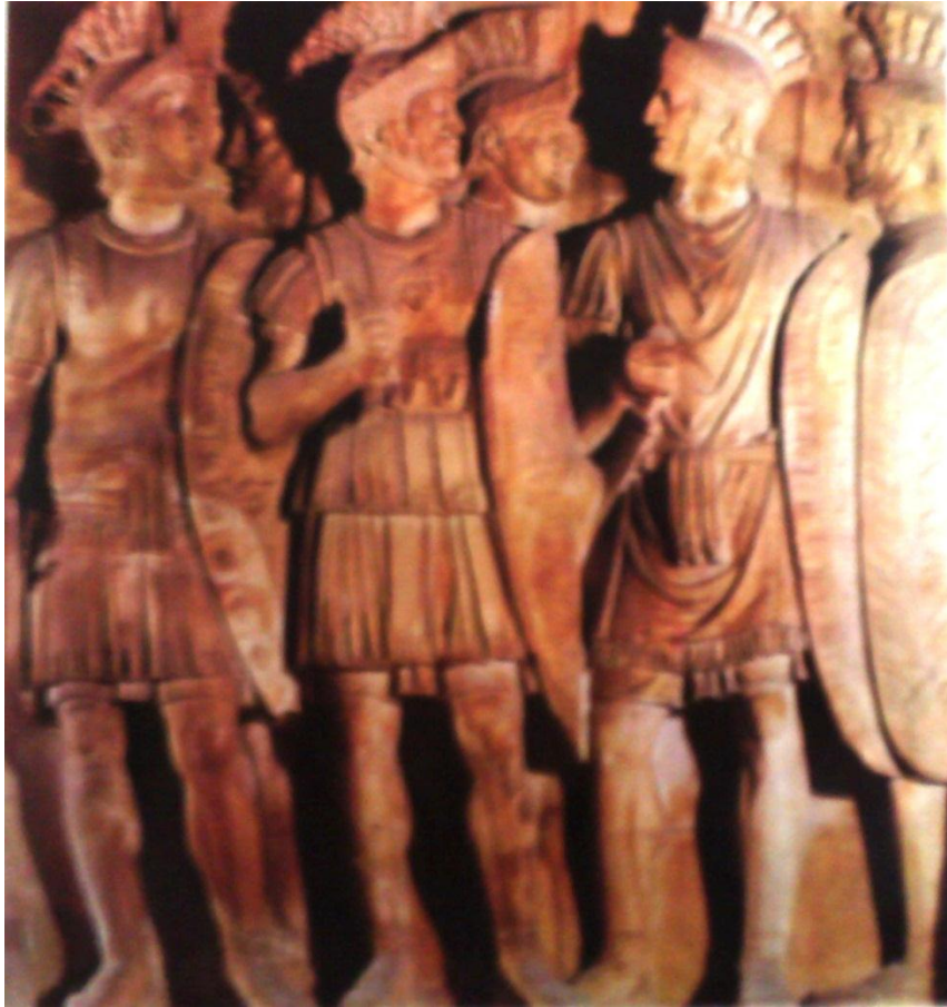
La poderosa maquinaria del ejército romano. Detalle de centuriones.

El ejército en el transcurso de la historia de Roma pasó a ser una figura de frontera y alteridad, de resguardo de la identidad republicana e imperial. Para el contexto urbano de la ciudad eterna la imagen castrense parece ajena. Los civiles “ya sólo conocen al soldado en permiso o al veterano retirado, es decir, cuando vuelven a la vida civil. El verdadero ejército aparece en circunstancias esporádicas, pero dramáticas y traumatizantes, dejando una huella profunda en su memoria: cuando el suelo italiano se convierte en campo de batalla entre los pretendientes al trono imperial”. 101 El papel político de la milicia estaba relacionado con el ascenso de los generales al poder, o la caída de algún César que les había dado la espalda. En todo caso pertenecían a la clientela de algún personaje.