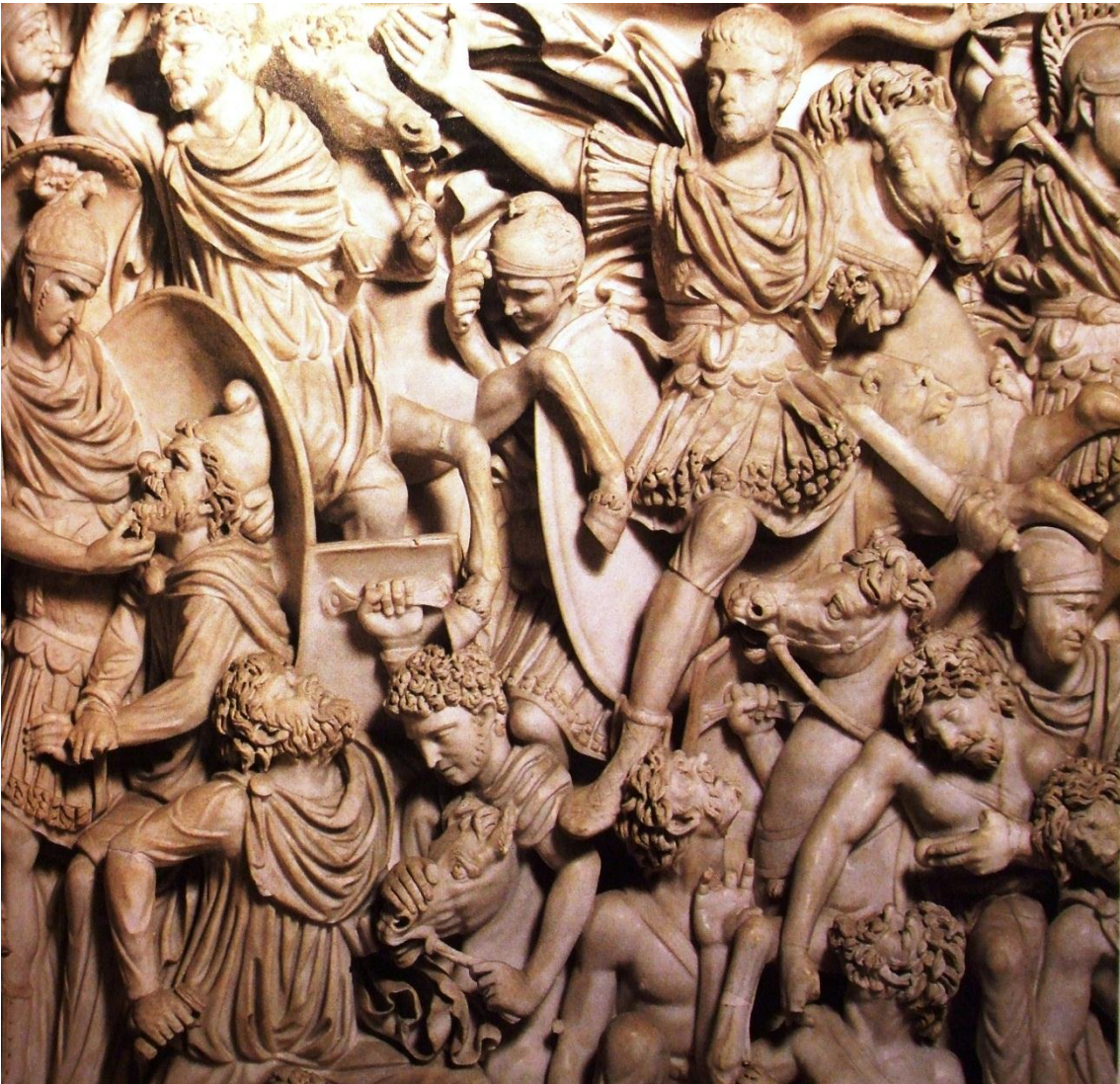
Escena entre una batalla entre legionarios y barbaros en un sarcófago de Ludovisi. En: Liberati y Bourbon, Roma Antigua , Barcelona, FOLIO, 2005.

y el trabajo prolongado, y mucho menos la sed y el calor fuerte; sí están acostumbrados al frío y al hambre por el tipo de clima y de territorio en los que se envuelven. 387