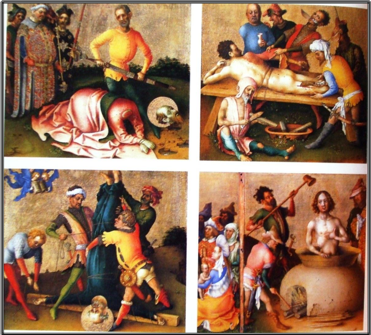
Imágenes de martirios. En ellos el cuerpo se fuga al cielo. Retablo que representa el martirio de los apóstoles, siglo XV, de Stefan Lochner.

alabanza humana; entonces puedo afirmar que todos esos sufrimientos son muy poca cosa para alcanzar la gloria del cielo y la merced divina.