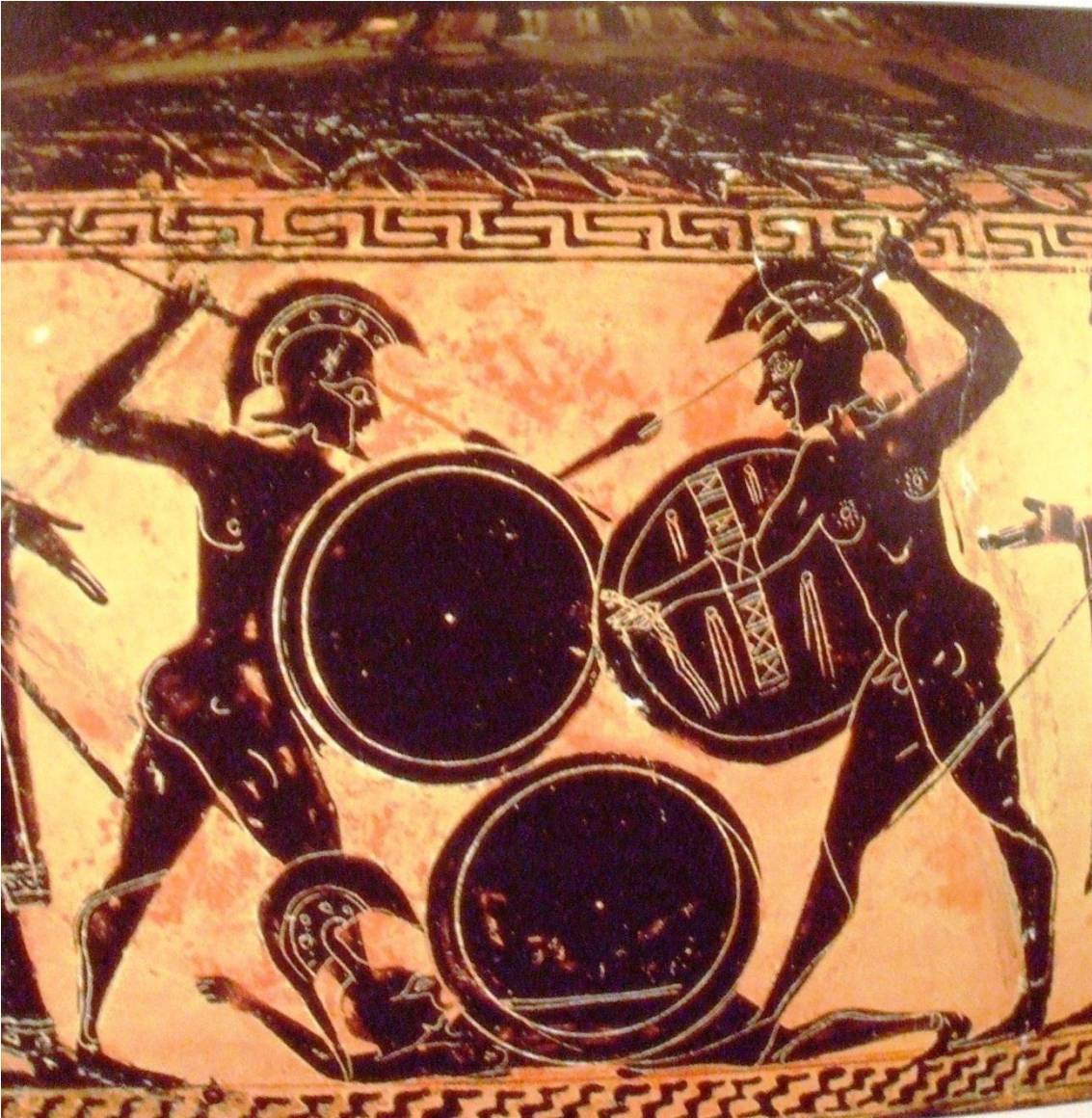
El combate heroico, la disputa por un guerrero muerto. Hidra ática de figuras negras hacia 560 a. C. En: Vidal-Naquet, El mundo de Homero...

La guerra es la búsqueda de un trofeo, un honorífico recuerdo personal: el guerrero muerto y su extensión en la batalla, su armadura, es la meta, el premio a la acción bélica. Héctor despoja del ajuar bélico al extinto Patroclo. El destino de las armaduras es tan importante que el propio Ajax entra en tragedia por la armadura hecha por Hefestos para Aquiles, al ser otorgada a Odiseo. 65 También son un trofeo las