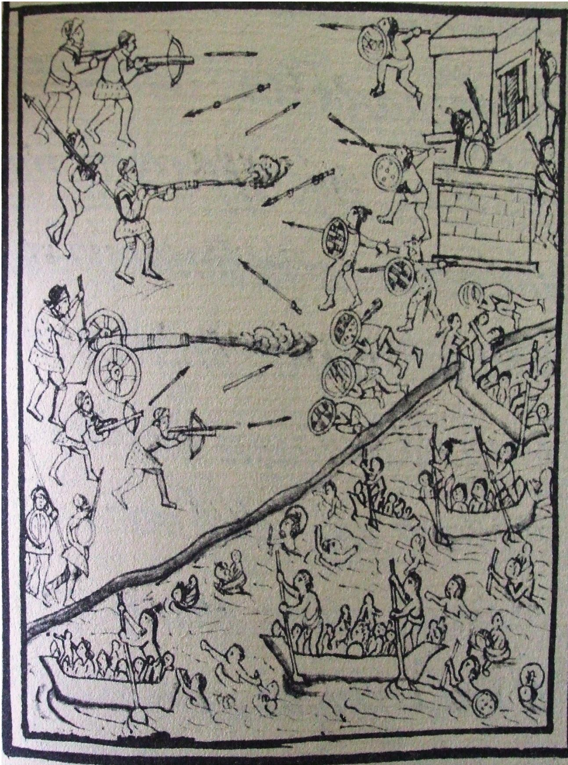
La ciudad conquistada. Códice Florentino .