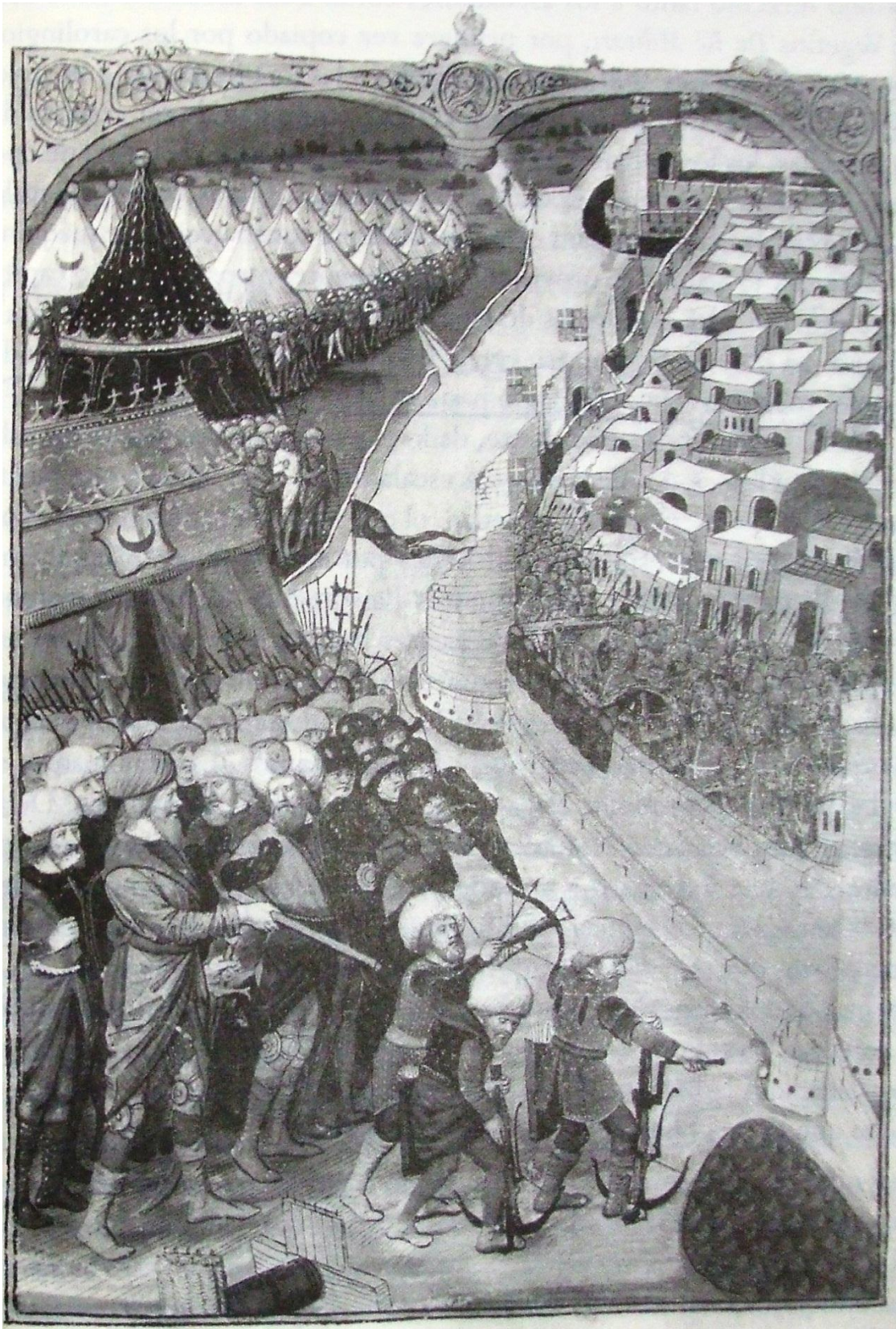
El sitio de Rodas, 1480. En: Keen (edi.) La guerra en la Edad Media, Madrid, OCÉANO, 2005, p. 237.