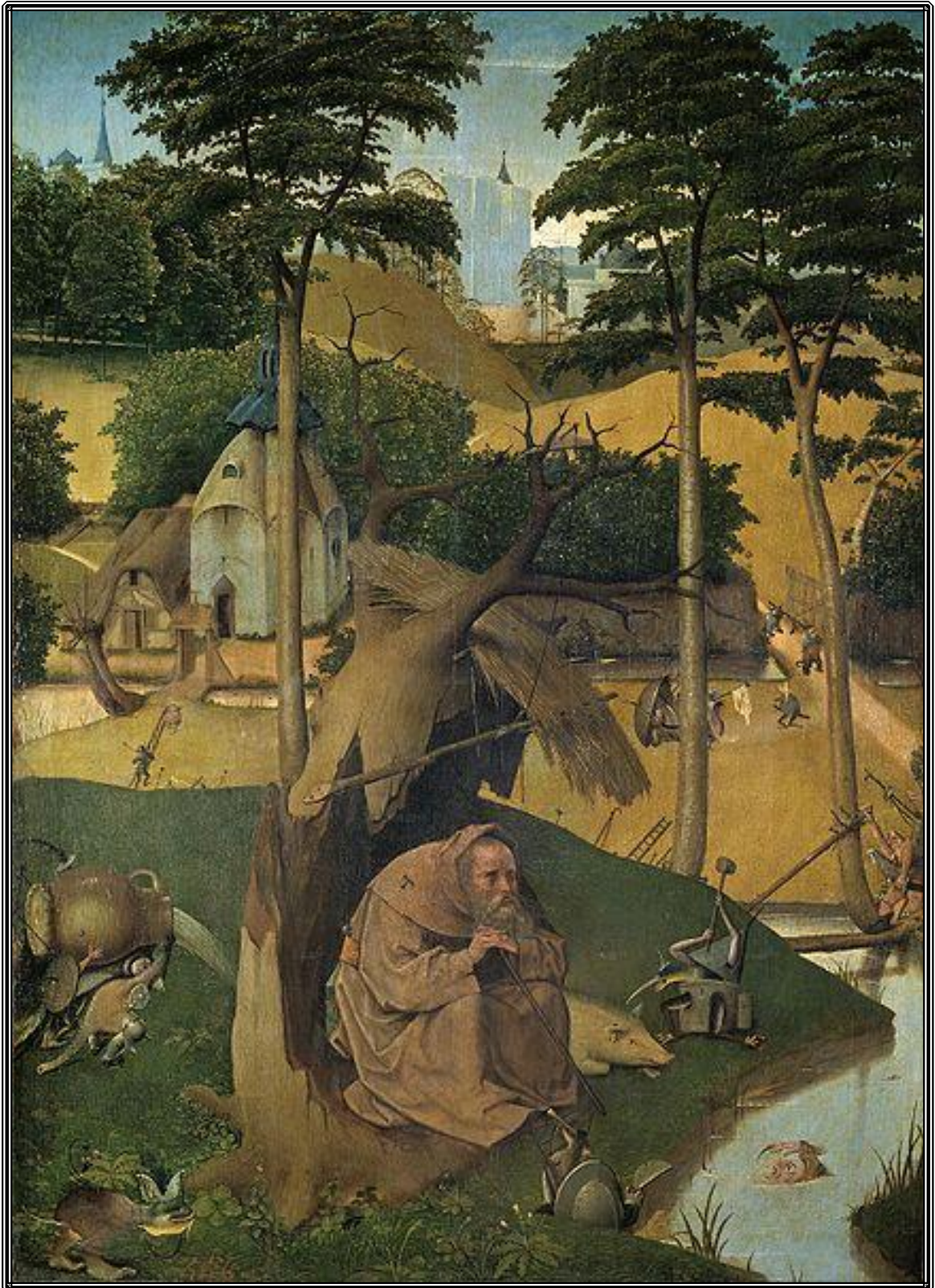
La salida del mundo es la gran opción de los seguidores del odio del mundo. Las tentaciones de San Antonio de El Bosco.