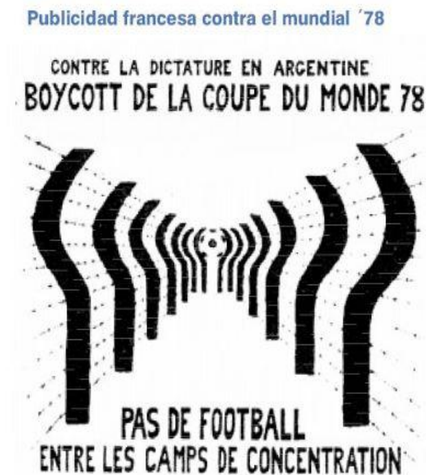
IMAGEN 2. Publicidad francesa contra el Mundial 1978.

FUENTE: http://www.taringa.net/posts/imagenes/5027679/El-movimiento-a-boicotear-la-Copa-del-Mundo-de-1978.html