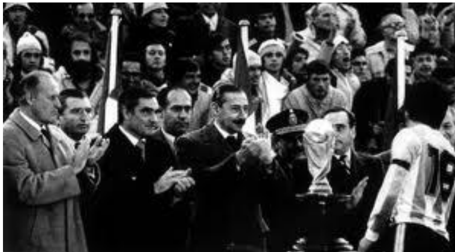
Imagen 7. Entrega de la Copa Mundial al Campeón, Argentina.