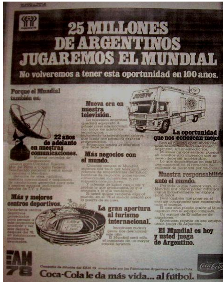
Imagen 1. Primera propaganda de Coca Cola en el Mundial.