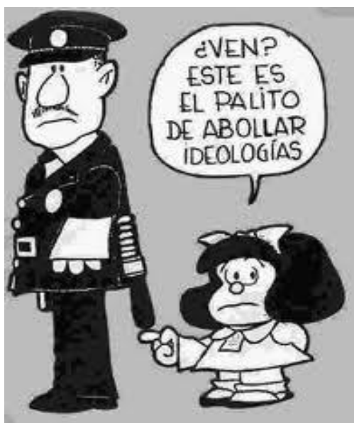
IMAGEN 1. Propaganda de Los Montoneros.

Se decidió usar esta imagen, ya que en el libro de Liliana Caraballo, Noemí Charlier y Liliana Garulli, La dictadura (1976-1983) Testimonios y documentos , en la página 91, se encuentra que ésta era utilizada por los Montoneros y otros grupos pro-peronistas.