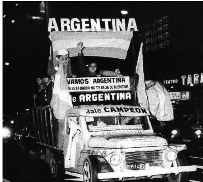
IMAGEN 5. FESTEJOS AL FINAL DEL PARTIDO CONTRA PERU EN LAS CALLES ARGENTINAS.