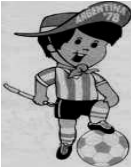
Imagen 6. Gauchito, propaganda oficial del Mundial.