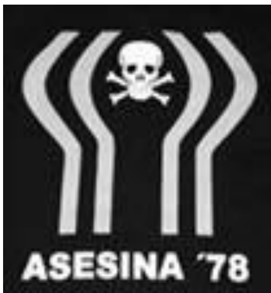
Imagen 4. Propaganda contra el Mundial 1978