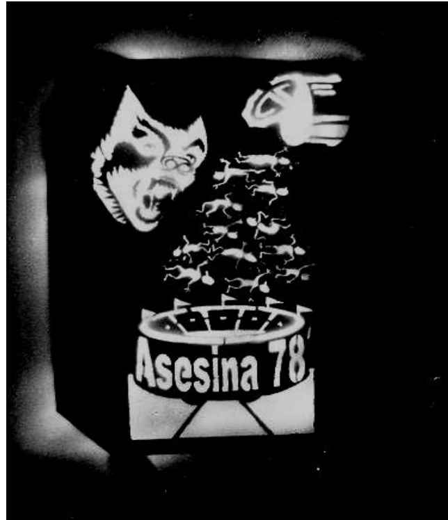
Imagen 4. Propaganda del boicot contra Argentina que denota la ambivalencia que se vivió con el Mundial.