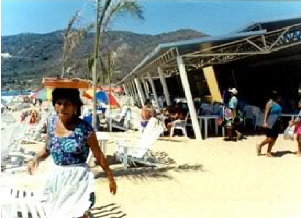
Figura 4: Fotografía donde se observa la venta informal de productos sobre la Costera de Acapulco.

Además también muy cerca de la zona costera, fueron expulsados gran cantidad de campesinos que eran legítimamente propietarios de sus tierras, ya que todo esto beneficiaría a los hoteleros, a los grandes comerciantes e inclusive a los mismos funcionarios públicos. Las nuevas construcciones contribuyeron a que la mancha urbana fuera creciendo con mucha rapidez hasta la actualidad.