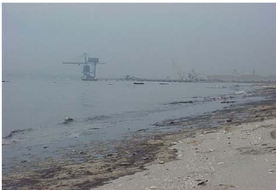
Figura 7: Foto donde se observa el descuido tan grande que existe en la costera.

Es un secreto a voces que los hoteles ilegalmente vierten sus desechos al mar, al igual que las grandes embarcaciones que visitan el puerto, y que se respete la ley al respecto, si es que la hay, y si no existe, promoverla hasta su promulgación y ejecución, por lo que el municipio debería poner mas atención a esta problemática.