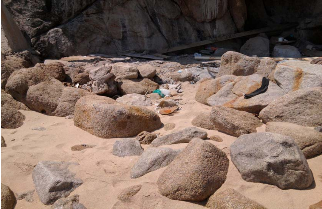
Figura 6: Foto donde se constata la problemática de la contaminación y que corresponde a la costera frente al hotel Torres Gemelas.

Algunos artículos, que se acordaron en esa Conferencia Intergubernamental que se elaboró en octubre de 1975 y diciembre de 1976, y que destacan aspectos importantes sobre la responsabilidad del Estado y Contaminación: