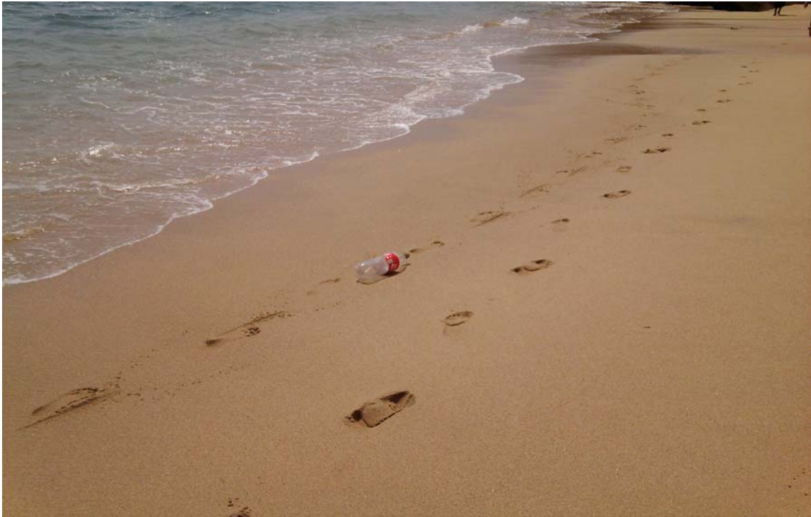
Figura 5: Foto donde se constata la problemática de la contaminación y que corresponde a la costera frente al hotel Copacabana.

recolección de basura, sin embargo el municipio no toma las medidas necesarias y aun mas en temporada alta.