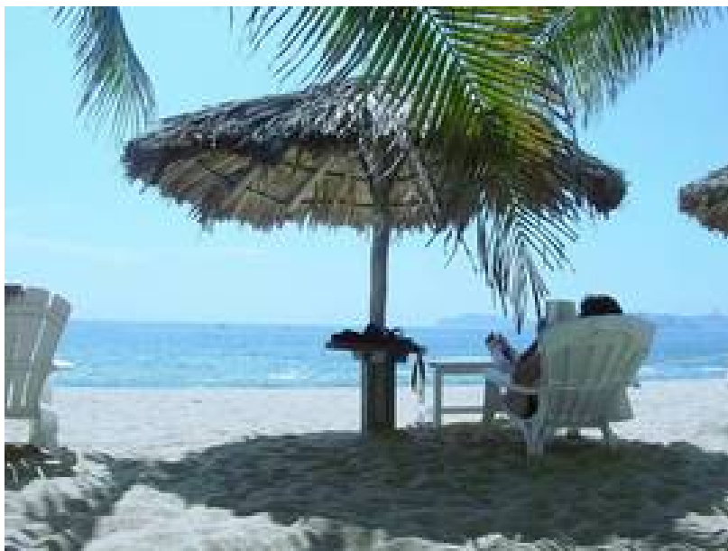
Figura 10: Cerca de 3 mil estudiantes quedaron sin trabajo este verano.

Aproximadamente tres mil estudiantes quedaron sin trabajo este verano, dada la falta de visitantes