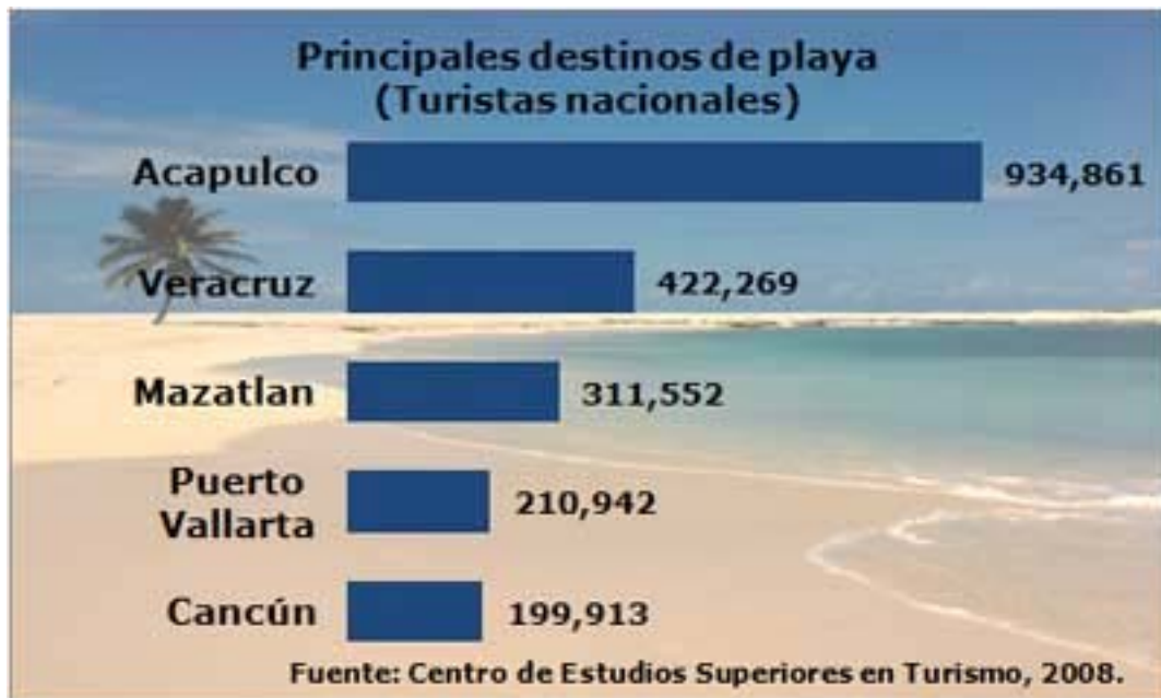
Figura 9: Grafica sobre los principales destinos de playa de México en el año 2008.

Al observar esta grafica, nos confirma que Acapulco es la parte de México mas visitada por el turismo nacional y extranjero, a diferencia de Veracruz, Mazatlán, Puerto Vallarta y de Cancún. Tan solo si se tiene anualmente 934,861 solo hablando de turistas nacionales, en caso de que el municipio pusiera más atención en el tema de higiene e inseguridad, se tendría un flujo aun mayor de turismo nacional e internacional.