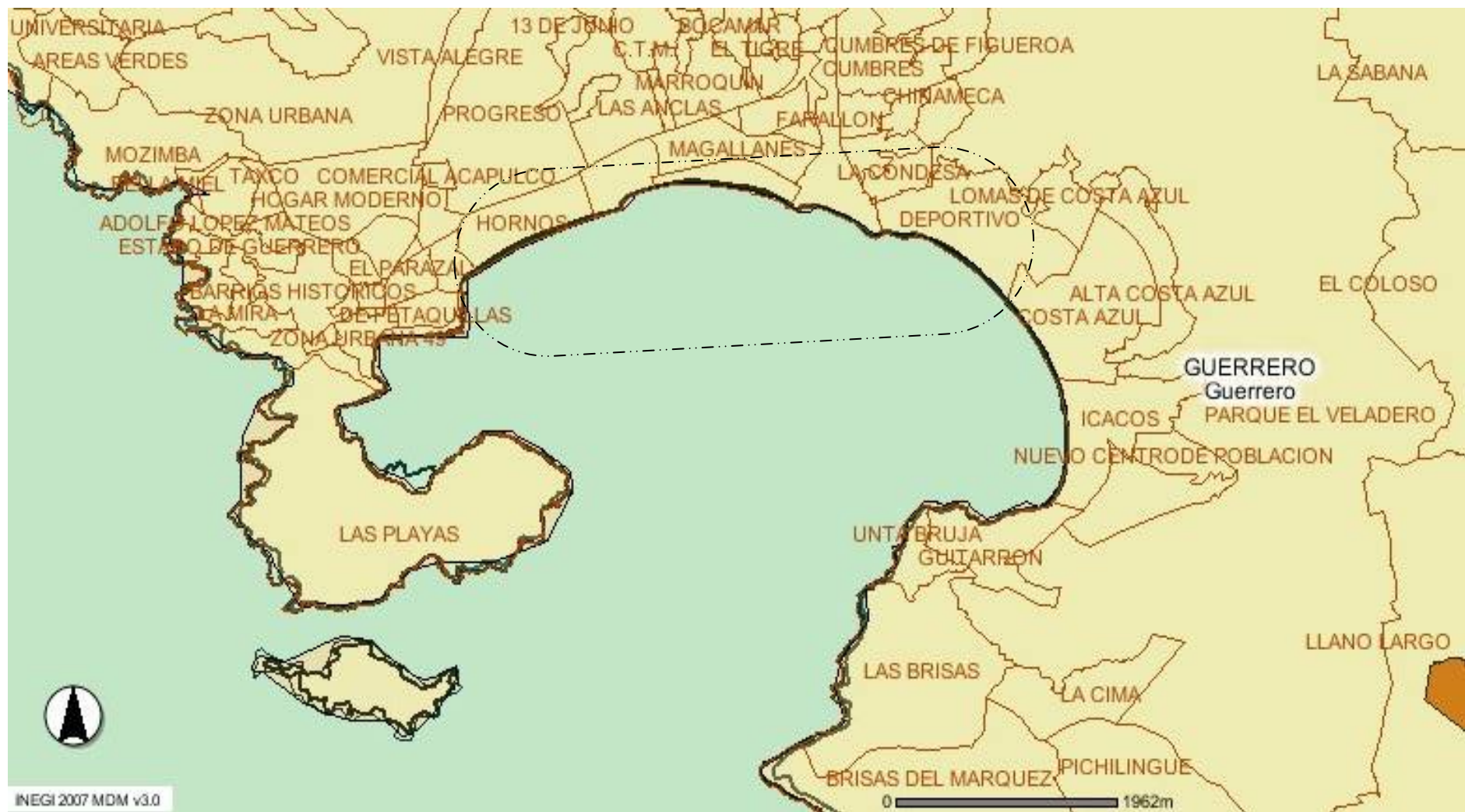
Figura 1: Localización de la zona de estudio, (entre líneas segmentadas).