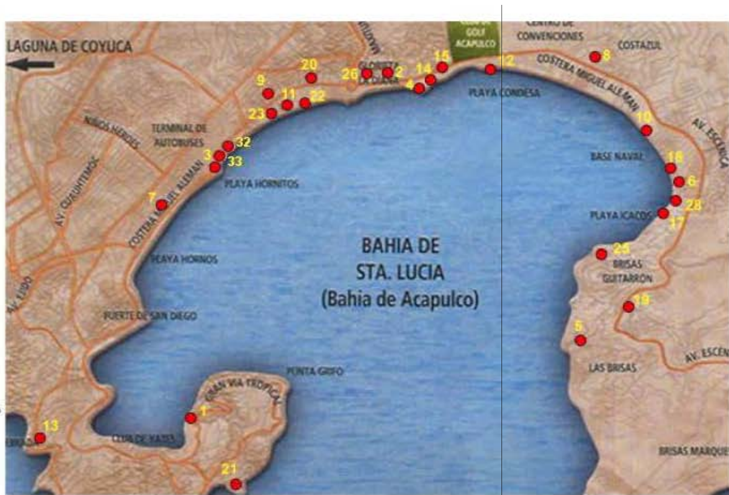
Figura 3: Localización de los principales hoteles ubicados en la zona Costera de Acapulco.