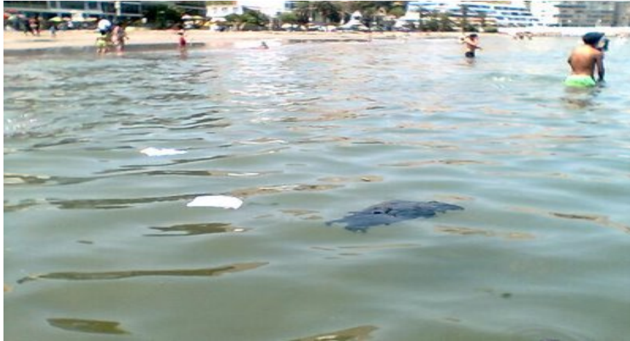
Figura 8: Foto donde se aprecia, la contaminación específicamente en el mar, en la zona costera.

“A través de las entrevistas que en 1985 realicé a funcionarios de varias Secretarías implicadas, se refiere que a partir de 1982: