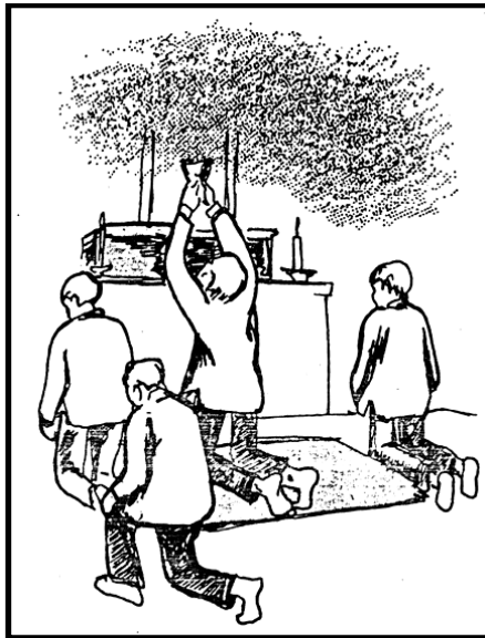
Fig. 5 Ritual de sahumar con copal, realizada por los xuaana' a los puntos cardinales en el altar de una capilla de barrio. Tomada de Santos y Gutiérrez (1989: 97).

protocolos de las fiestas, sahumando con copal los altares de las capillas de los barrios, danzando el son especial para ellos, entre otras cosas (Santos y Gutiérrez, 1989: 87-105).