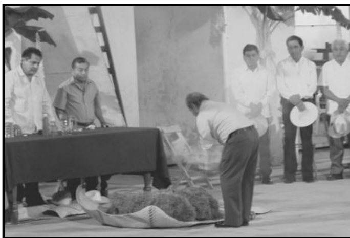
Fig. 4 Sahumando guixi niñu en la salutación de los xuaana '.