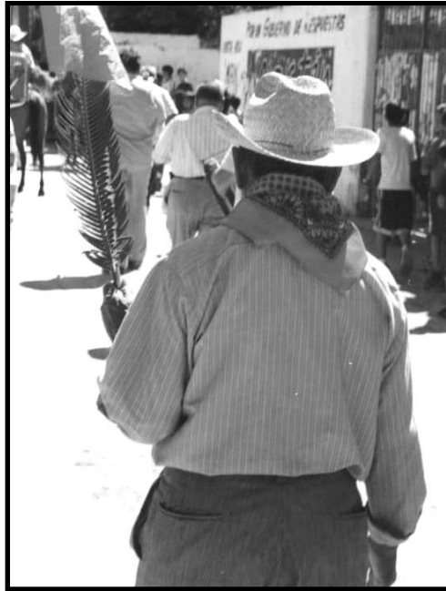
Fig. 1 Un xuaana' de Tehuantepec en la "Tirada de Frutas". febrero de 2002