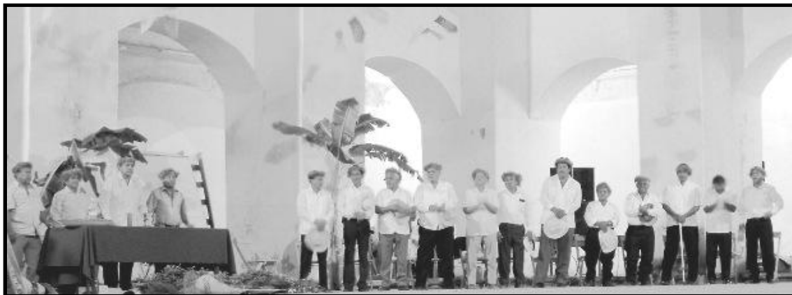
Fig. 3 Los xuaana' de Tehuantepec del 2009.