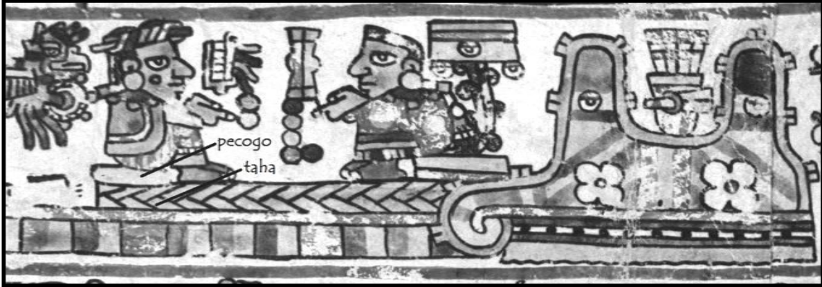
Fig. 7 Ejemplo del difrasismo estera-silla — o taha-pecogo — en un códice mixteco. Fragmento de la lámina 6 del códice Bodley.

Cabe agregar que ‘estera’ puede ser sustituido por el nahuatlismo ‘petate’ en el español de México y ‘silla’ por el sustantivo ‘asiento’ derivado del verbo ‘asentar’ que puede evocar mejor a los actuales hablantes del español la idea de ‘sede’. Aunque a nivel etimológico sede, silla y asiento son sinónimos, históricamente sus significados cobran ciertos matices. A la figura lingüística del difrasismo se refiere el mismo Córdova con la nota ‘los dos últimos es methapharice’. Múltiples ejemplos de éste difrasismo pueden verse en los códices mixtecos como el Selden , Becker I y el Bodley , por mencionar algunos, y en el Vocabulario de Córdova en contextos sagrados (cf. Smith Stark, 2002). 72